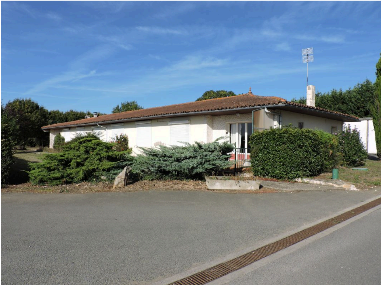
Ancien bâtiment de bureaux, à l'ouest de la rue, vu depuis le sud-est, démoli en 2020.