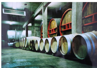
Un des chais vers 1990.