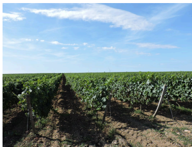
Paysage viticole près de la Chaignée. IVR52_20198503257NUCA