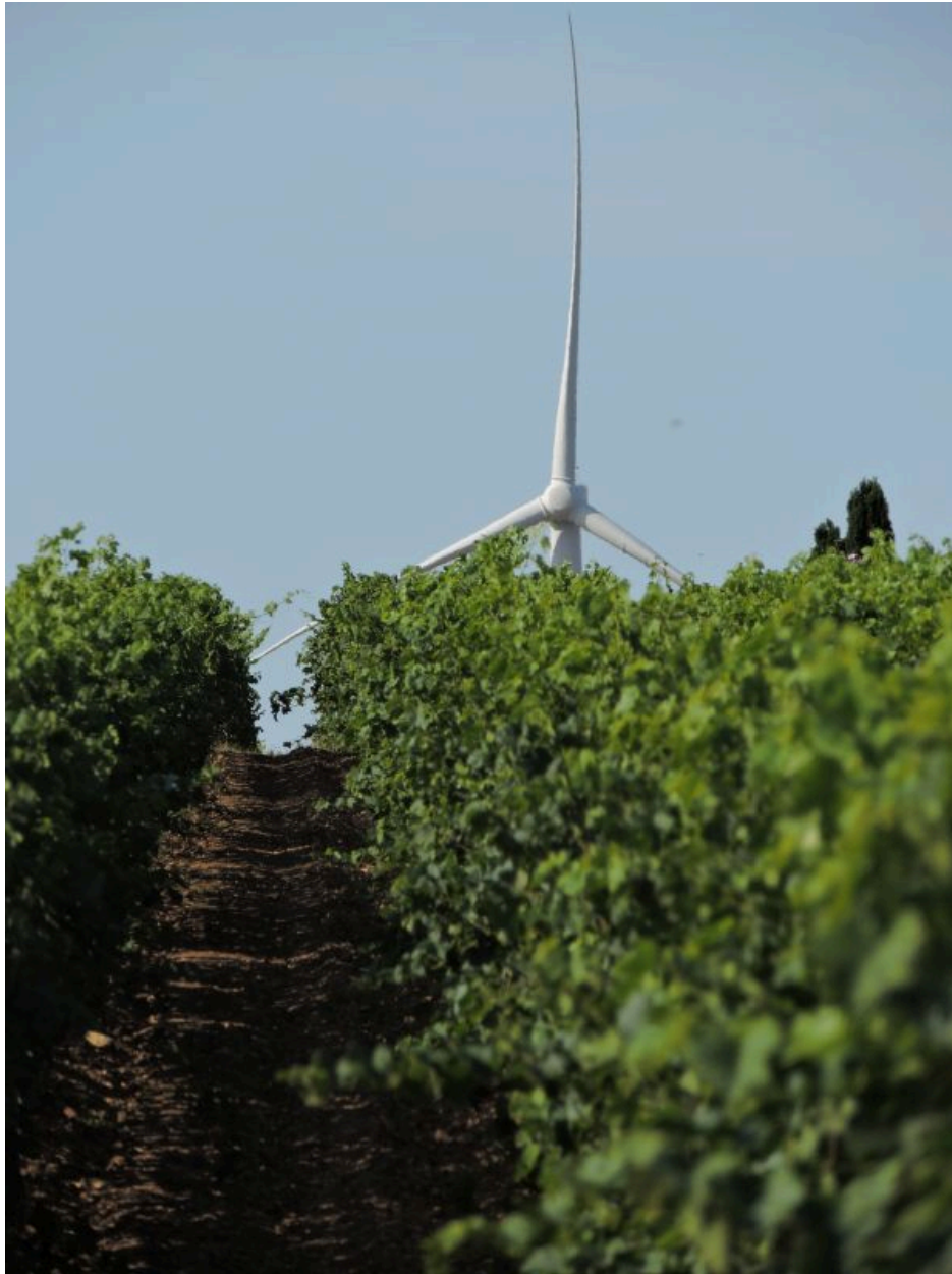
Paysage agricole près de la Chaignée.