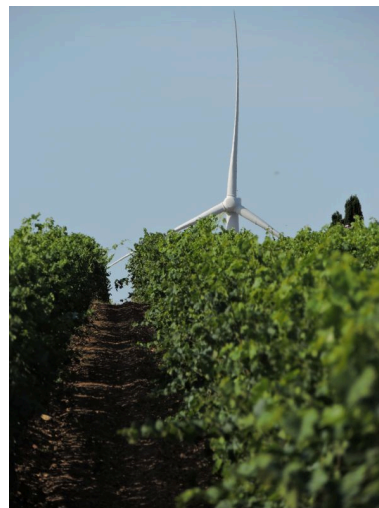
Paysage agricole près de la Chaignée.