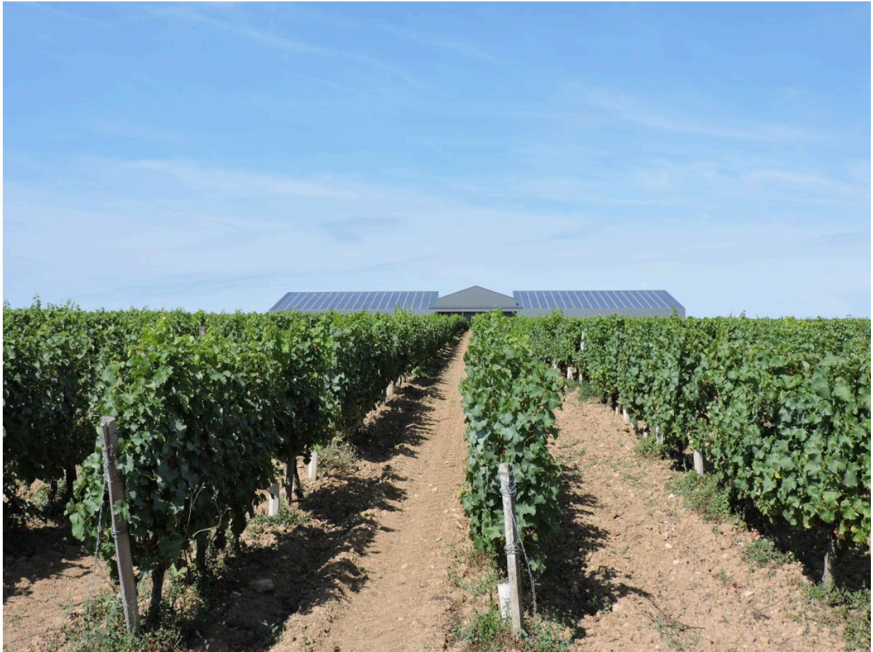
Le nouveau chai au milieu des vignes, vu depuis le sud-est.