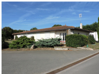
Ancien bâtiment de bureaux, à l'ouest de la rue, vu depuis le sud-est, démolé en 2020.