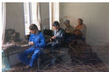
Atelier de taille de plants dans les années 1980-1990. IVR52_20198503723NUCA