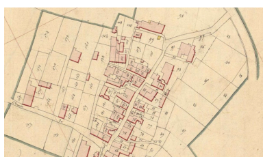
Les parcelles 168 et 170, à gauche, sur le plan cadastral de 1836.