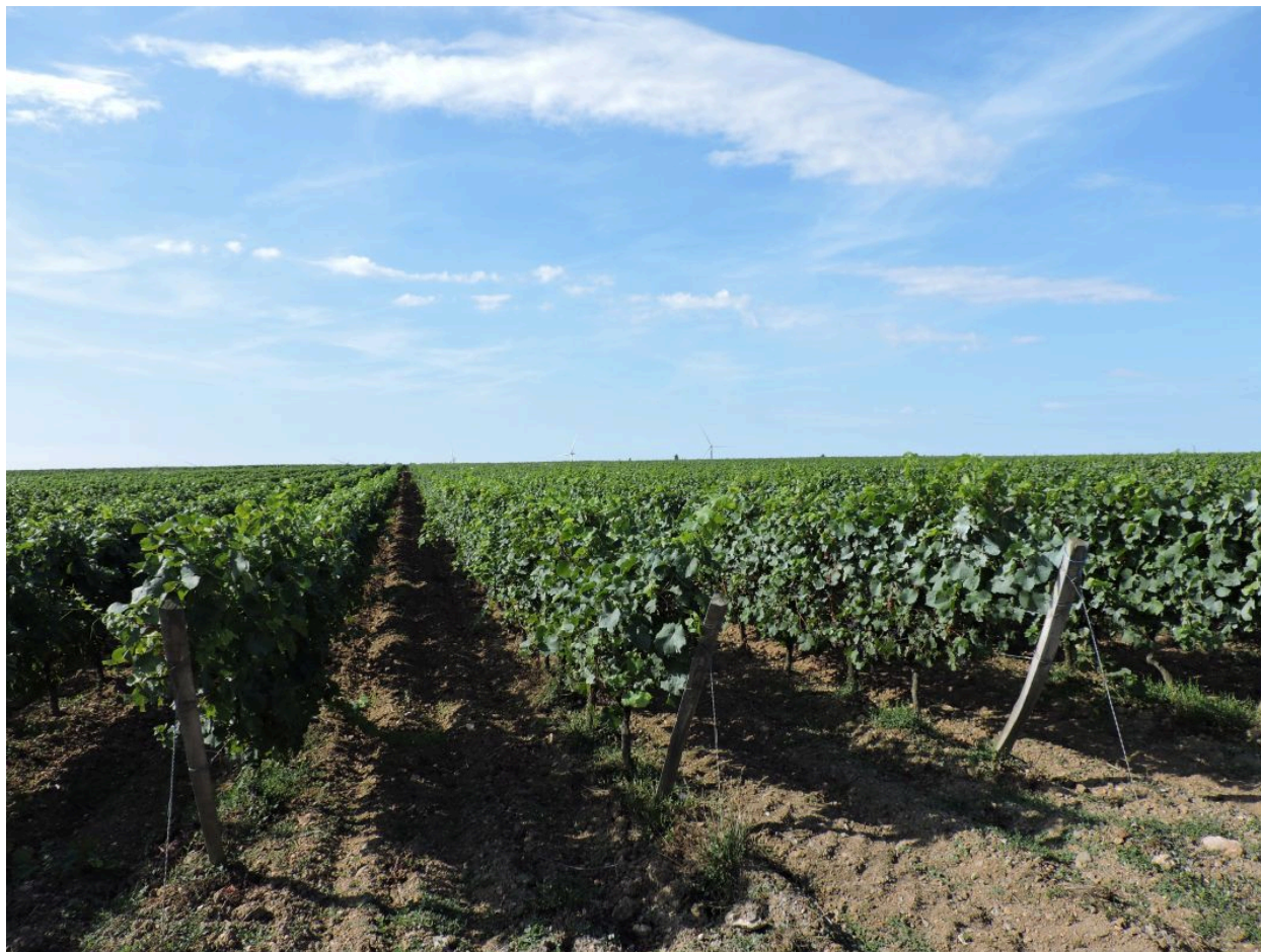
Paysage viticole près de la Chaignée.