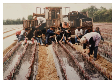
Travail de plantation dans les années 1980-1990. IVR52_20198503722NUCA