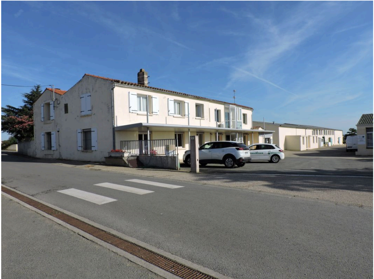
Le siège de l'entreprise Mercier, sur le site d'une ancienne ferme, vu depuis le sud.