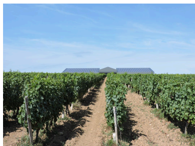
Le nouveau chai au milieu des vignes, vu depuis le sud-est.