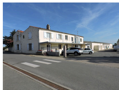
Le siège de l'entreprise Mercier, sur le site d'une ancienne ferme, vu depuis le sud. IVR52_20198503213NUCA