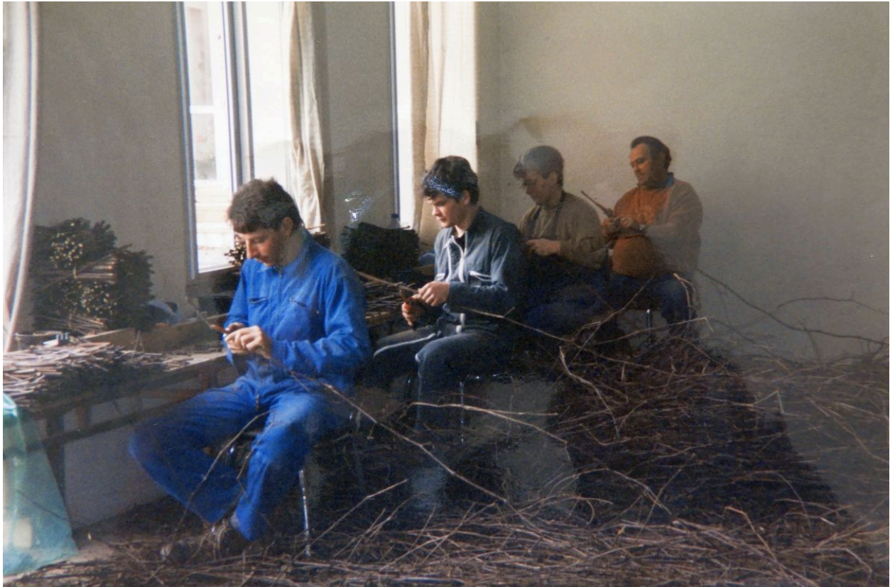
Atelier de taille de plants dans les années 1980-1990.