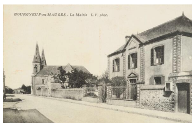
La mairie et de la rue de Vendée depuis l'ouest, carte postale, début du XXe siècle (AD Maine-et-Loire ; 19 Fi 1720). IVR52_20254900133NUCA