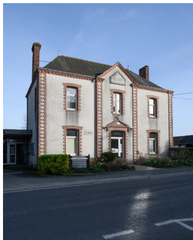
Façade principale.