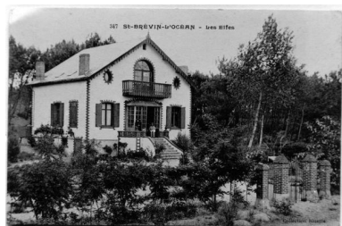
Elévation antérieure. Carte postale, [début 20e siècle].