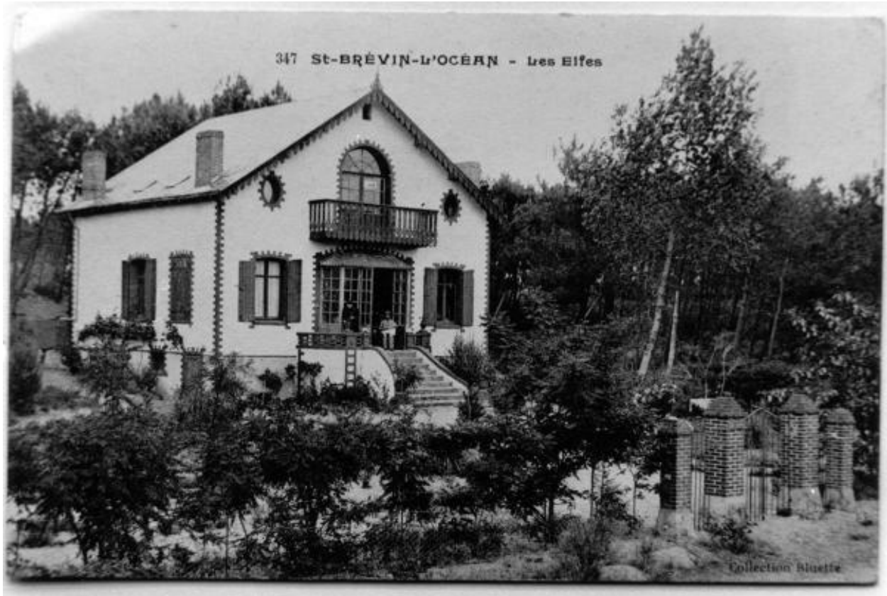
Élévation antérieure. Carte postale, [début 20e siècle].