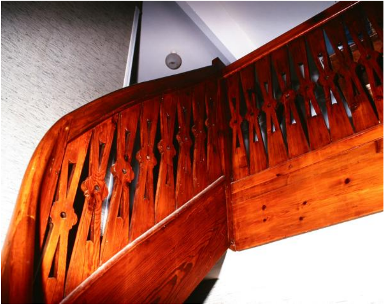
Villa les Elfes : escalier.