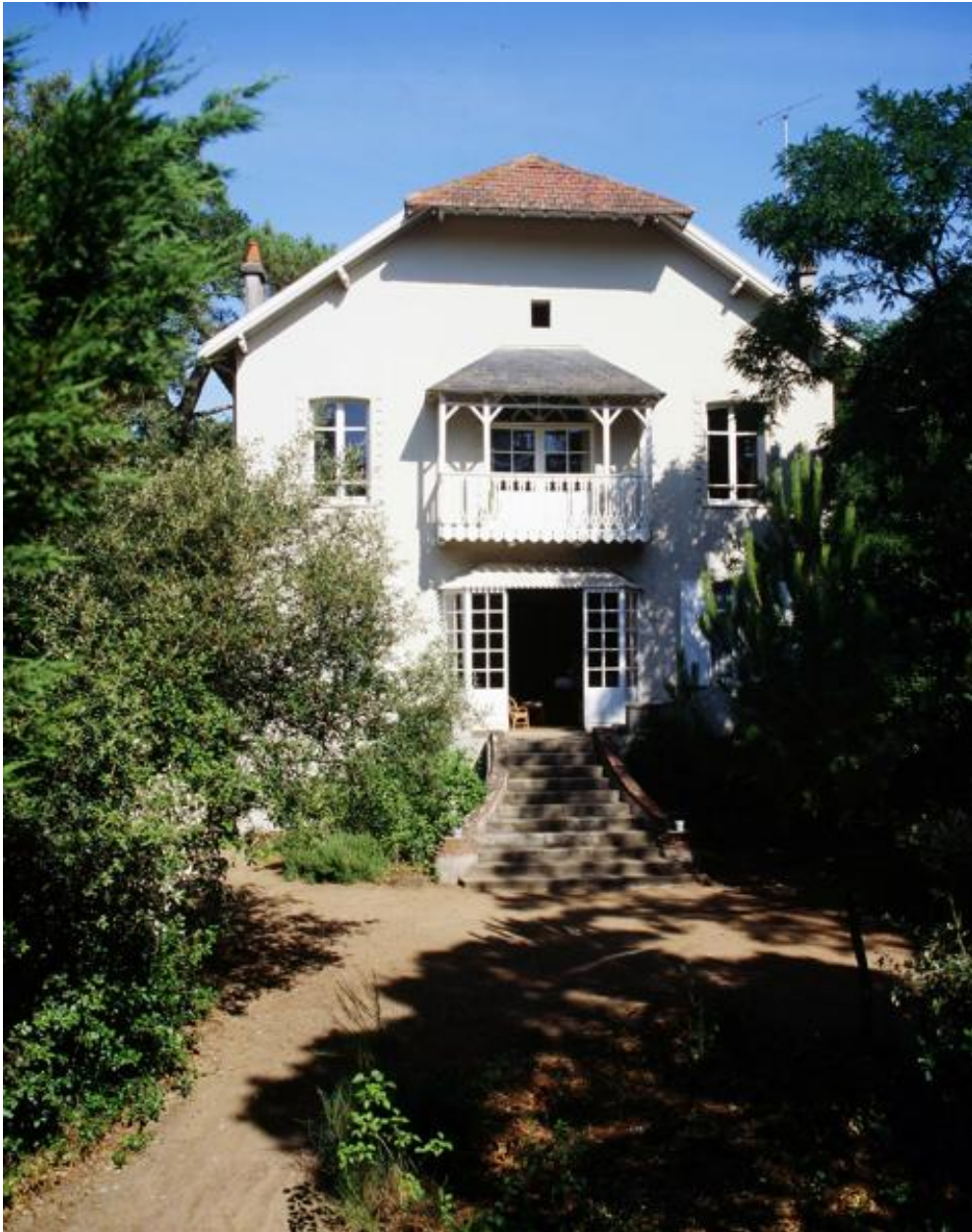
Villa les Elfes, élévation antérieure.