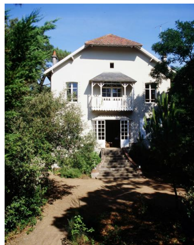
Villa les Elfes, élévation antérieure. IVR52_19954400680XA