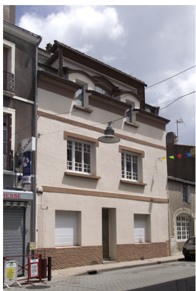
La façade sur la rue.