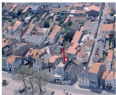
Situation sur la vue aérienne, 1998. IVR52_19984404592NUDA