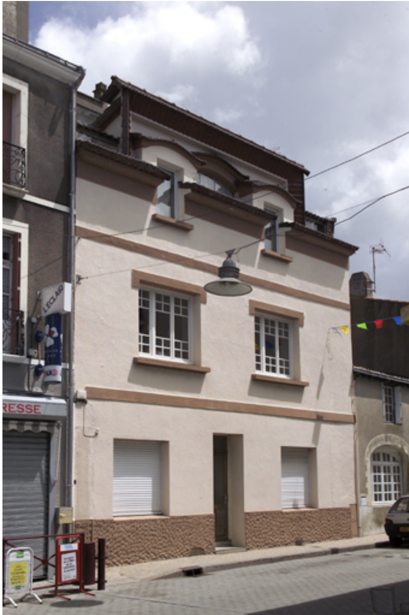
La façade sur la rue.