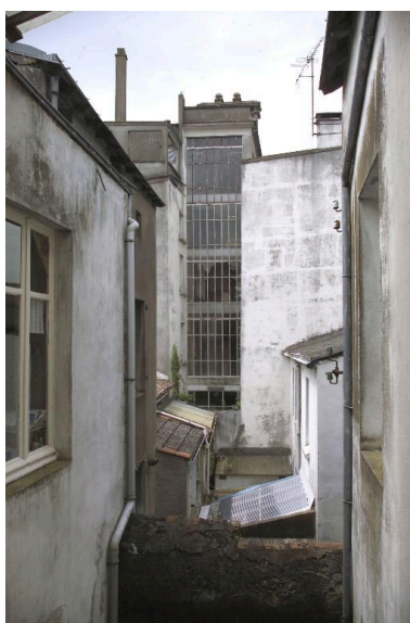
L'escalier, vue prise de la maison n° 46.