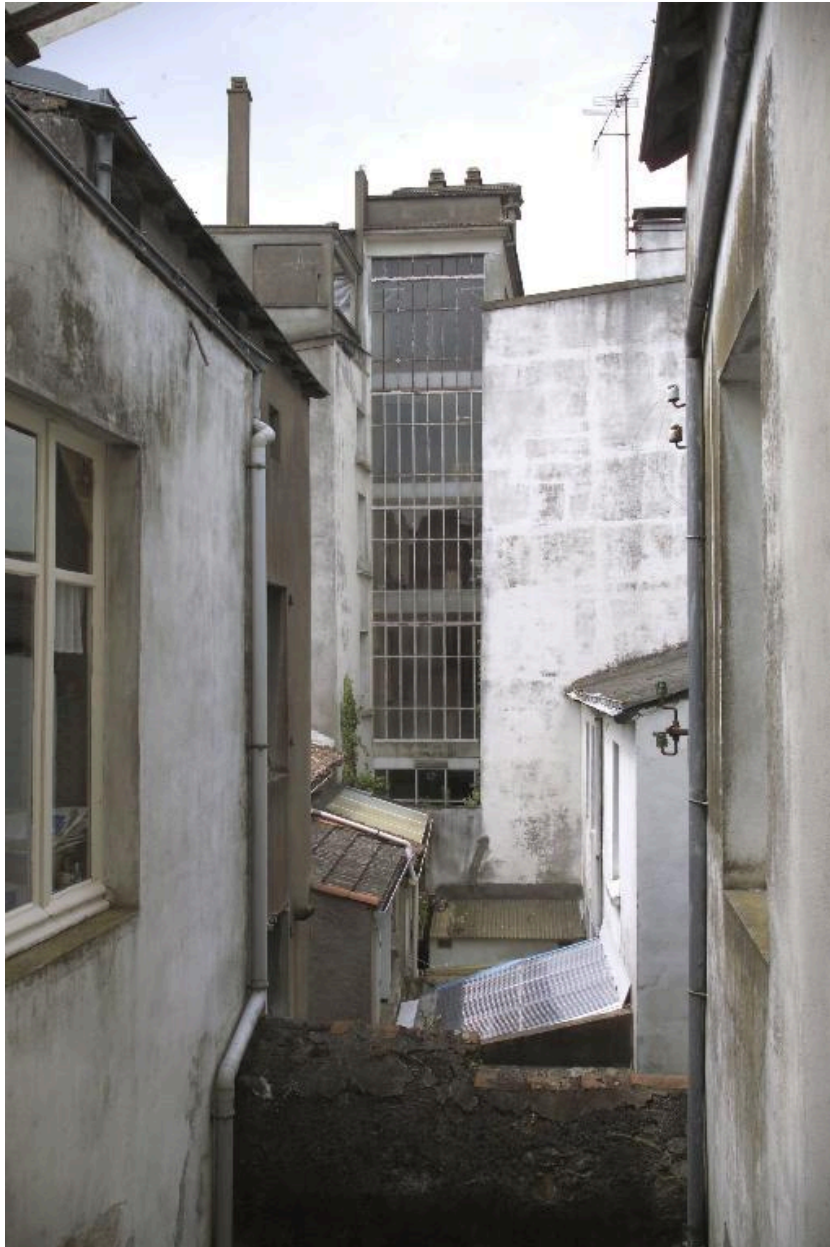
L'escalier, vue prise de la maison n° 46.