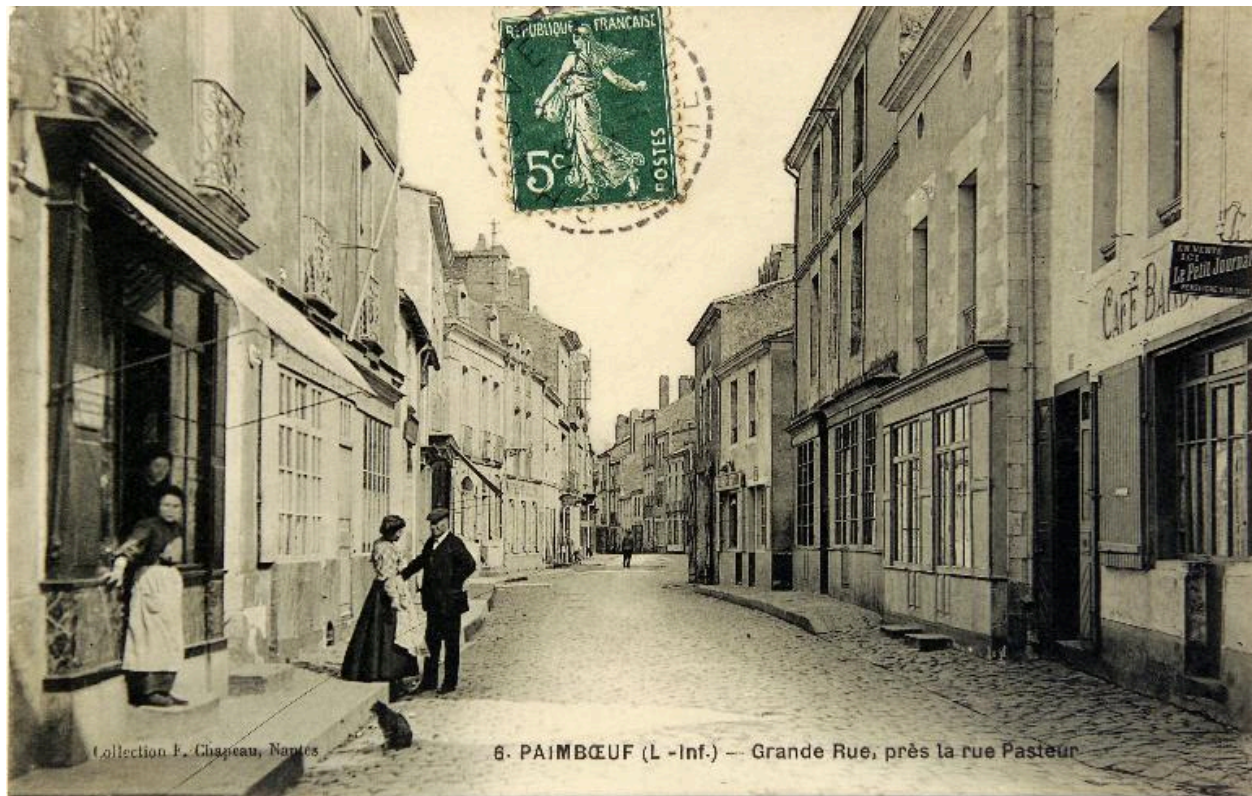
La rue du Général-De-Gaulle au début du XXe siècle à partir de la rue Pasteur, à gauche les n° 56, 54, 52, 50.