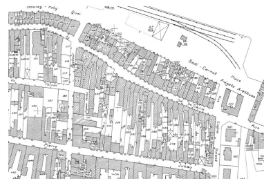
Plan cadastral, 1999, extrait.