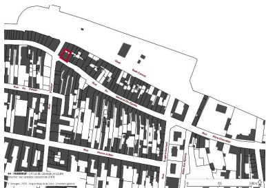
Situation sur données cadastrales 2008. IVR52_20094400468NUDA