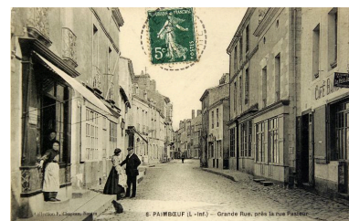
La rue du Général-De-Gaulle au début du XXe siècle à partir de la rue Pasteur, à gauche les n° 56, 54, 52, 50.