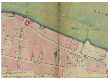
Situation sur cadastre 1810. IVR52_20094400467NUDA