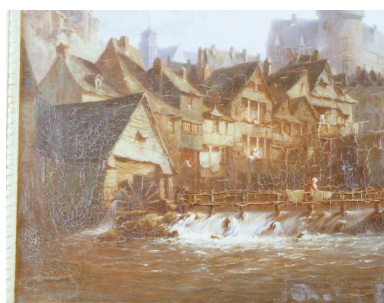
Vue des moulins et du barrage de Bélaillé depuis le sud-est. IVR52_19905300010XA