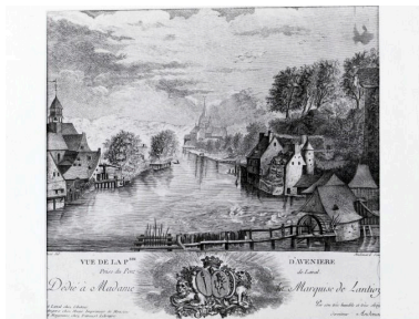
Vue des moulins et du barrage de Belaillé depuis le nord.