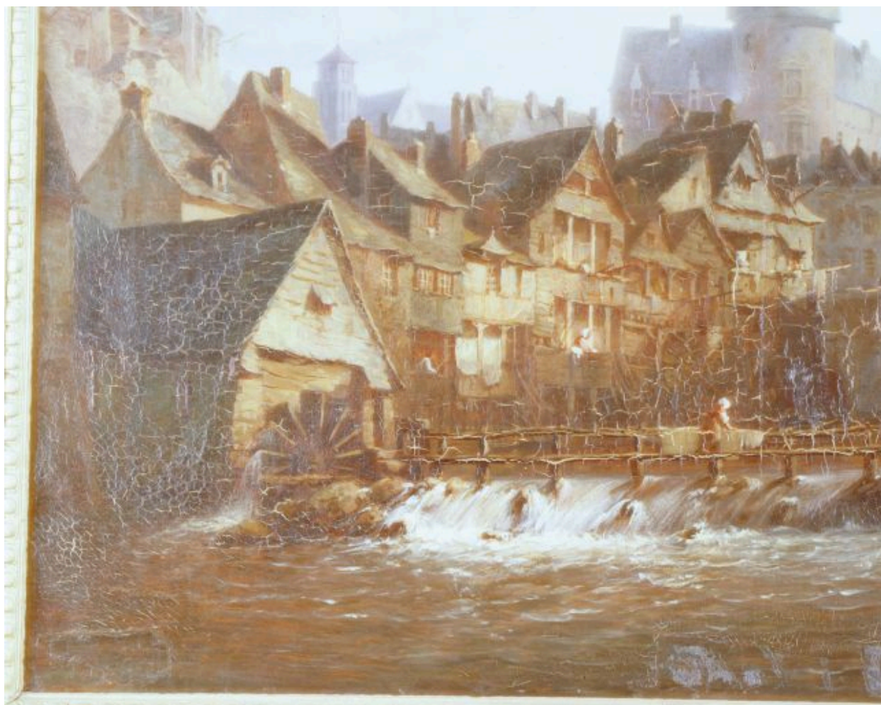
Vue des moulins et du barrage de Bélaillé depuis le sud-est.