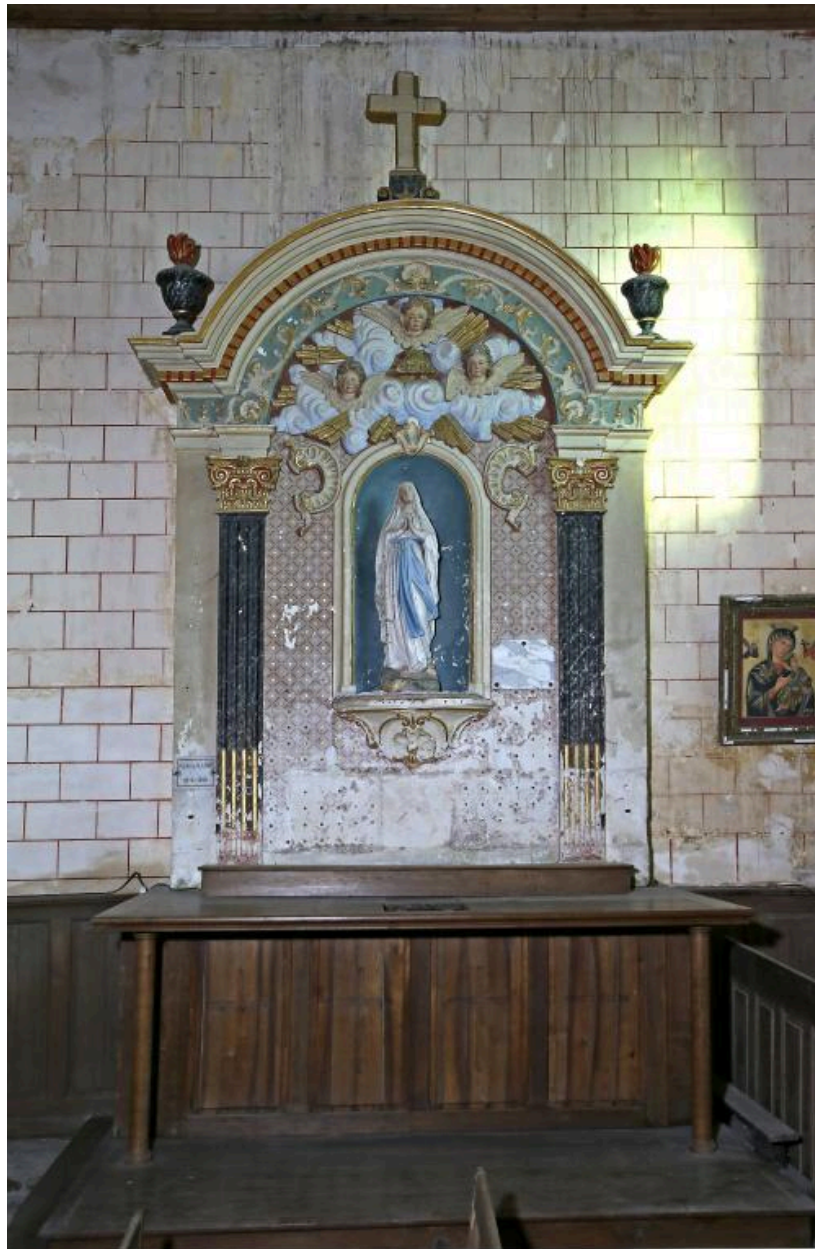
Retable latéral sud.