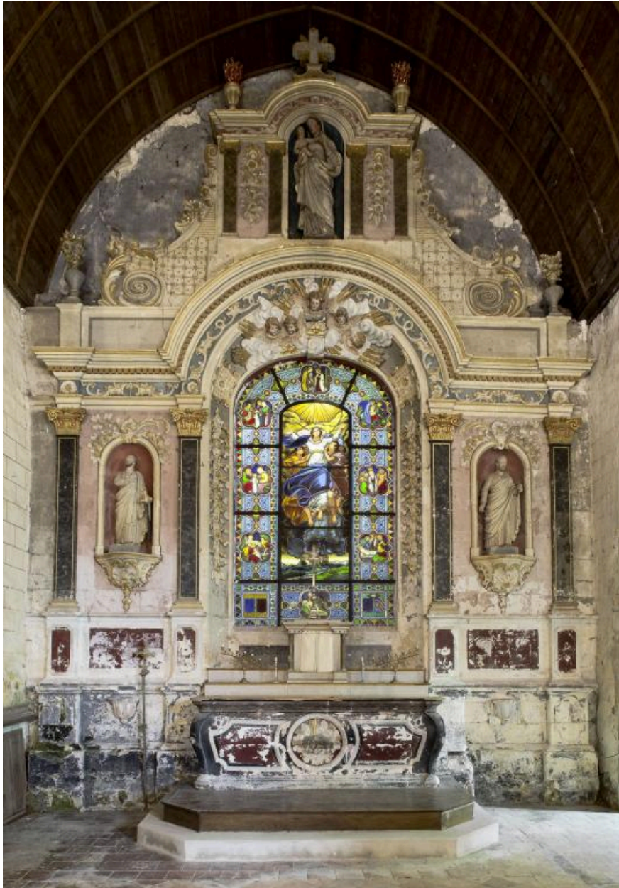
Retable du maître-autel.