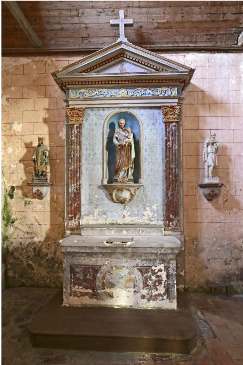
Retable latéral nord.