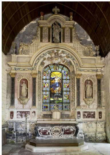
Retable du maître-autel.