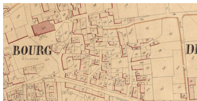
La cour commune, parcelle 726, au centre sur le plan cadastral de 1836.