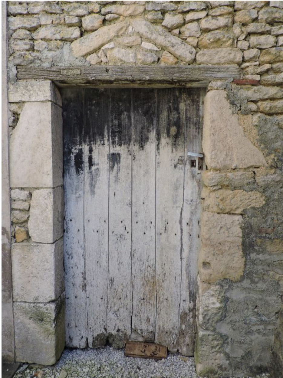
Porte d'une des dépendances au sud de la cour.