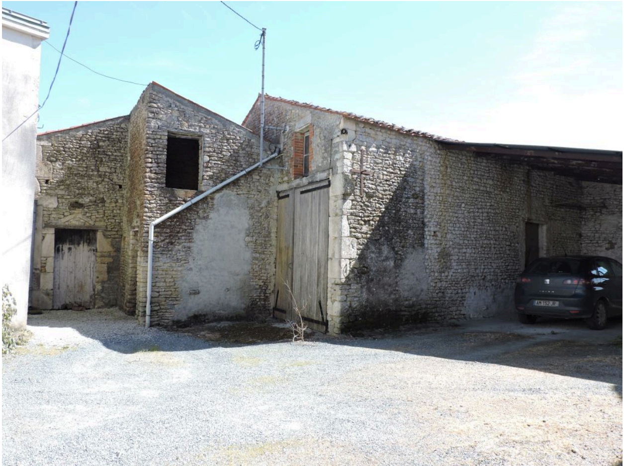
Les dépendances au sud de la cour, vues depuis le nord-ouest.