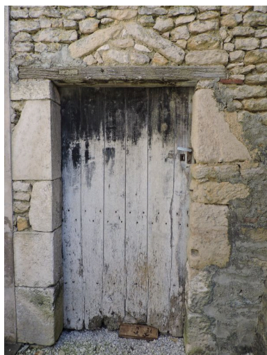
Porte d'une des dépendances au sud de la cour.