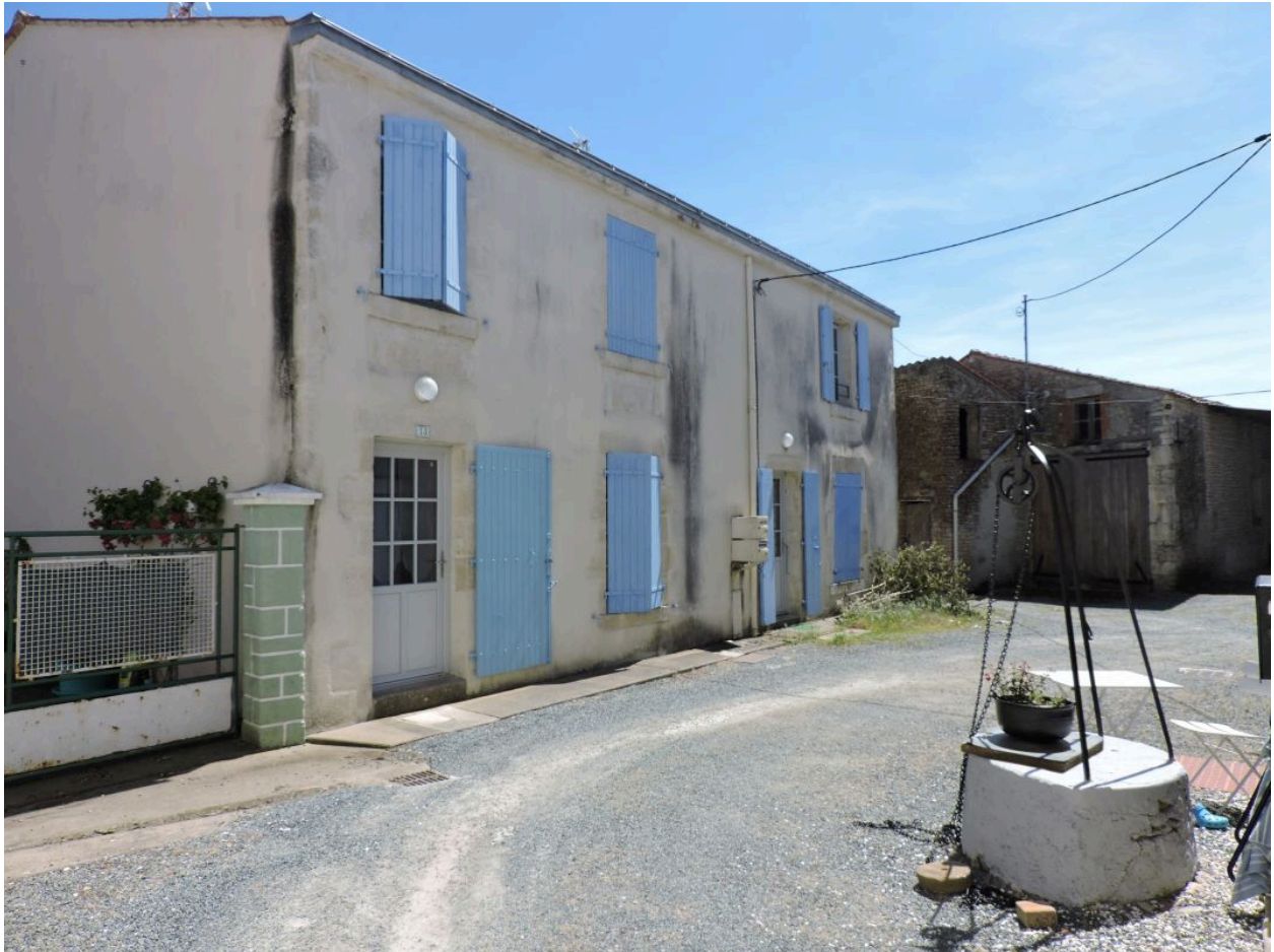
La cour commune vue depuis le nord.