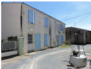
La cour commune vue depuis le nord.