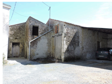
Les dépendances au sud de la cour, vues depuis le nord-ouest.