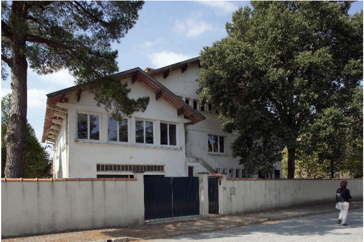
Maison boulevard Dumesnidot (n° 19).