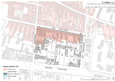
Superposition des deux cadastres, 1810 et 1999.