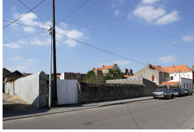
La façade Est de l'îlot depuis la rue Florent-Gariou (moitié nord).