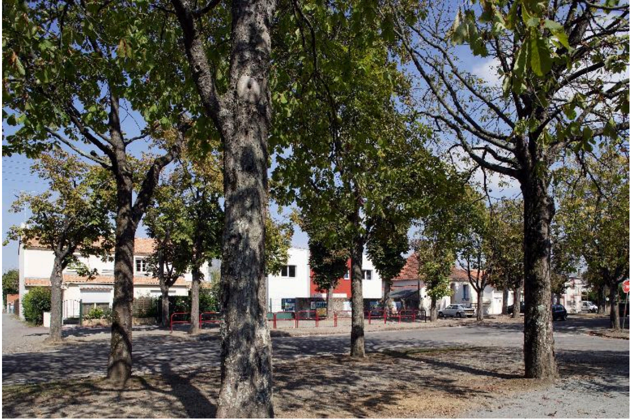
Le boulevard Dumesnidot du n° 22 au n° 16