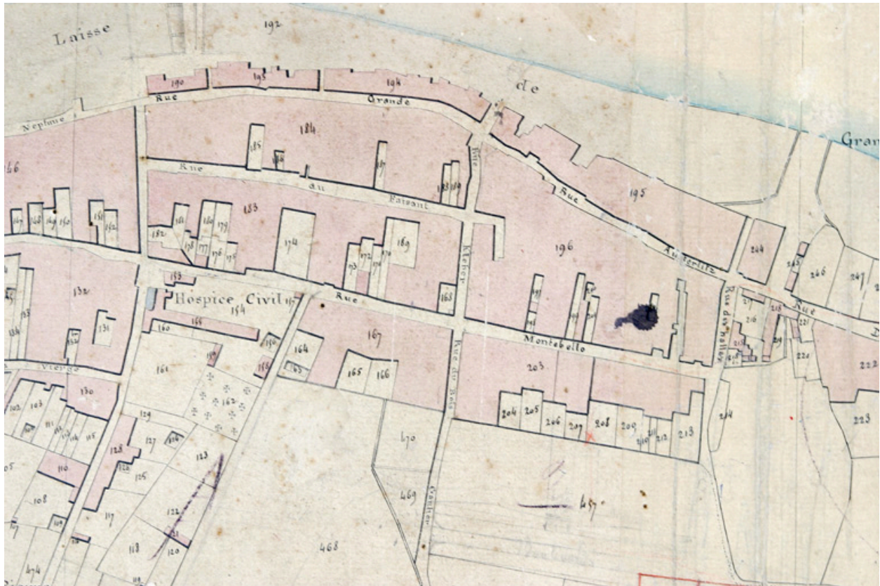
Plan cadastral, 1810, extrait (n° 203).