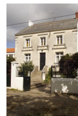
Maison boulevard Dumesnildot (n° 30).

. De l'autre côté du boulevard, la référence architecturale affichée est celle de la maison de villégiature ; un train à voie étroite reliait la gare de Paimbœuf à Saint-Brevin à la charnière du XIXe et du XXe siècle.