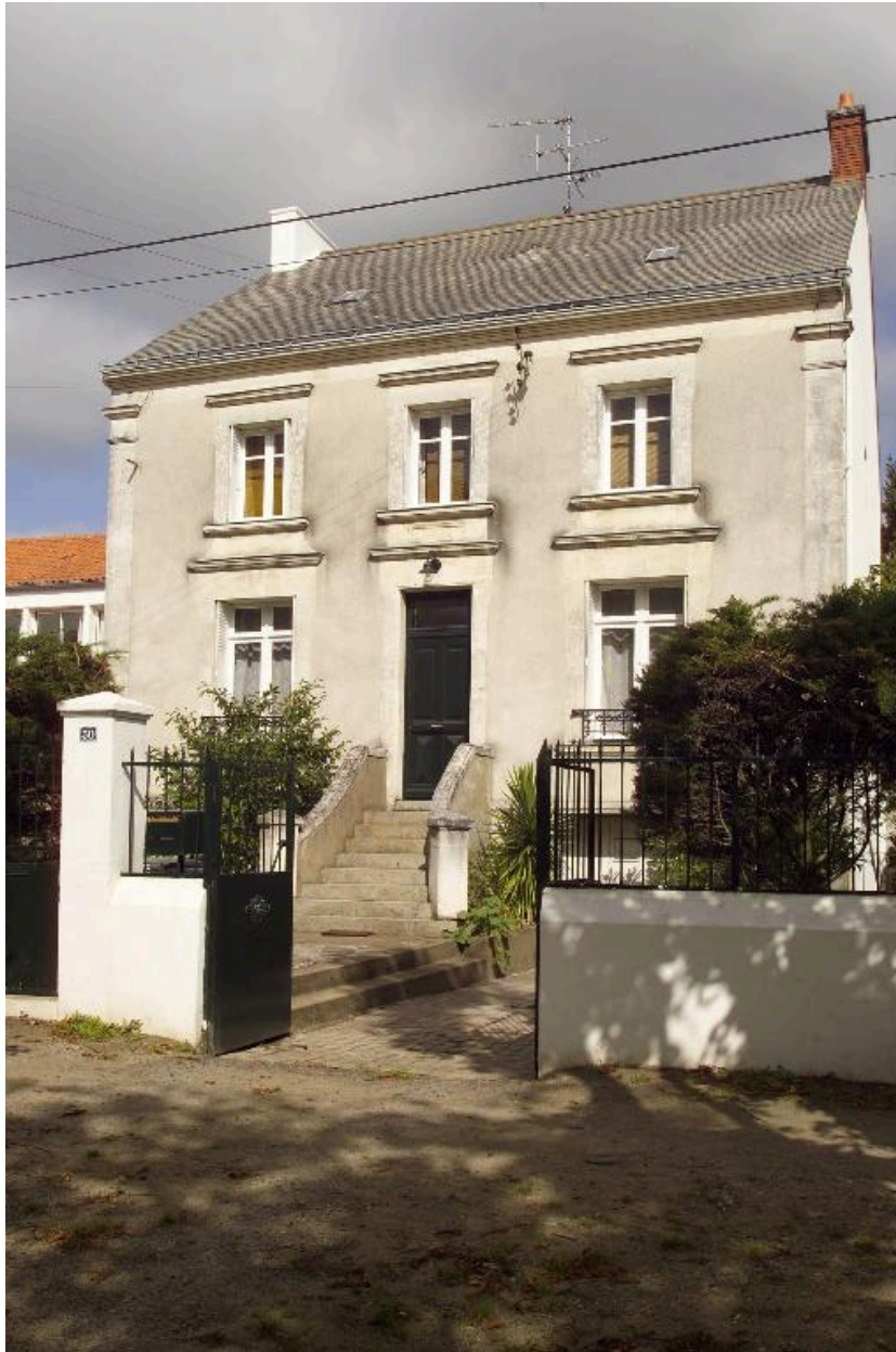
Maison boulevard Dumesnidot (n° 30).