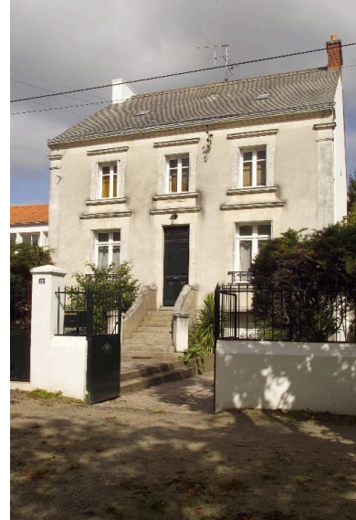
Maison boulevard Dumesnidot (n° 30).