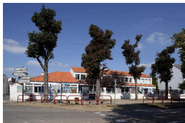
L'école maternelle Jacques Prévert vue depuis le boulevard.