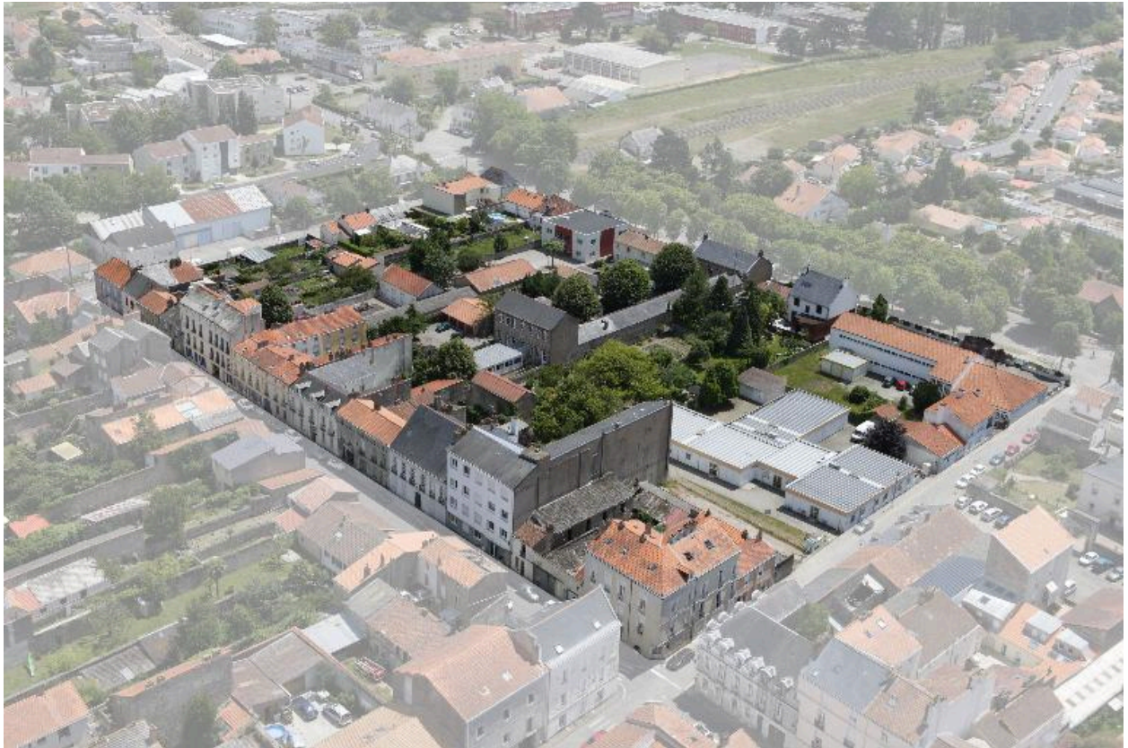
Vue aérienne de l'îlot, 2010.