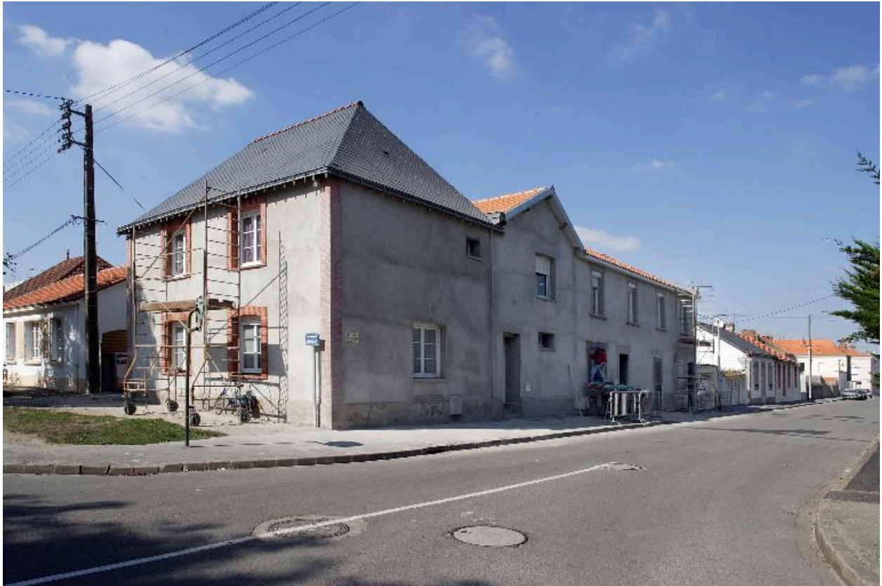
La façade Est de l'îlot depuis la rue Florent-Gariou, à l'angle, l'ancien hôtel de la gare.