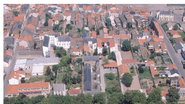
Vue aérienne, 1998, au premier plan, l'îlot 11.