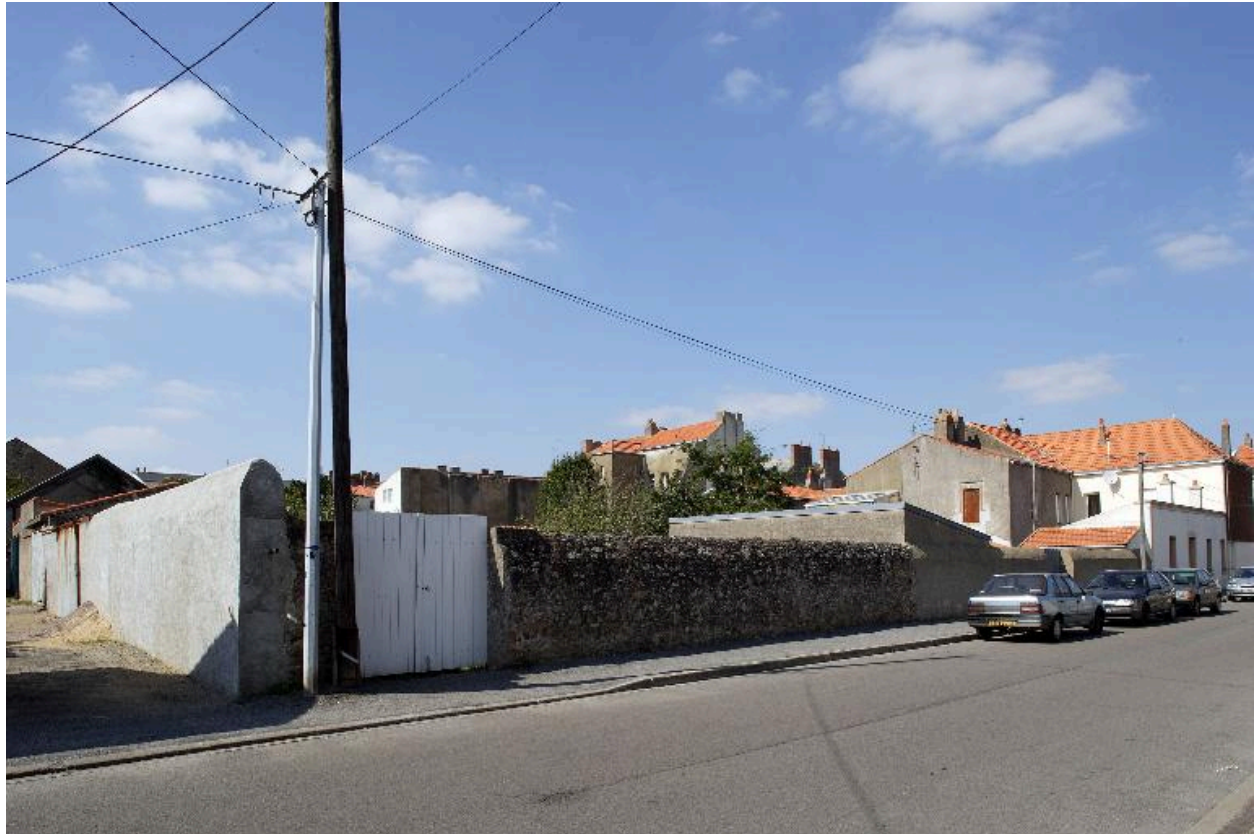
La façade Est de l'îlot depuis la rue Florent-Gariou (moitié nord).