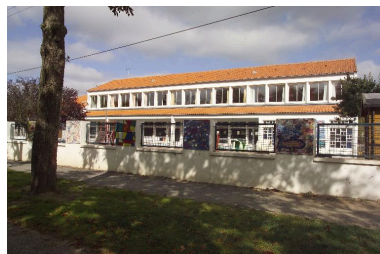
L'école maternelle Jacques Prévert.