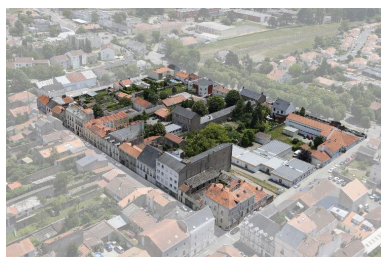
Vue aérienne de l'îlot, 2010. IVR52_20104402755NUCA