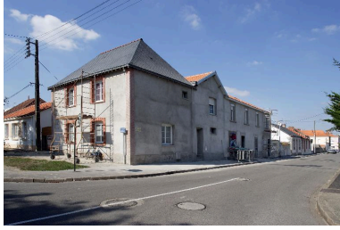
La façade Est de l'îlot depuis la rue Florent-Gariou, à l'angle, l'ancien hôtel de la gare.