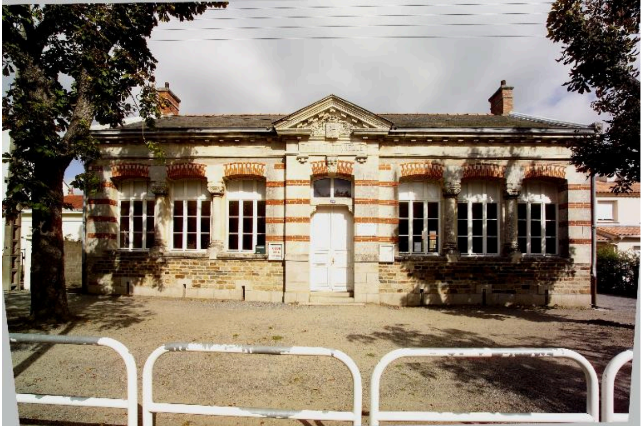
L'école maternelle et primaire Georges Brassens.