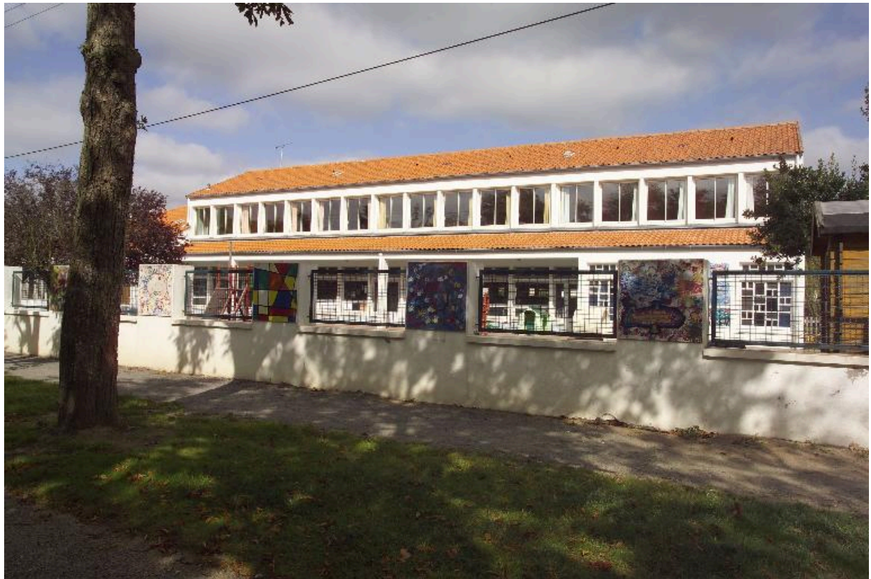
L'école maternelle Jacques Prévert.