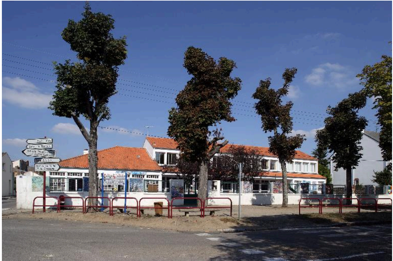
L'école maternelle Jacques Prévert vue depuis le boulevard.