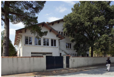
Maison boulevard Dumesnidot (n° 19).