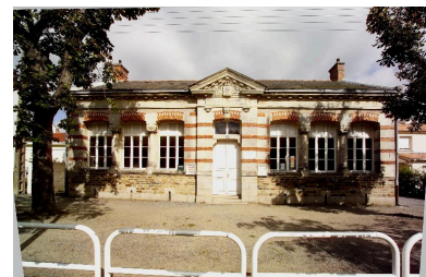
L'école maternelle et primaire Georges Brassens.