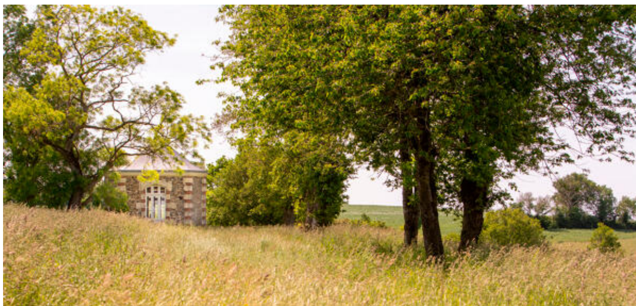
Le pavillon de Corbray.