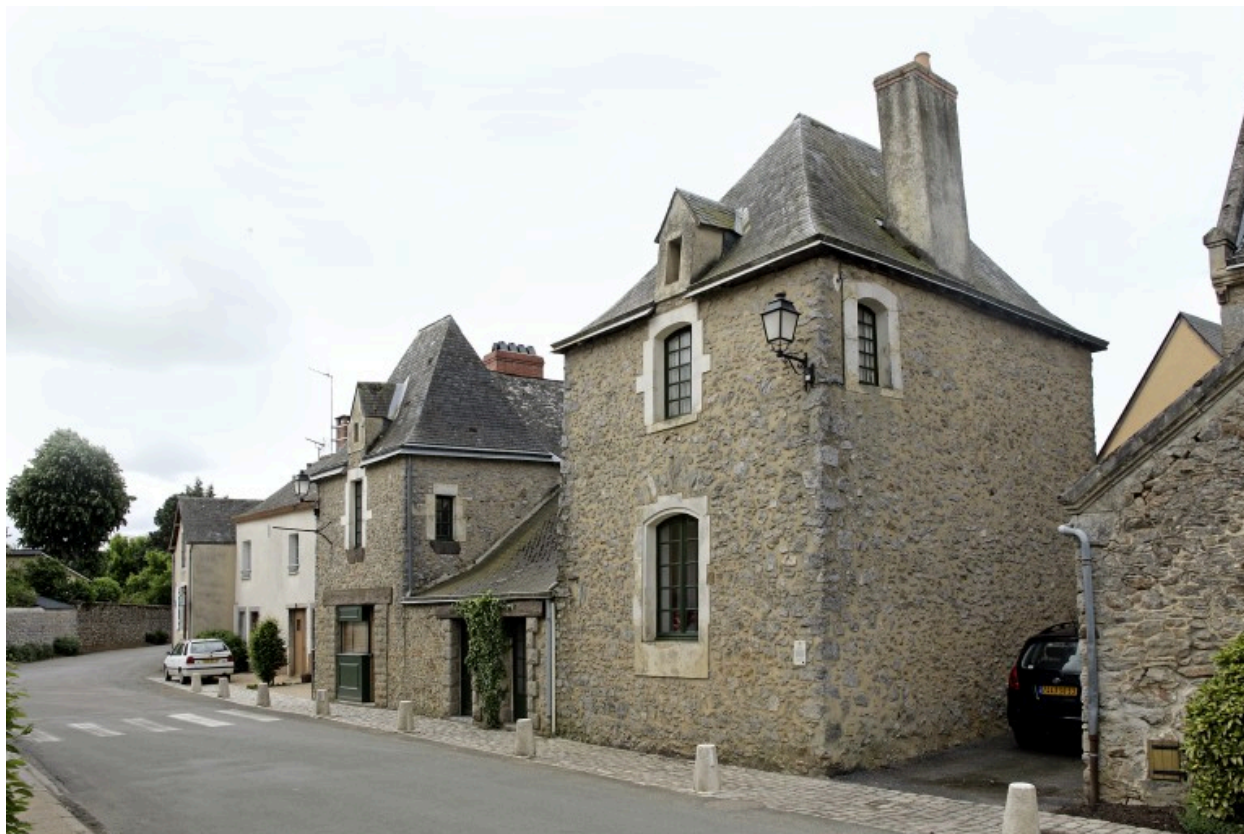
La maison du 14 rue des Deux-Eglises.