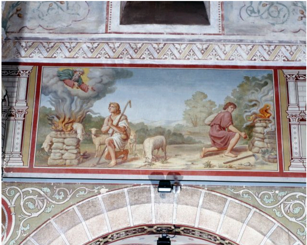
Nef, deuxième travée, mur nord. L'offrande de Caïn et Abel.