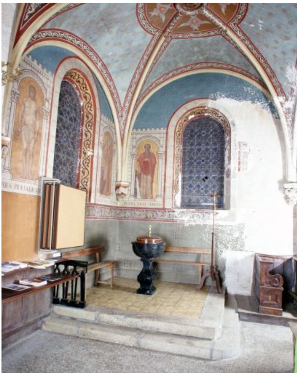
Nef, bas-côté nord. Le décor peint des fonts baptismaux.