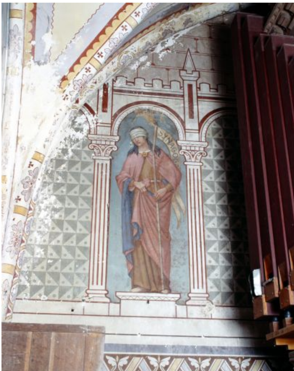
Nef, mur ouest, partie sud. Figuration de la Synagogue.