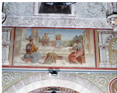
Nef, quatrième travée, mur sud. Le repas d'Emmaüs. IVR52_20005300065XA

IVR52_20005300069XA