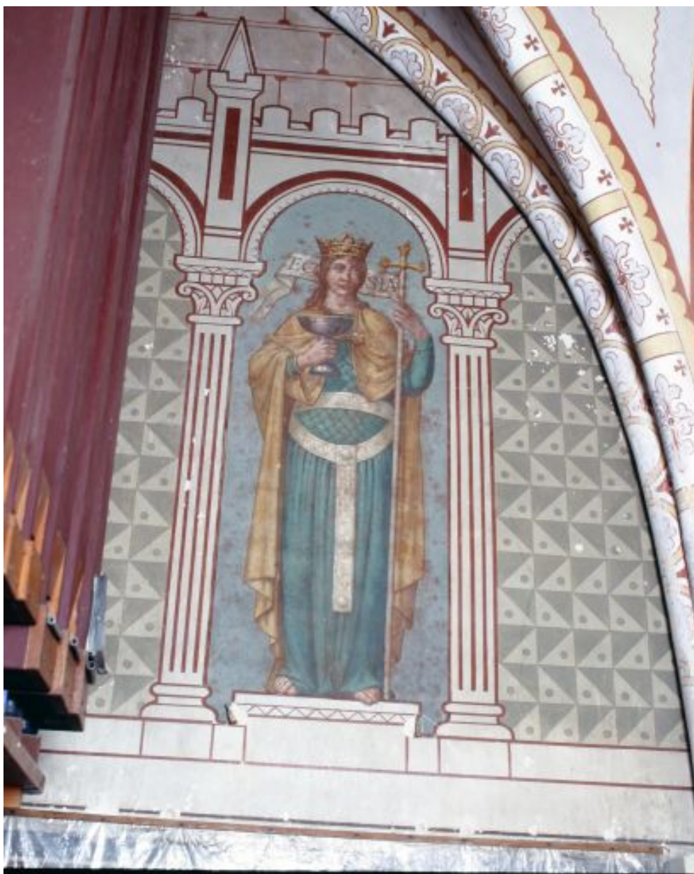
Nef, mur ouest, partie nord. Figuration de l'Eglise.