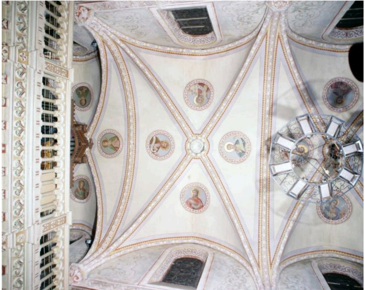
Nef, première et deuxième travées, voûte. Trois femmes de l'Ancien Testament et quatre petits prophètes.