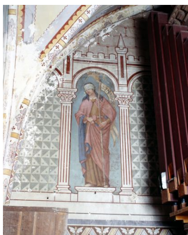
Nef, mur ouest, partie sud. Figuration de la Synagogue.