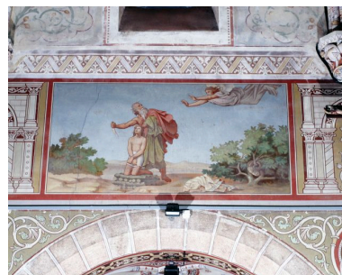
Nef, quatrième travée, mur nord.