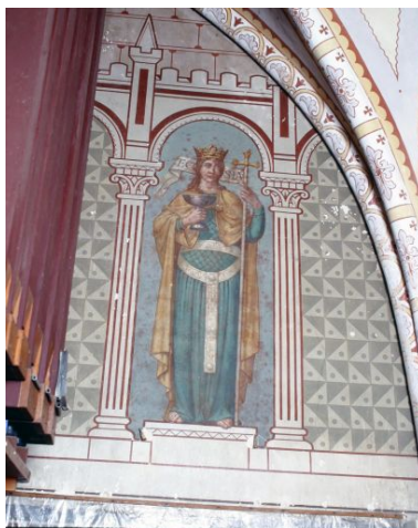
Nef, mur ouest, partie nord. Figuration de l'Eglise. IVR52_20005300085XA