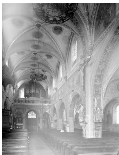
Vue d'ensemble vers le nord-ouest.