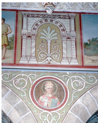
Nef, mur nord, troisième pile. Motif ornemental et représentation de saint Augustin, peut-être sous les traits de Monseigneur Le hardy du Marais, alors évêque de Laval.

IVR52_20005300069XA