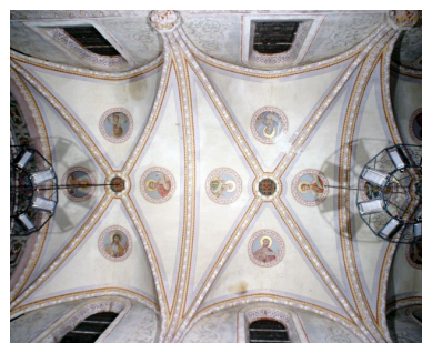
Nef, troisième et quatrième travées, voûte. Huit petits prophètes.