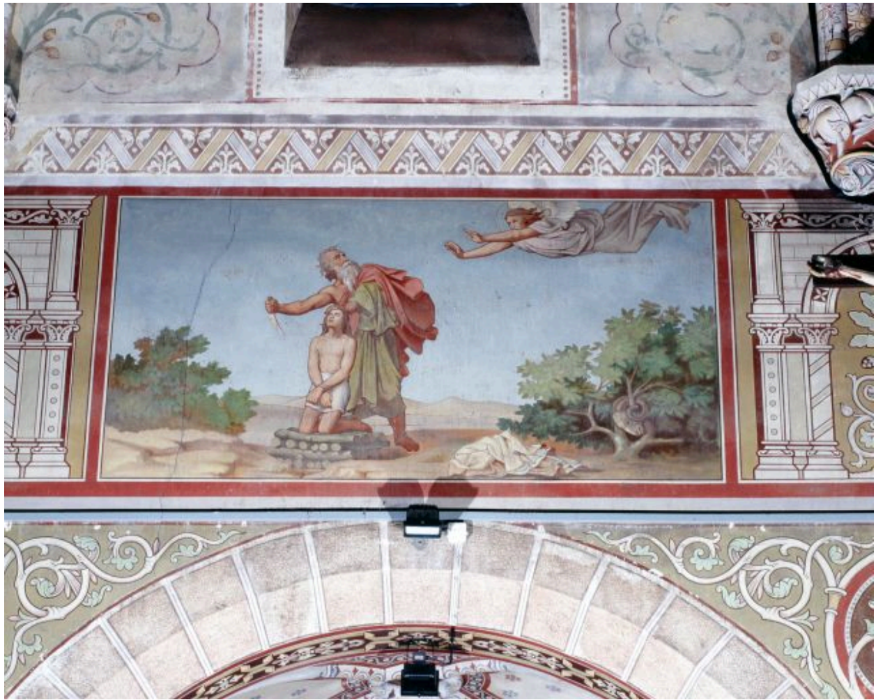
Nef, quatrième travée, mur nord. Le sacrifice d'Isaac.