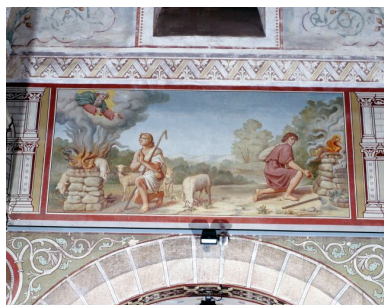
Nef, deuxième travée, mur nord.