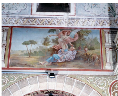
Nef, deuxième travée, mur sud. Le songe de Jacob. IVR52_20005300075XA