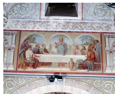
Nef, troisième travée, mur sud. la Cène.