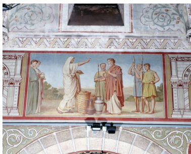
Nef, troisième travée, mur nord.