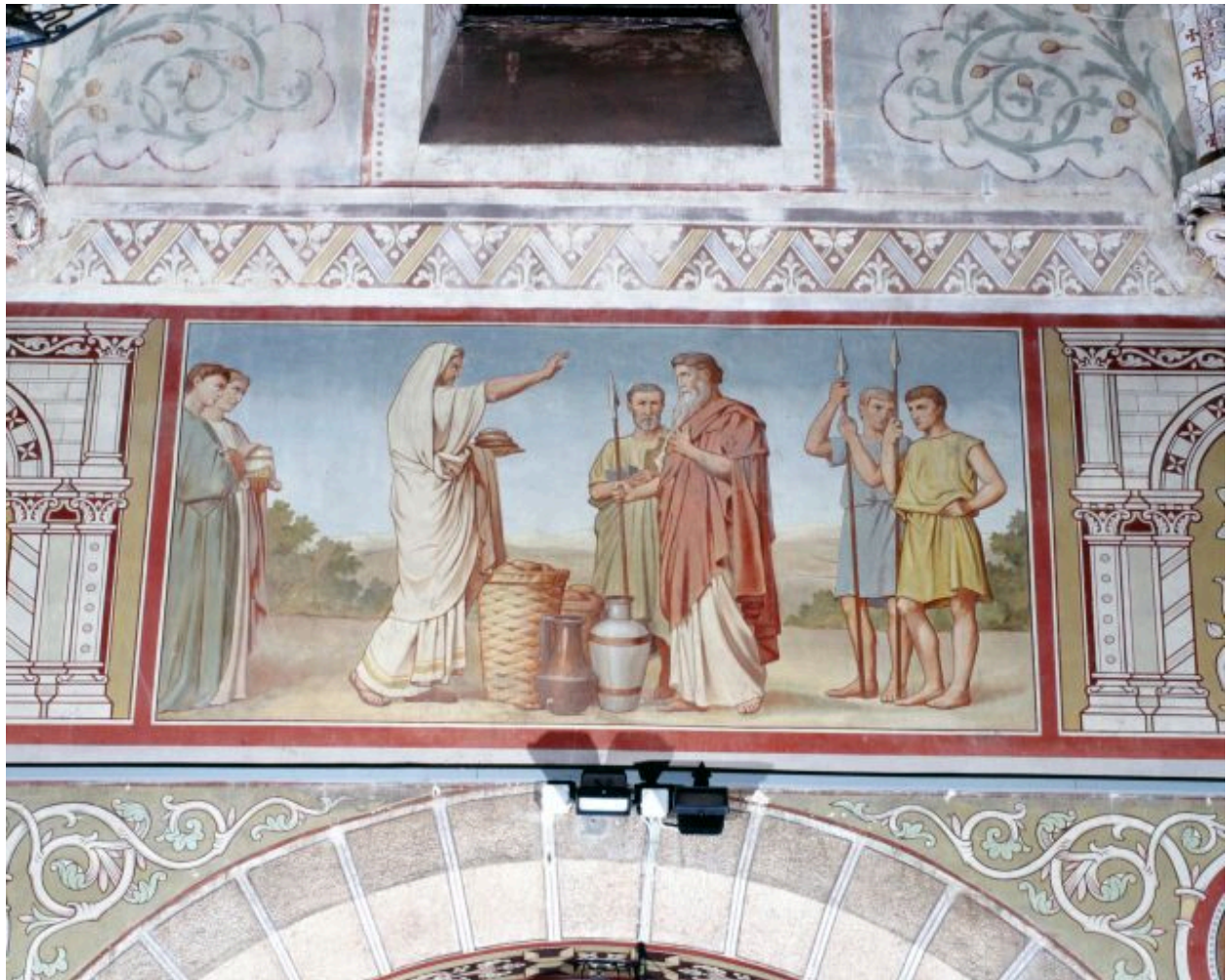
Nef, troisième travée, mur nord. Abraham et Melchisédech.