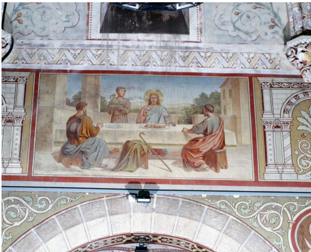
Nef, quatrième travée, mur sud. Le repas d'Emmaüs.