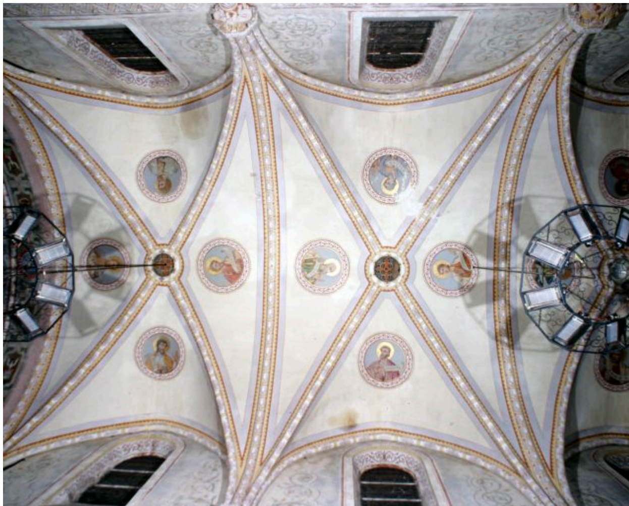
Nef, troisième et quatrième travées, voûte. Huit petits prophètes.