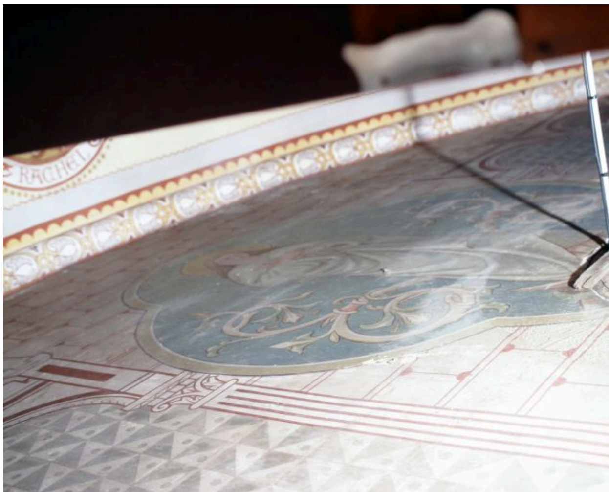
Nef, mur ouest, partie centrale. La Vierge, actuellement cachée par l'orgue.