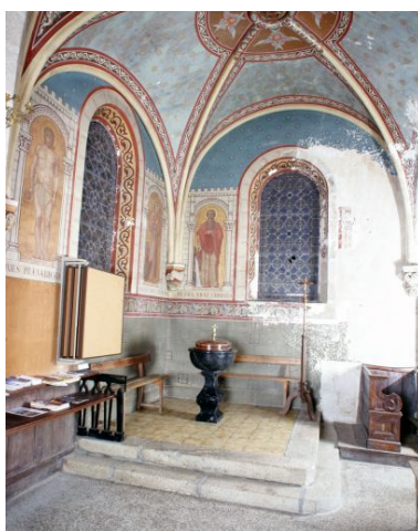
Nef, bas-côté nord. Le décor peint des fonts baptismaux.