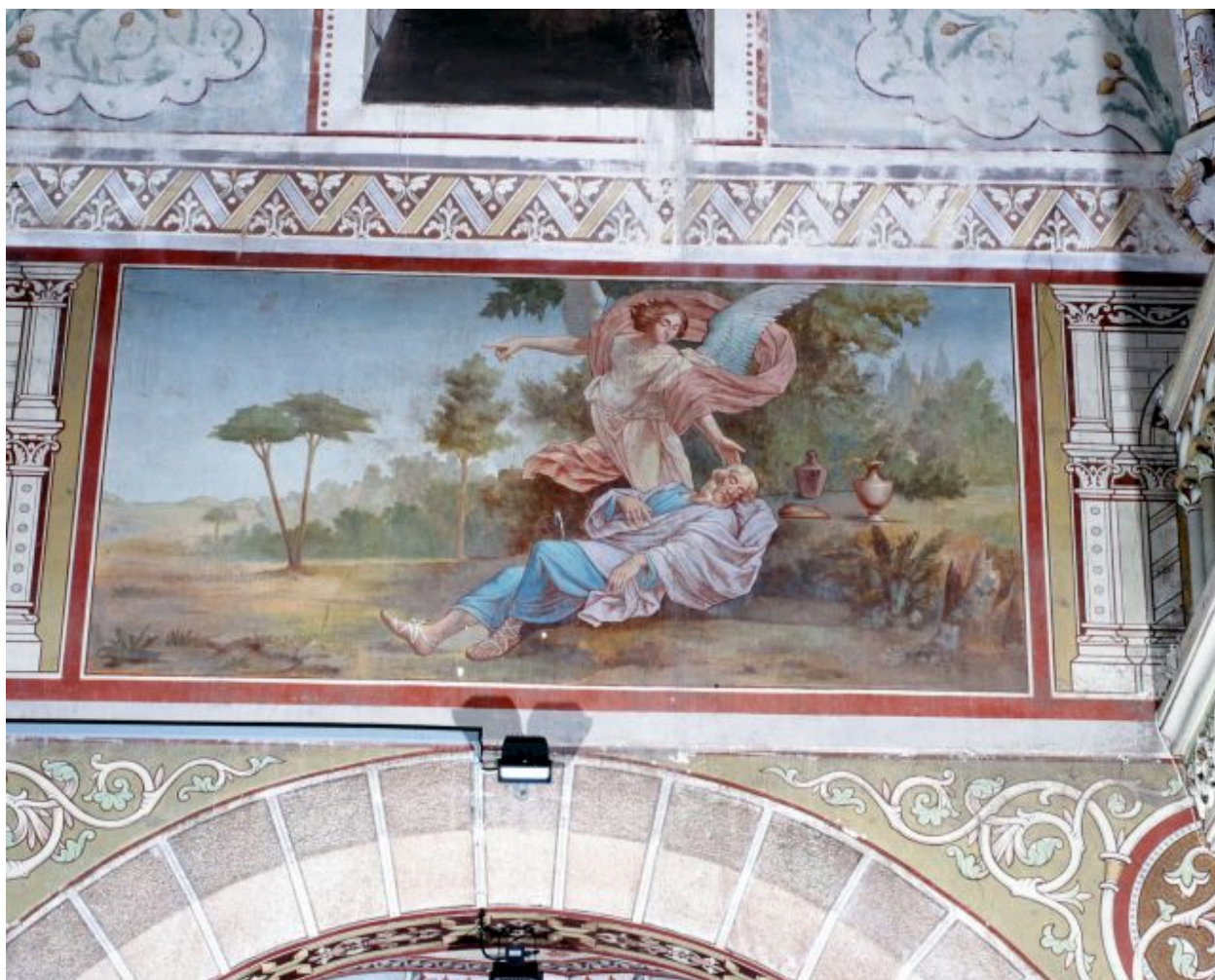
Nef, deuxième travée, mur sud. Le songe de Jacob.