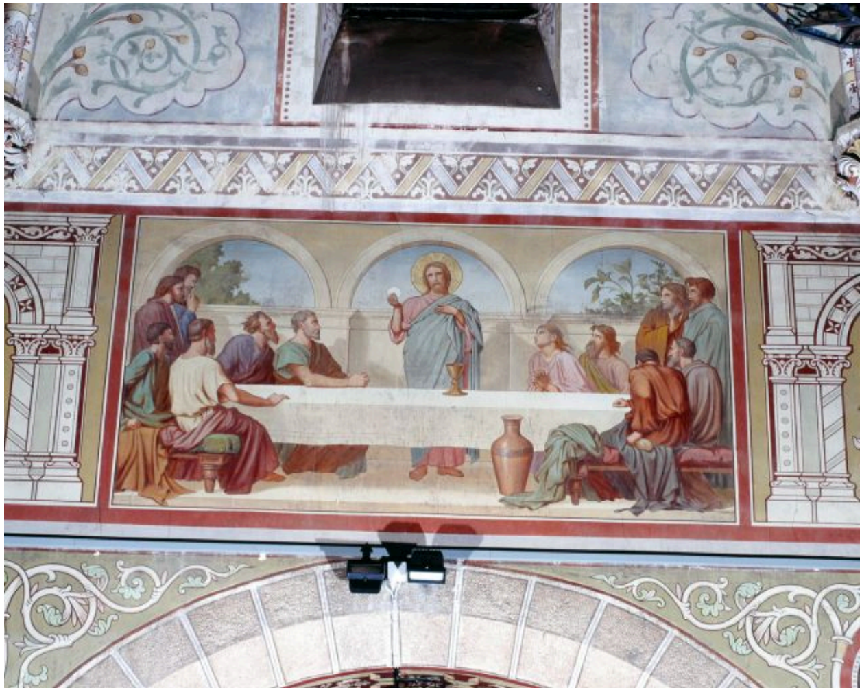
Nef, troisième travée, mur sud. la Cène.