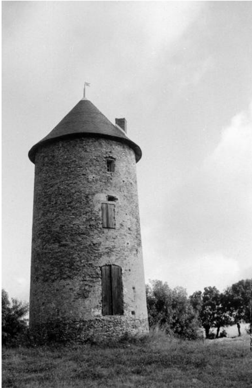
Vue d'ensemble depuis le sud prise en 1972.