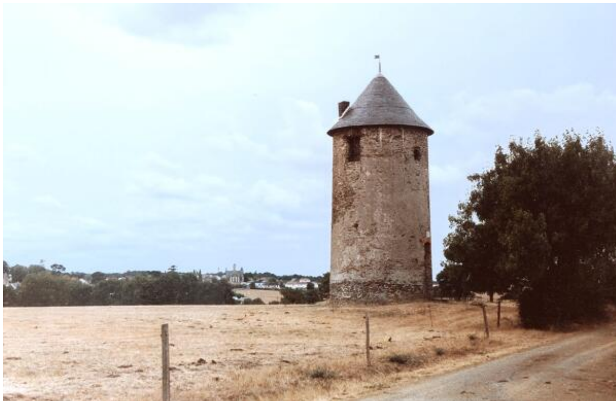
Le moulin Pinot ou Pineau (n° 3). Vue d'ensemble depuis l'est.