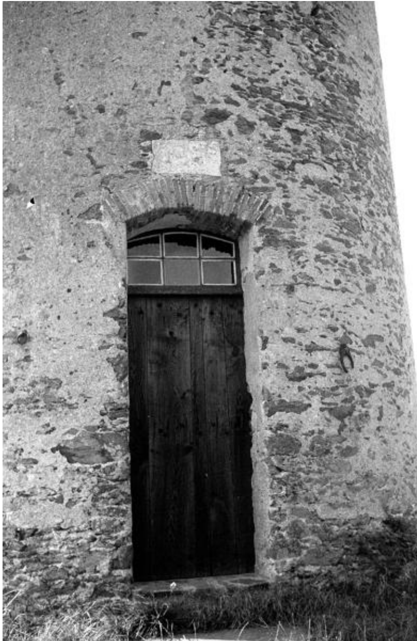
Détail de la porte nord en 1972.