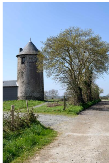
Vue d'ensemble depuis l'est. IVR52_20254900371NUCA