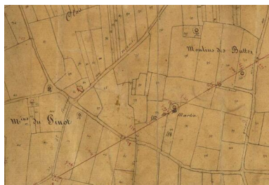
Le moulin Pinot ou Pineau (n° 3). Extrait du plan cadastral de 1827, section C (unique), parcelle n° 449. (AD Maine-et-Loire ; 3 P 4 / 212 / 6). IVR52_20254900081NUCA