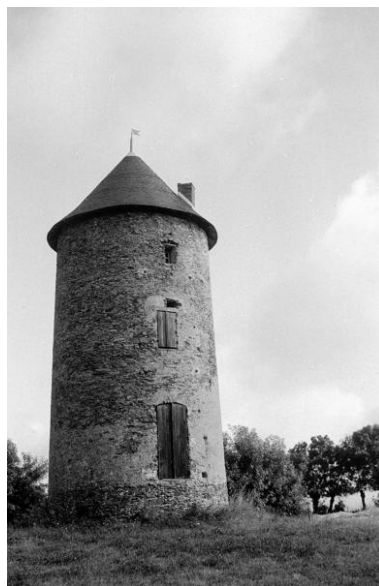
Vue d'ensemble depuis le sud prise en 1972. IVR52_19724900578Z