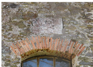
Détail de la date portée 1763.