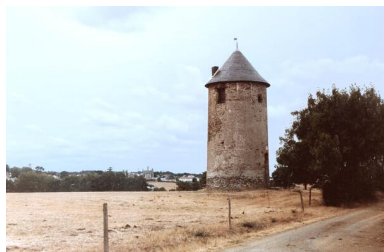
Le moulin Pinot ou Pineau (n° 3). Vue d'ensemble depuis l'est. IVR52_20044900198NUCA