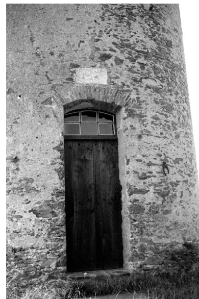
Détail de la porte nord en 1972.