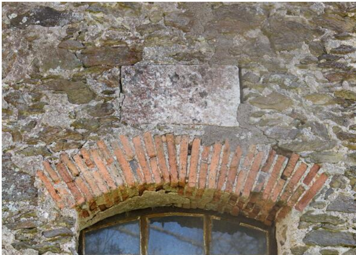
Détail de la date portée 1763.