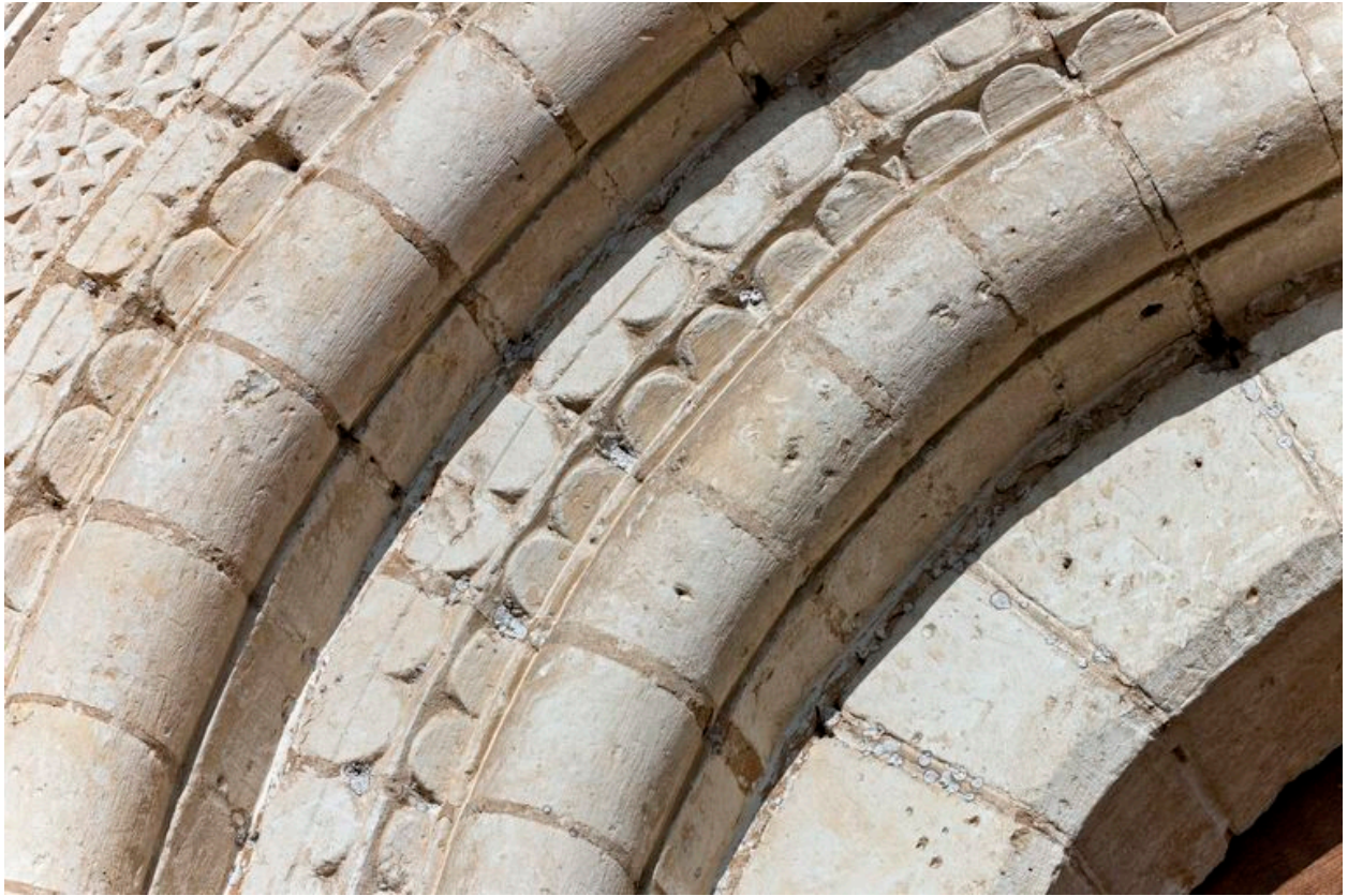
Elevation en bauge du logement