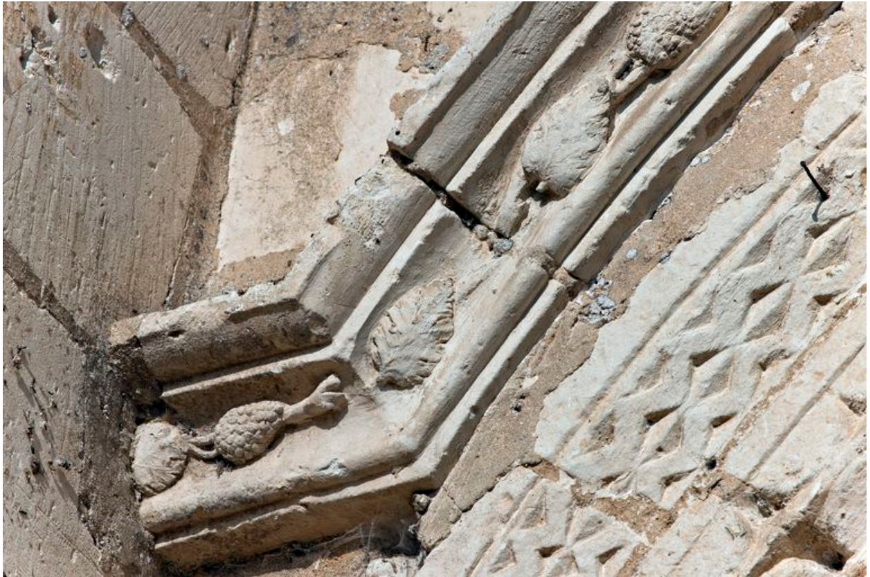
Vue intérieure du logement