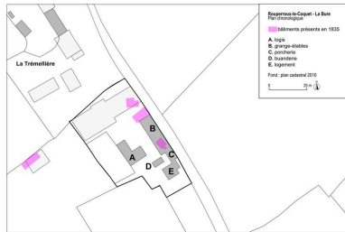
Plan de situation IVR52_20137200013NUDAB