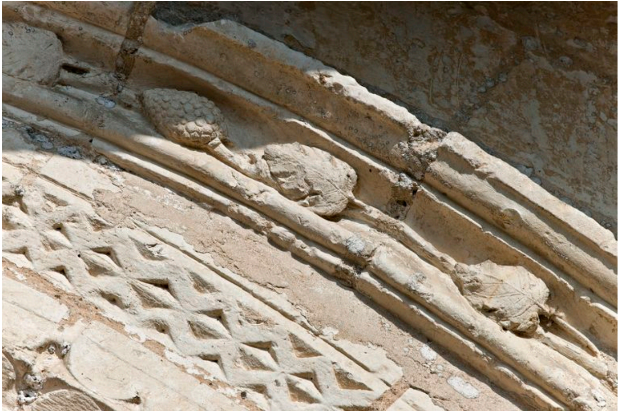
Vue générale du logement