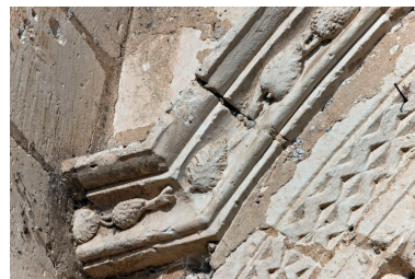
Vue intérieure du logement IVR52_20127200227NUCA