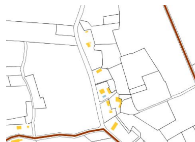
Plan masse en 2008 : extrait. IVR52_20077210306NUCA