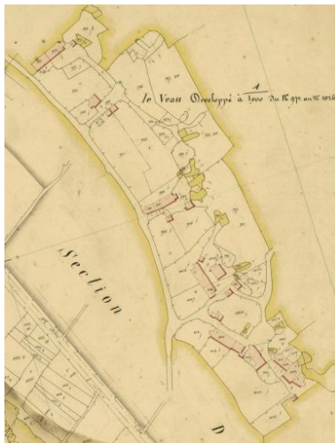
Plan en 1846. IVR52_20047201699NUCA