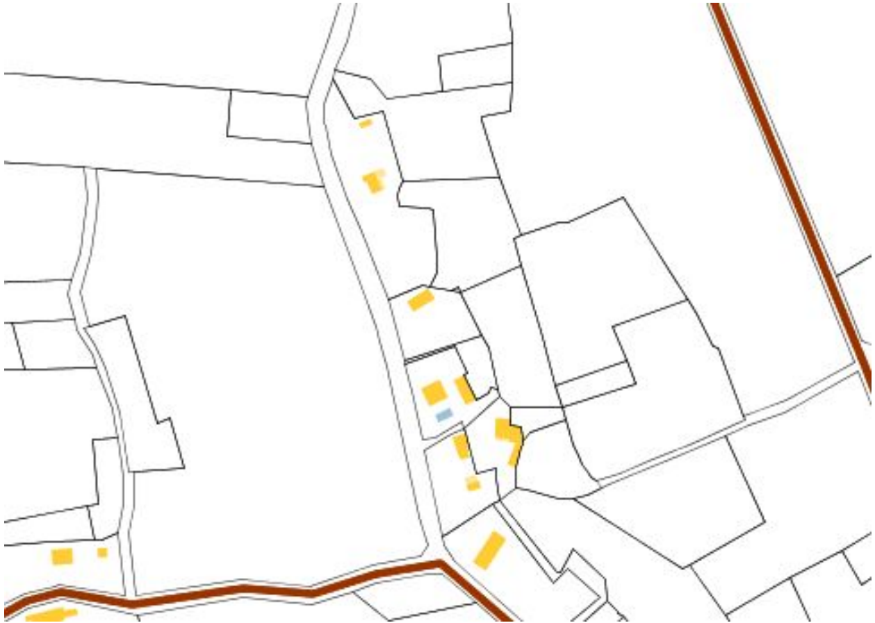
Plan masse en 2008 : extrait.