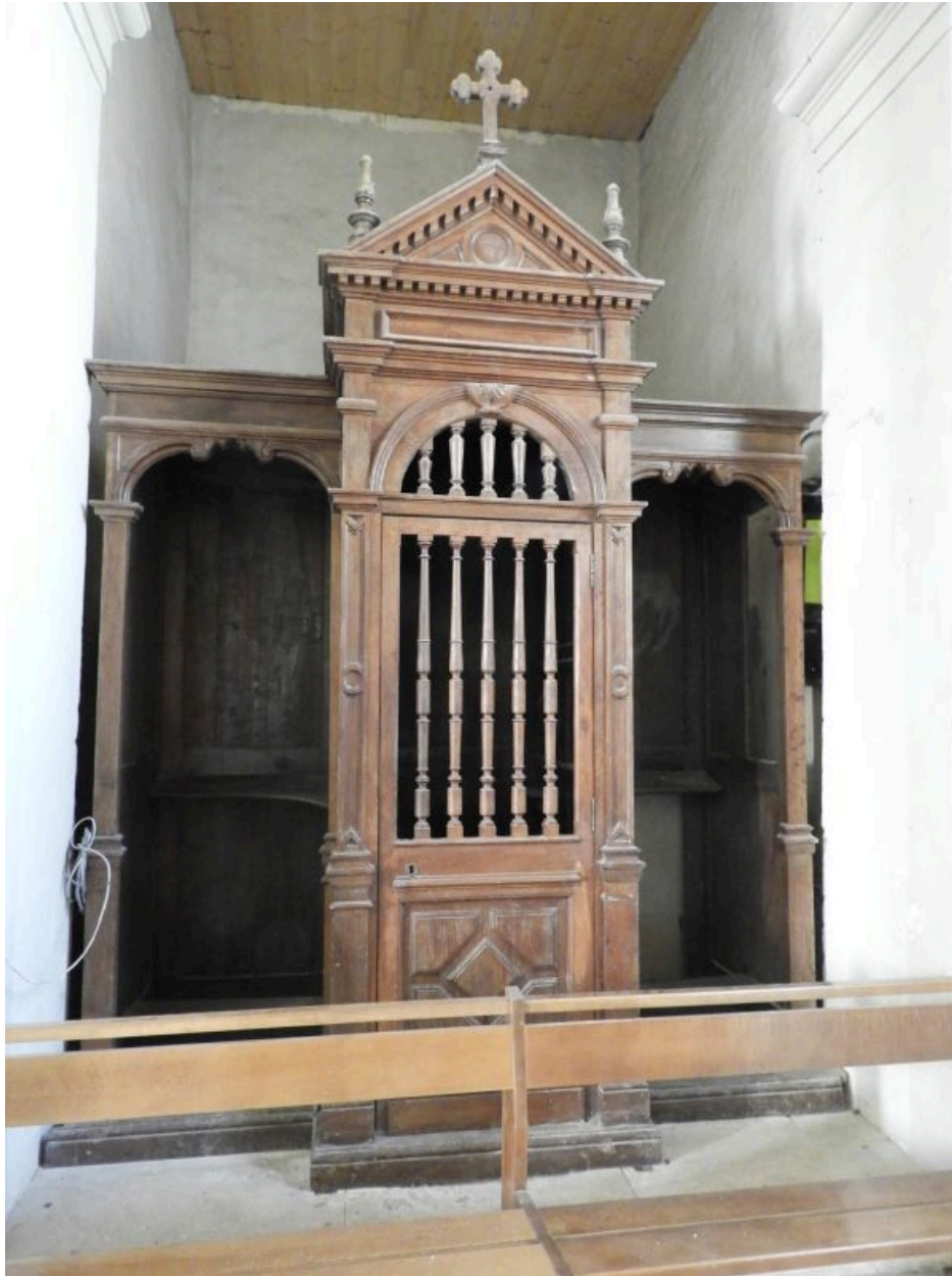
Le confessional du bas-côté nord, vu depuis l'est.