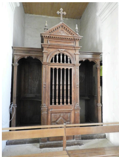
Le confessionnal du bas-côté nord, vu depuis l'est.

Phot. Yannis Suire IVR52_20198500724NUCA