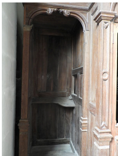
Une des parties latérales.

Phot. Yannis Suire IVR52_20198500723NUCA