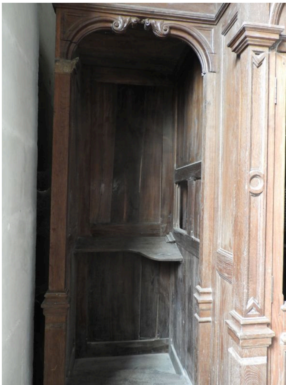
Une des parties latérales.