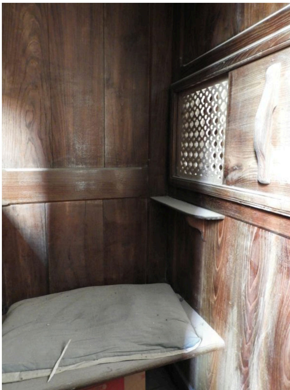
Vue intérieure de la partie centrale.