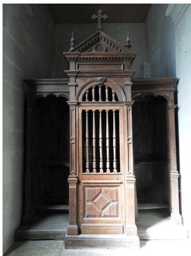
Le confessionnal du bas-côté sud, vu depuis l'est.

IVR52_20198500724NUCA