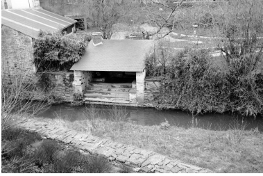
Vue d'ensemble depuis le sud-est.