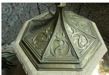
Décor d'entrelacs sur le couvercle. IVR52_20238502065NUCA