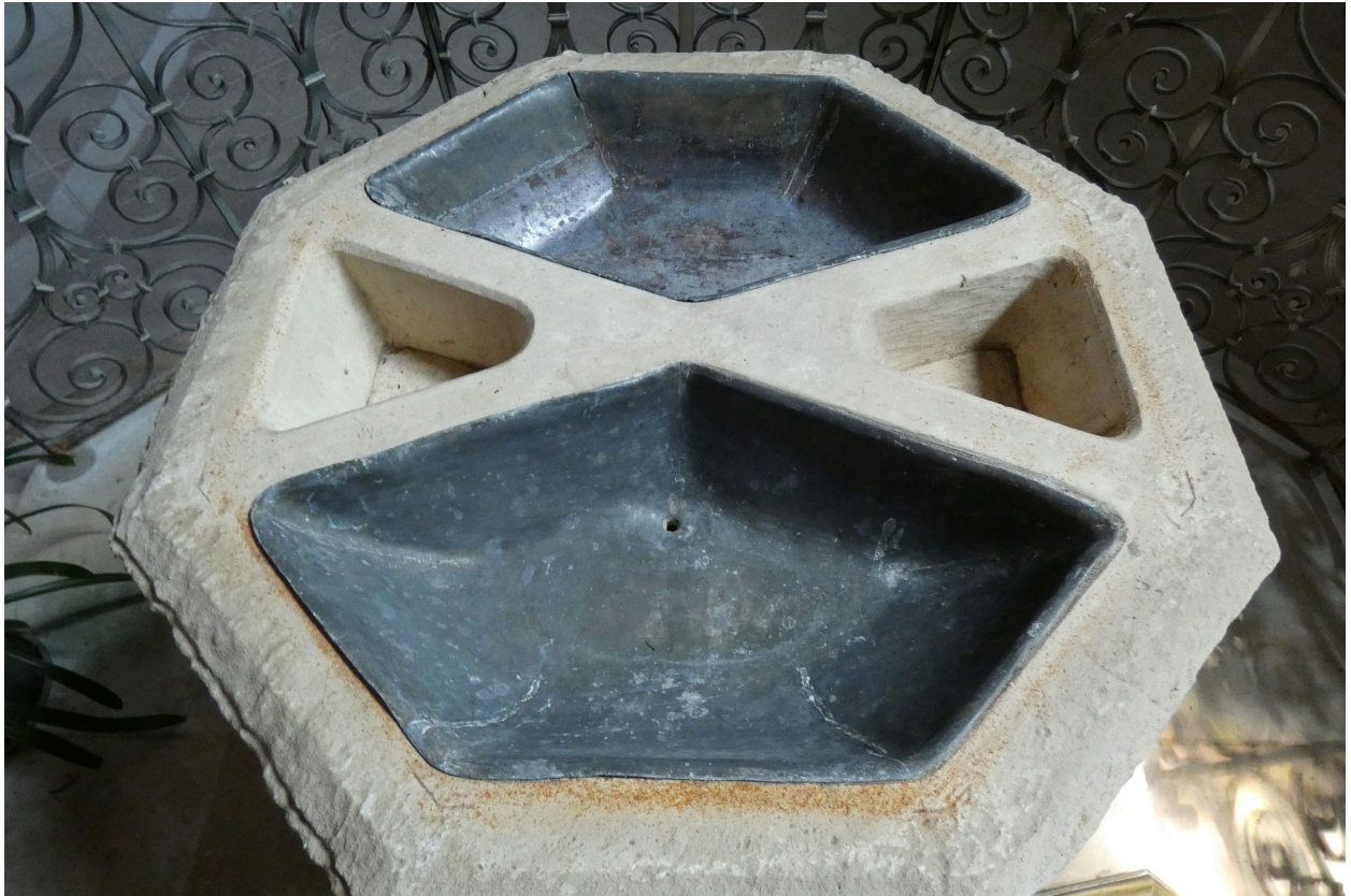
L'intérieur de la cuve.