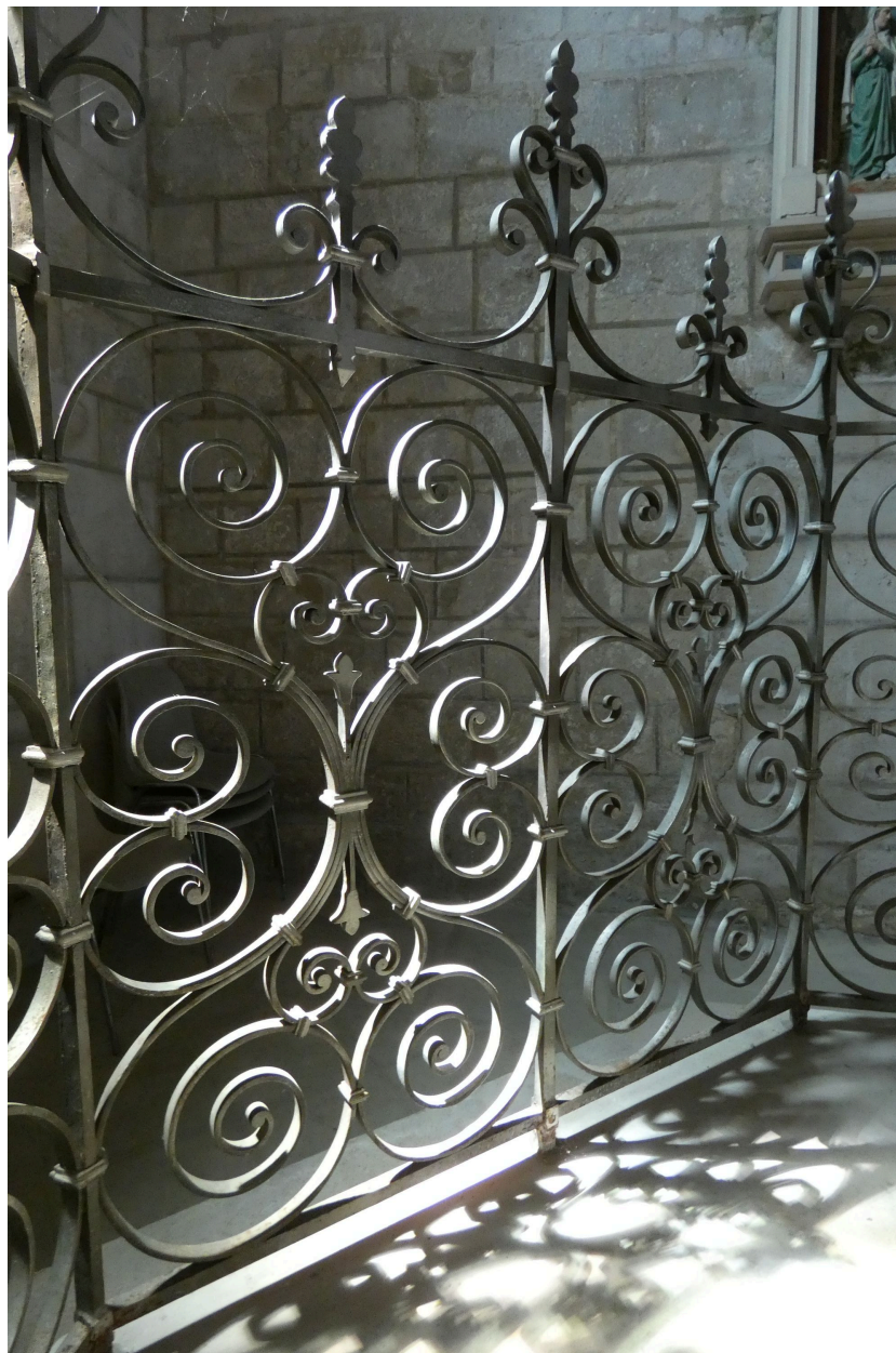
Détail de la clôture.