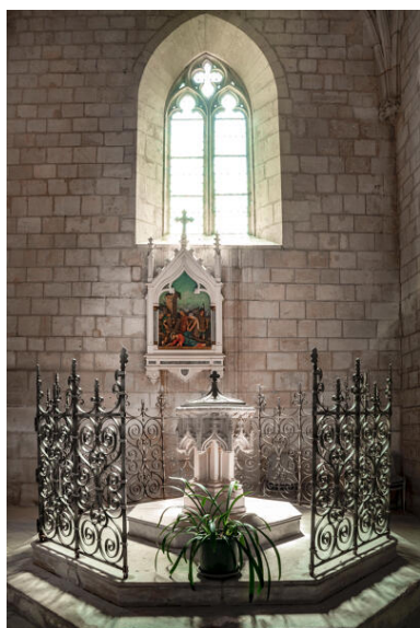
Vue d'ensemble des fonts baptismaux et de leur clôture.