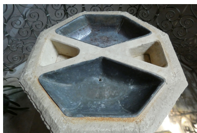
L'intérieur de la cuve. IVR52_20238502066NUCA