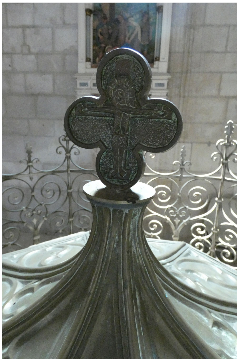
Le médaillon au sommet du couvercle, orné du Christ en croix.