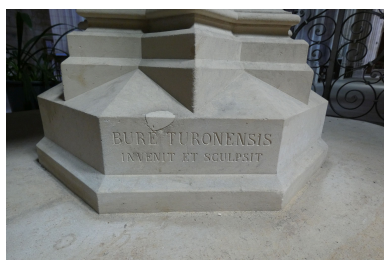
L'inscription sur le pied.