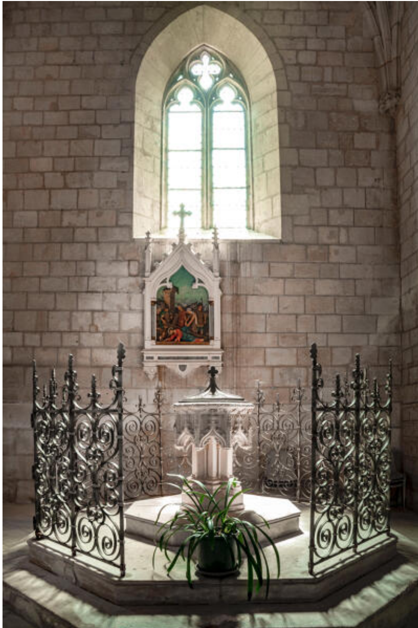
Vue d'ensemble des fonts baptismaux et de leur clôture.