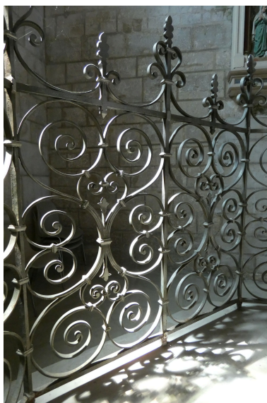
Détail de la clôture. IVR52_20238502070NUCA