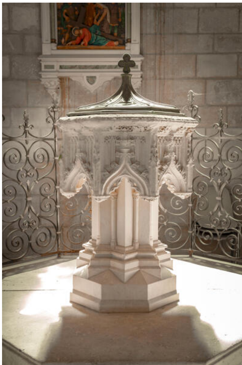
Les fonts baptismaux.