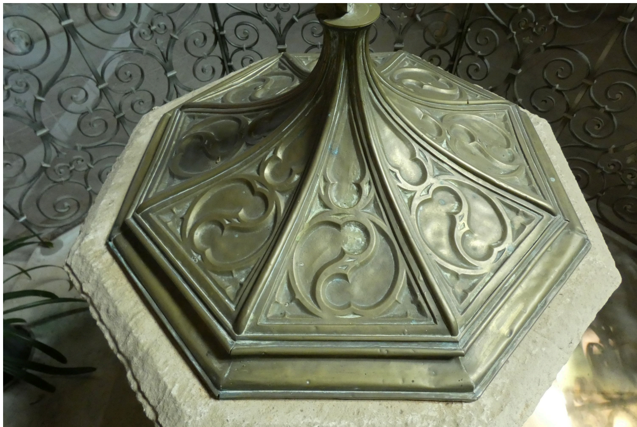
Décor d'entrelacs sur le couvercle.