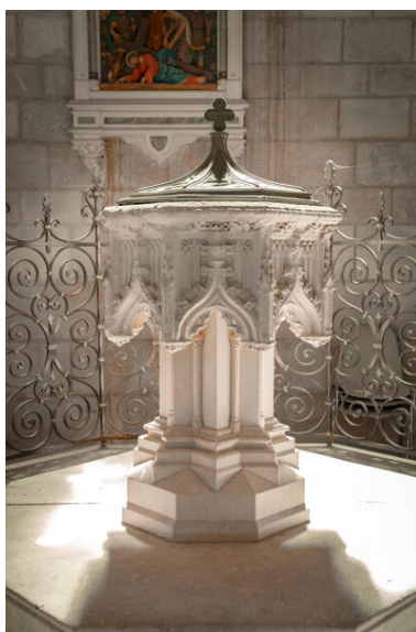
Les fonts baptismaux. IVR52_20238500664NUCA