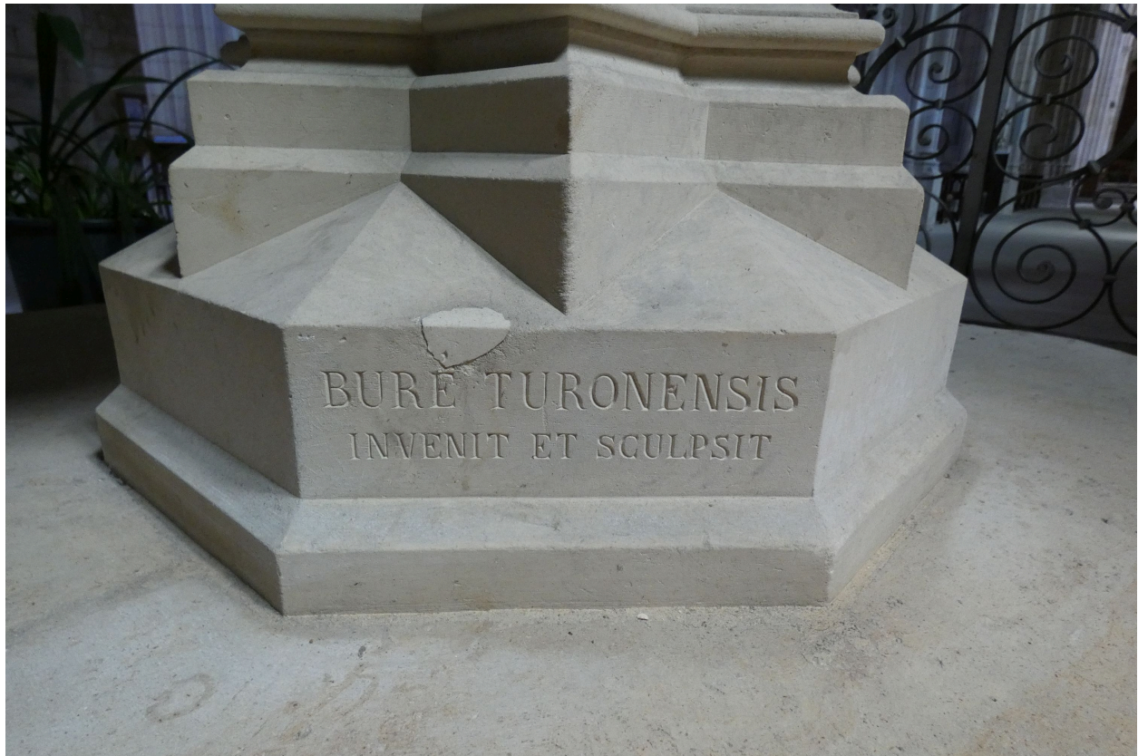
L'inscription sur le pied.