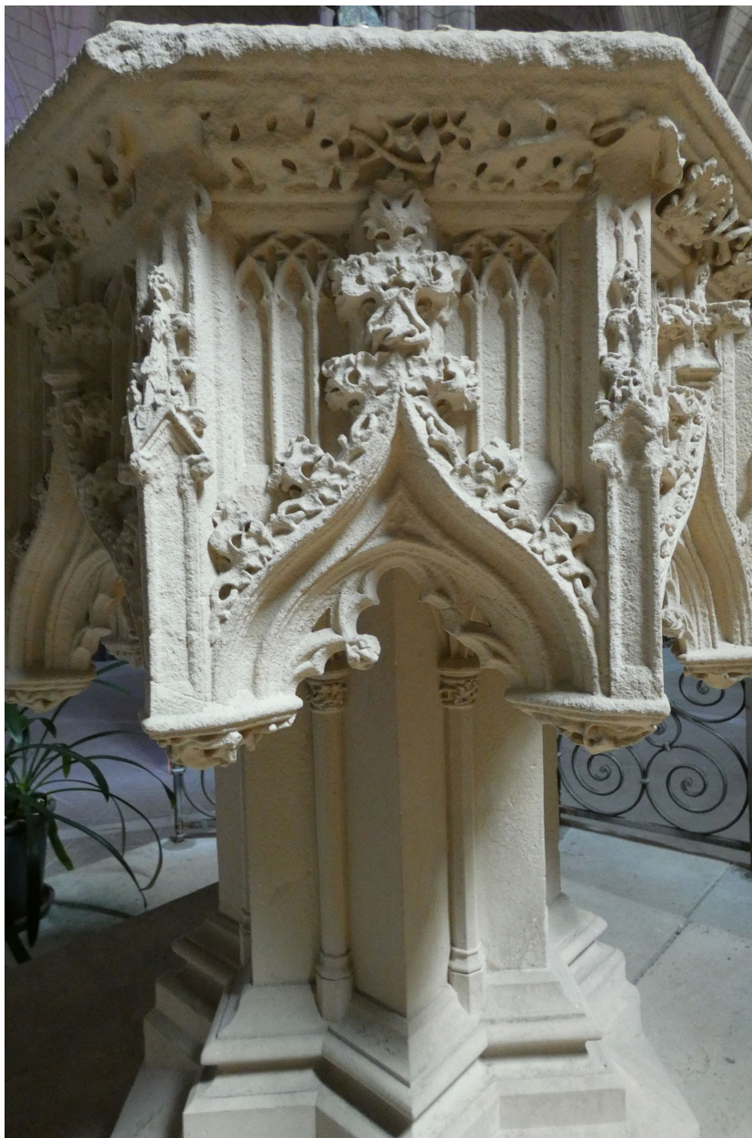
Détail du décor architecturé de la cuve.