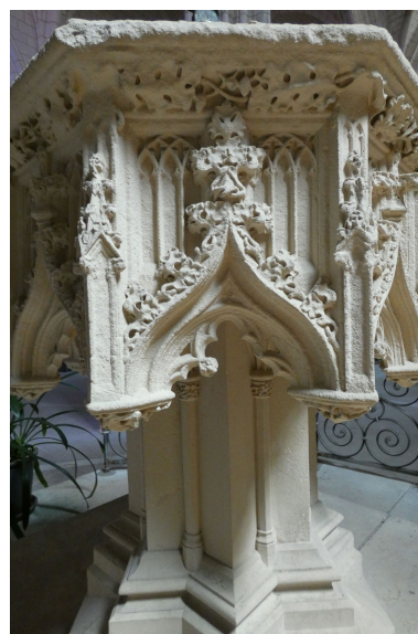
Détail du décor architecturé de la cuve.