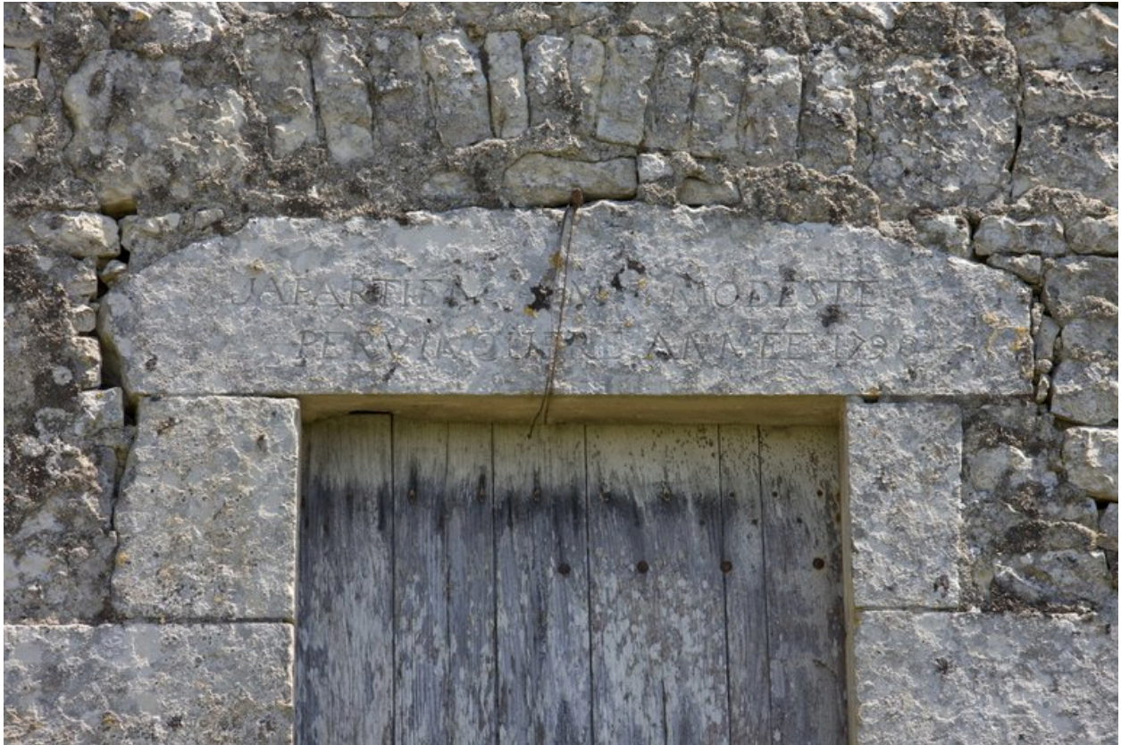
Inscription sur le pignon de l'étable.