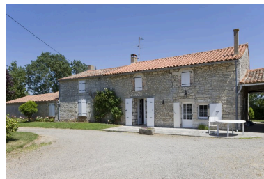
Façade ouest de la maison.