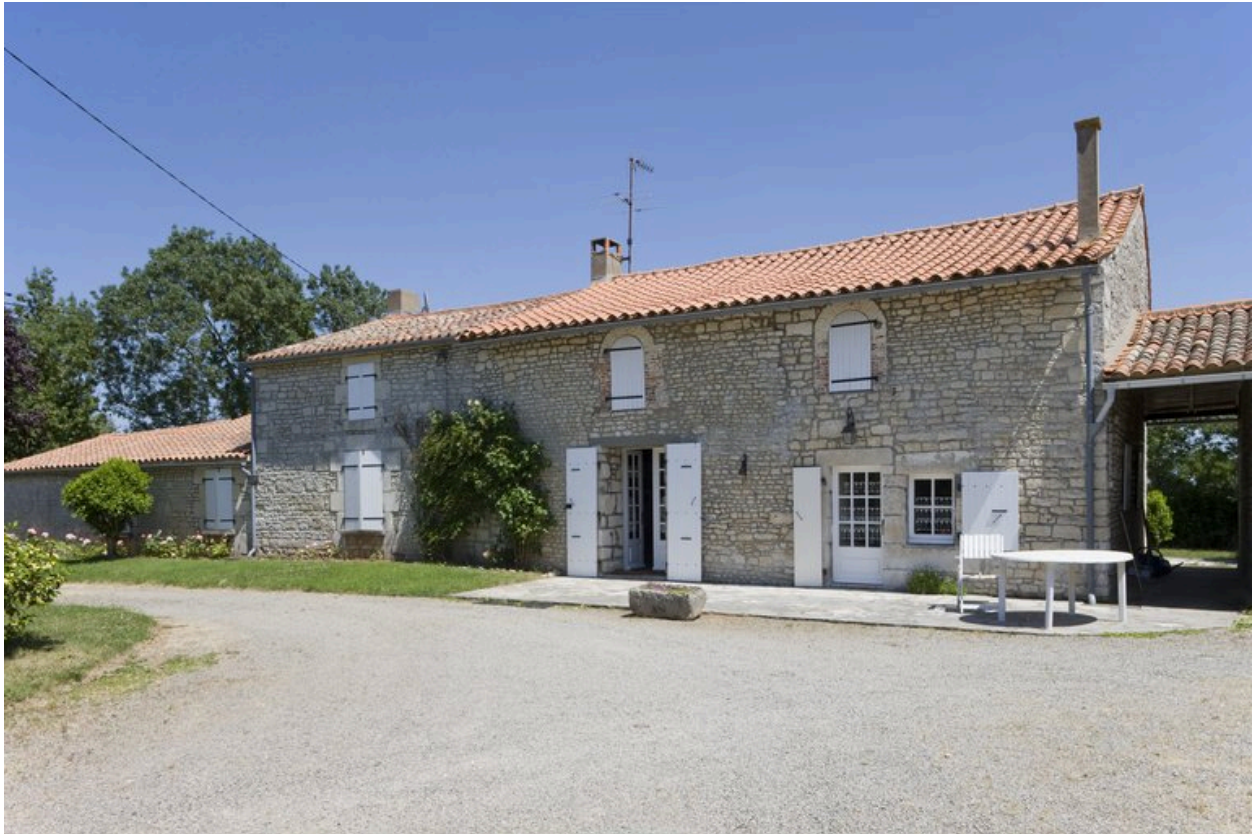
Façade ouest de la maison.