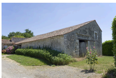
Vue de l'étable à bovins, prise du nord. IVR52_20098500366NUCA