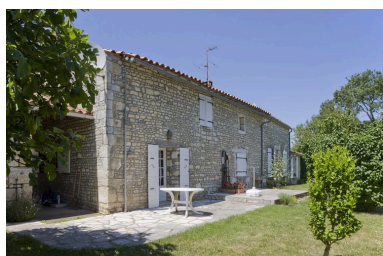
Façade est de la maison.