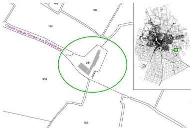
Les bâtiments de la métairie sur le plan cadastral actuel.