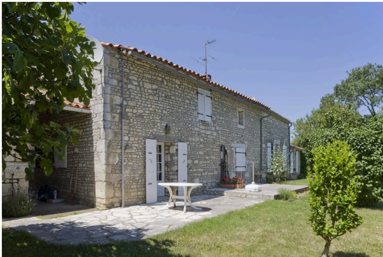
Façade est de la maison.