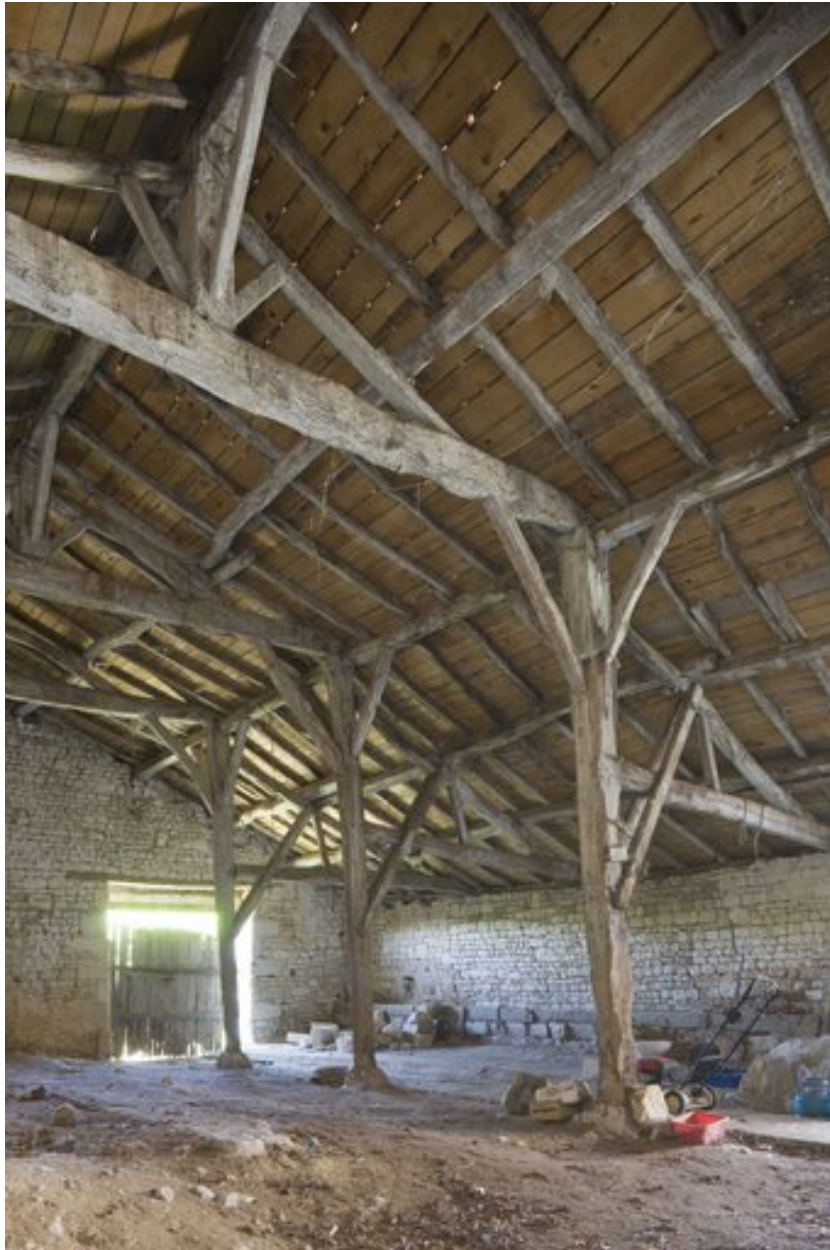
Vue intérieure de l'étable.