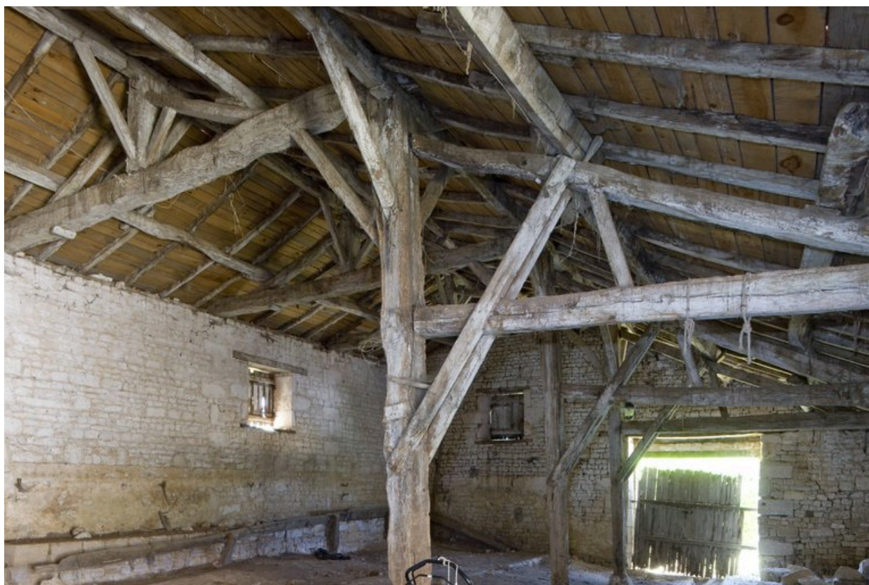
Vue intérieure de l'étable.