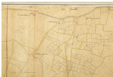
La Chussonnerie en 1845 : détail de la section D n° 3 du plan cadastral. Le nord est à droite. IVR52_20078500474NUCA