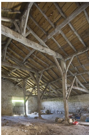
Vue intérieure de l'étable. IVR52_20098500363NUCA