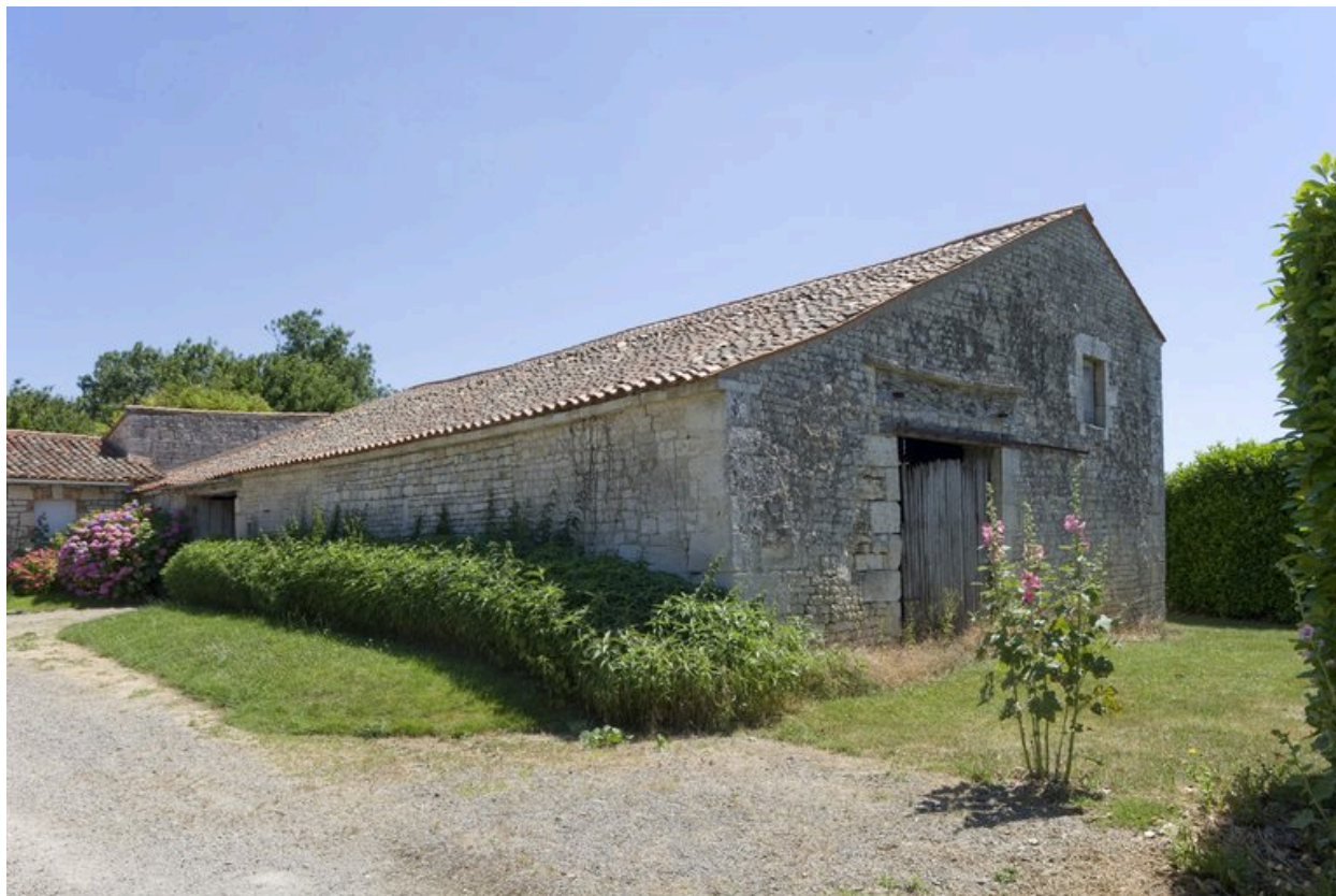
Vue de l'étable à bovins, prise du nord.