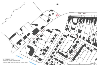
Situation sur données cadastrales 2008. IVR52_20094400316NUDA