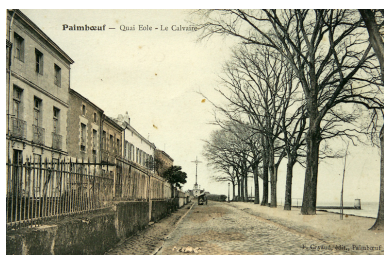
Le quai Eole, 2e quart XXe siècle, en arrière-plan, le calvaire, à droite la tour de la Pierre-à-l'œil.