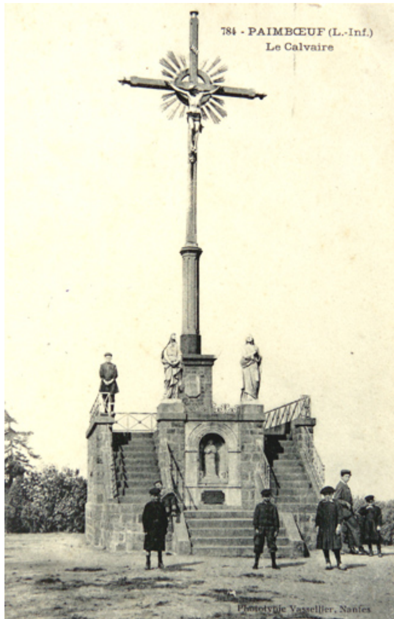
Le calvaire, 2e quart XXe siècle.