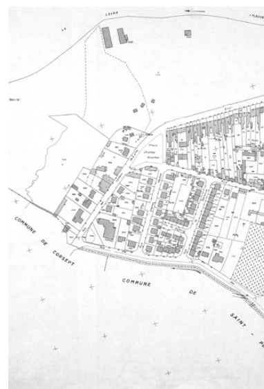
Plan cadastral, 2002, extrait. IVR52_20034400103NUCA