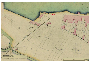
Situation sur cadastre 1810. IVR52_20094400315NUDA