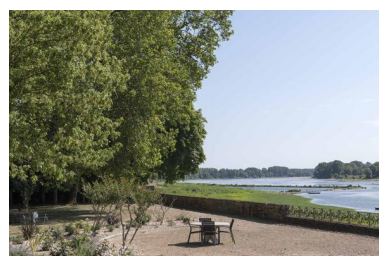
Vue sur la Loire depuis la terrasse. IVR52_20194900499NUCA