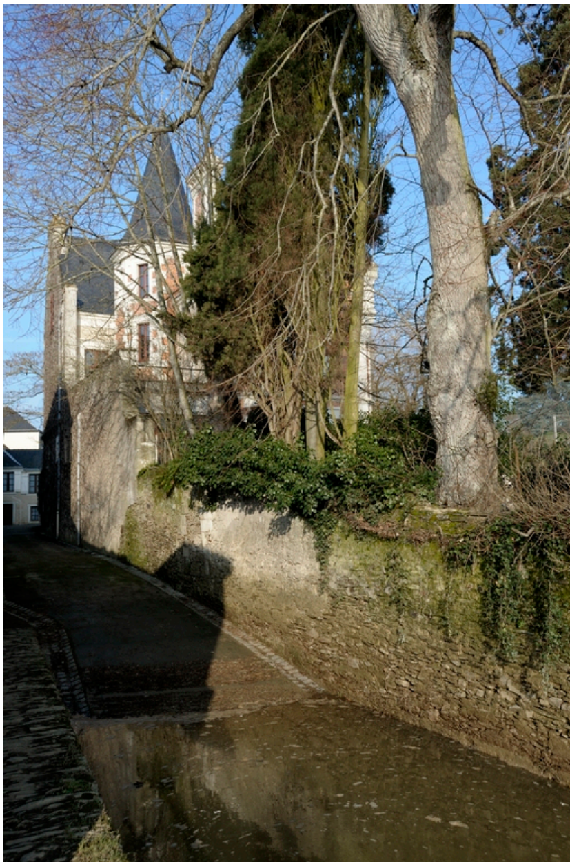
Vue depuis la rue Baron.