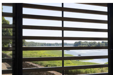
Vue de l'intérieur du pavillon.