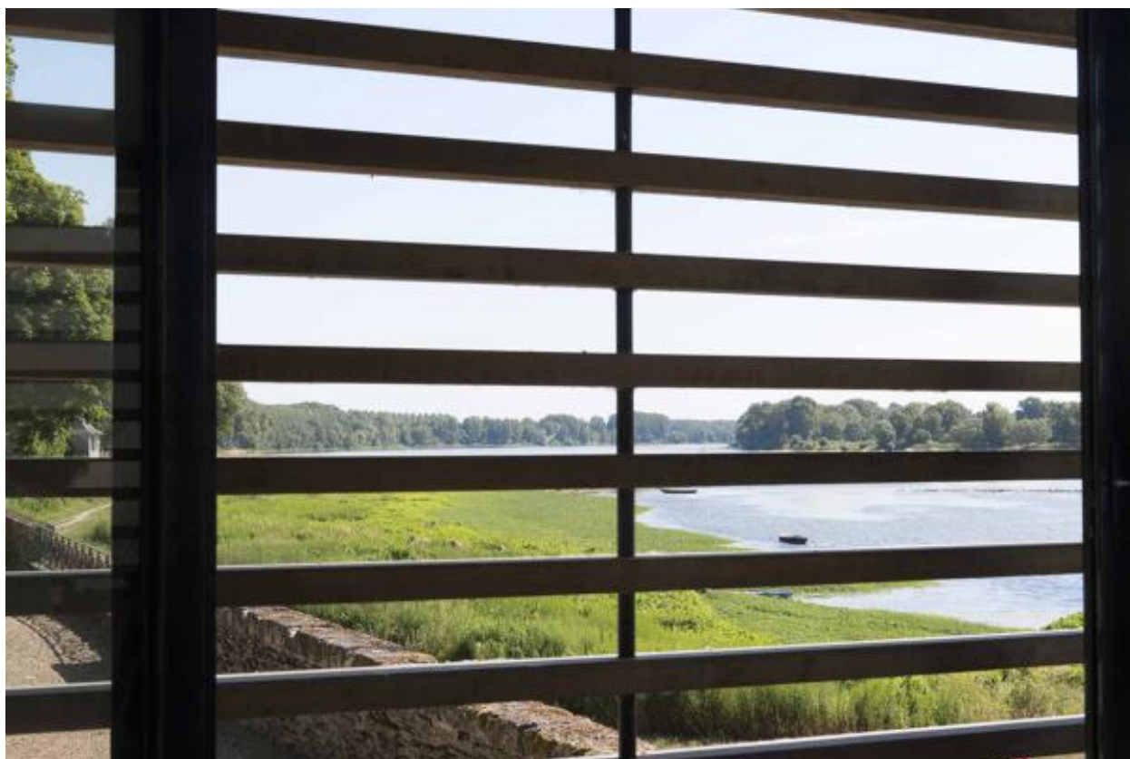
Vue de l'intérieur du pavillon.