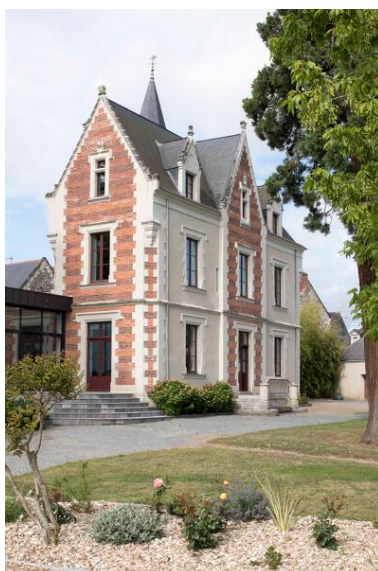
Vue d'ensemble depuis le nord-ouest. IVR52_20194900536NUCA