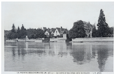
La Loire et les villas vers le moulin. IVR52_20134900383NUCA