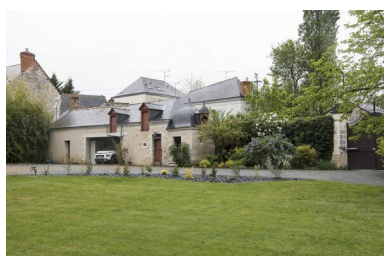
Vue des communs.