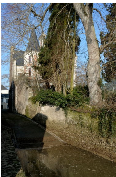
Vue depuis la rue Baron.