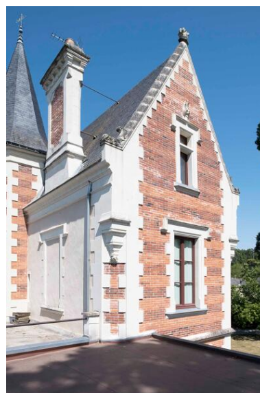
Détail du pignon ouest.