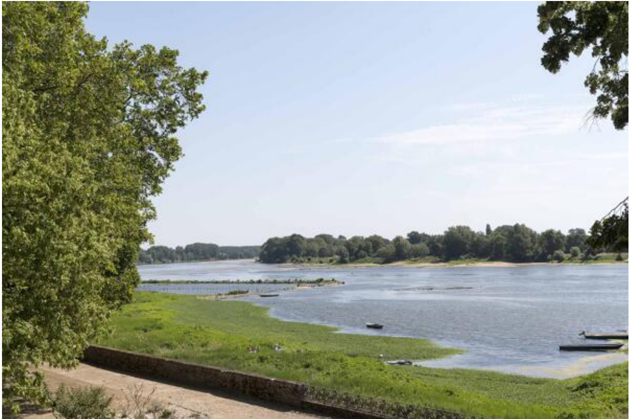
Vue sur la Loire.