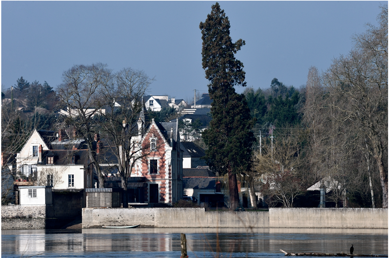
Vue d'ensemble depuis la Loire.