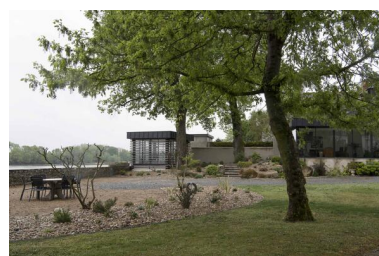
Vue sur le jardin et sur le pavillon moderne.