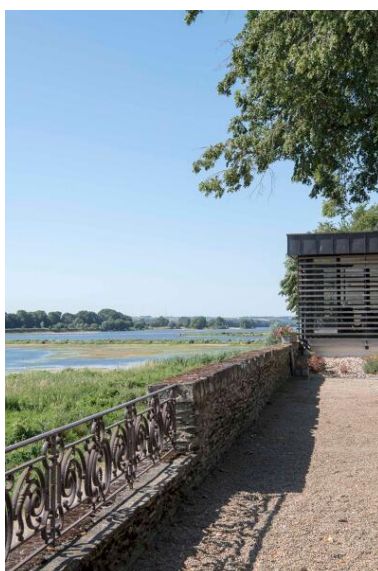
Vue sur la Loire et le pavillon. IVR52_20194900497NUCA