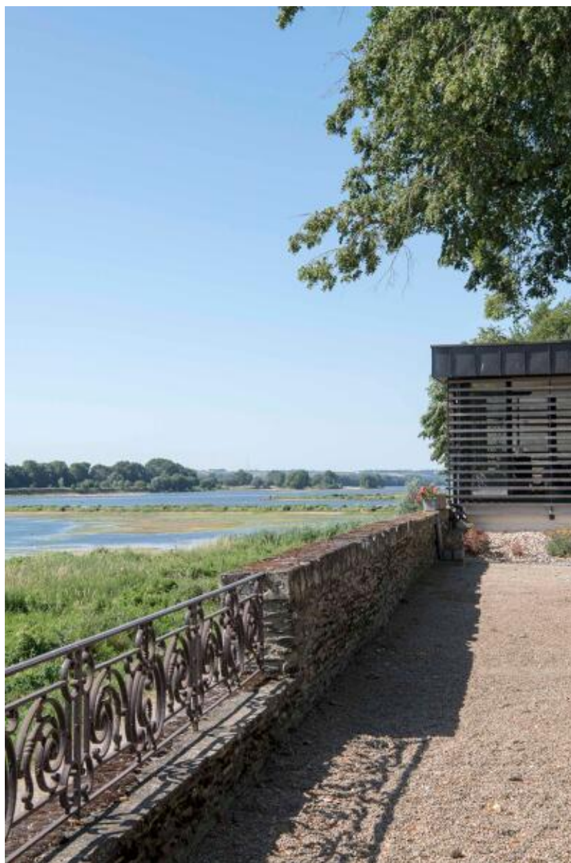
Vue sur la Loire et le pavillon.