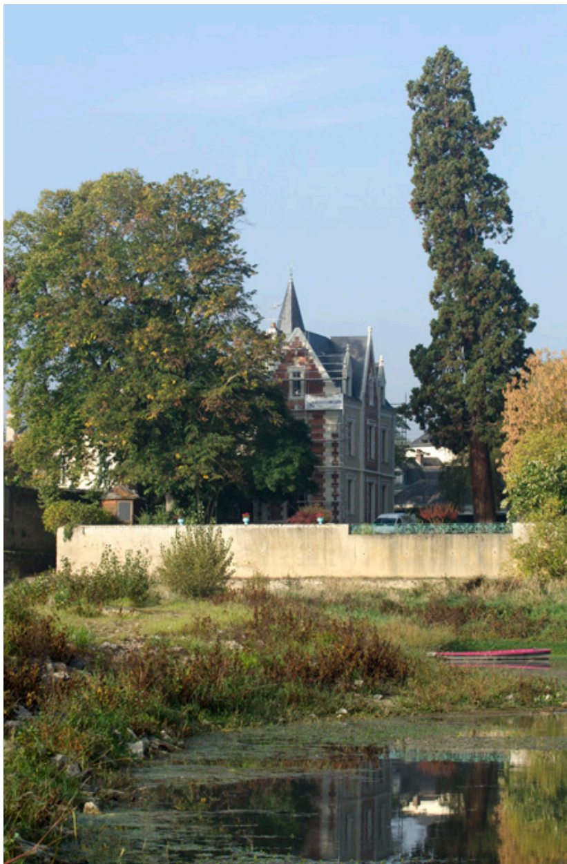
Vue depuis la Loire.