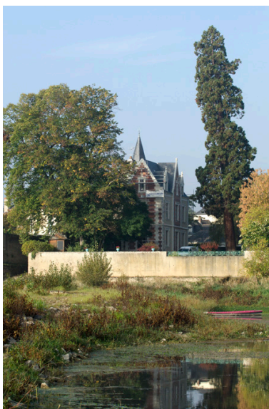
Vue depuis la Loire.