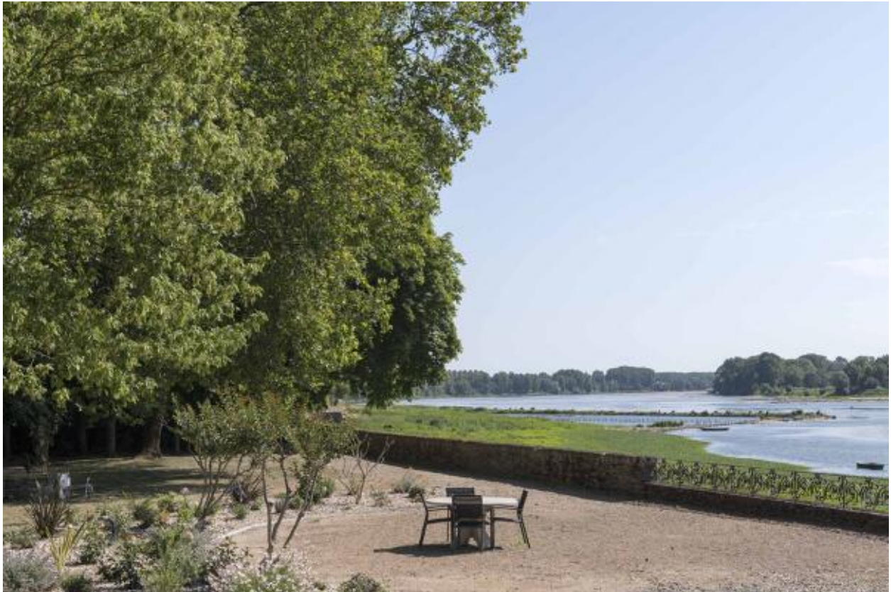
Vue sur la Loire depuis la terrasse.