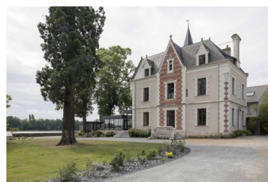
Vue d'ensemble depuis le nord. IVR52_20194900538NUCA