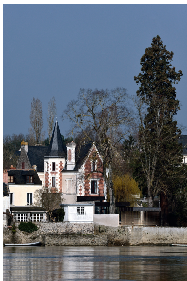
Vue d'ensemble depuis la Loire. IVR52_20164900193NUCA