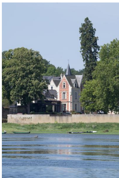
Vue depuis la rive gauche.