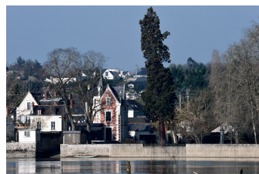
Vue d'ensemble depuis la Loire. IVR52_20164900177NUCA