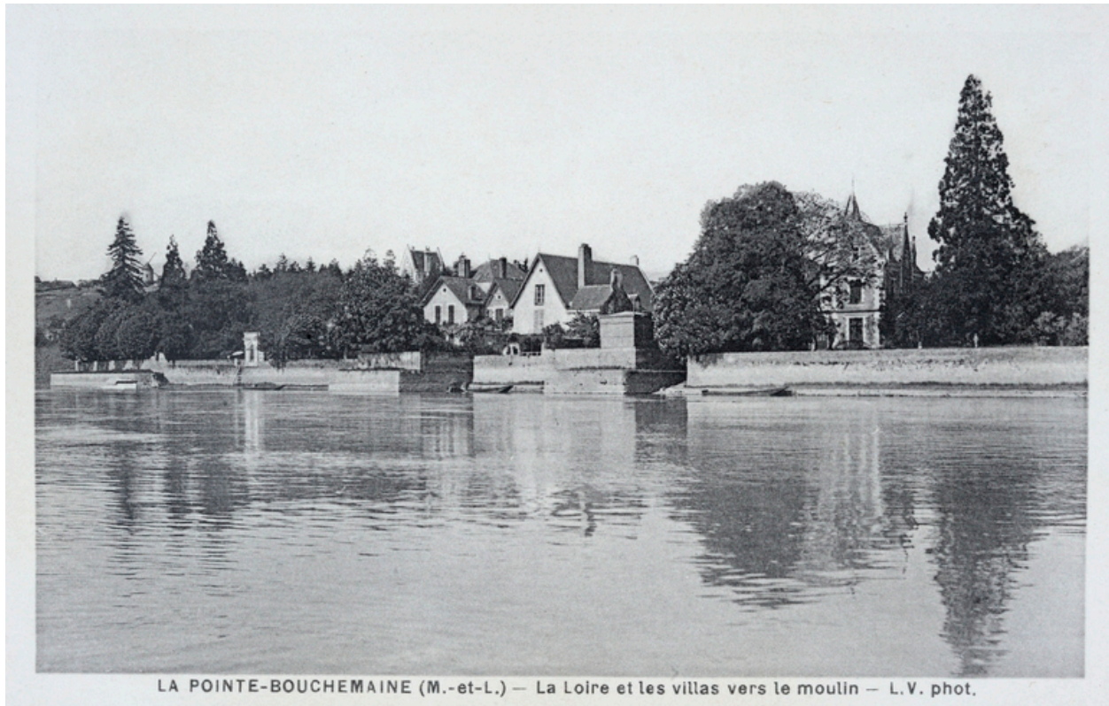
LA POINTE-BOUCHEMAINE (M.-et-L.) — La Loire et les villas vers le moulin

La Loire et les villas vers le moulin.