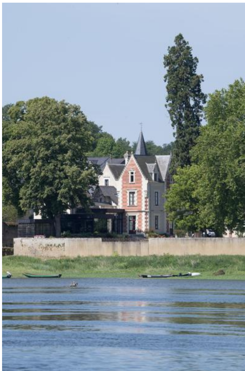
Vue depuis la rive gauche.