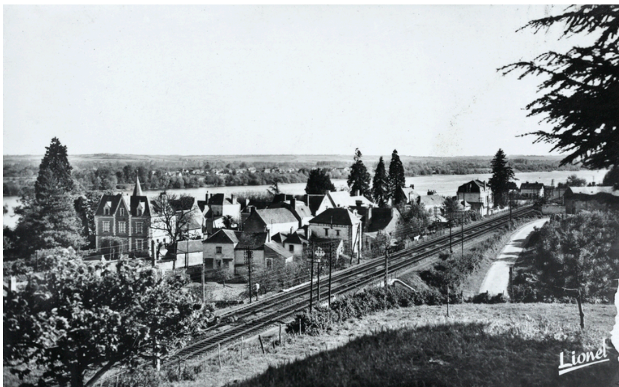
Le Mesnil-Riant (à gauche). Vue d'ensemble depuis la voie de chemin de fer. Carte Postale. Milieu du 20e siècle.