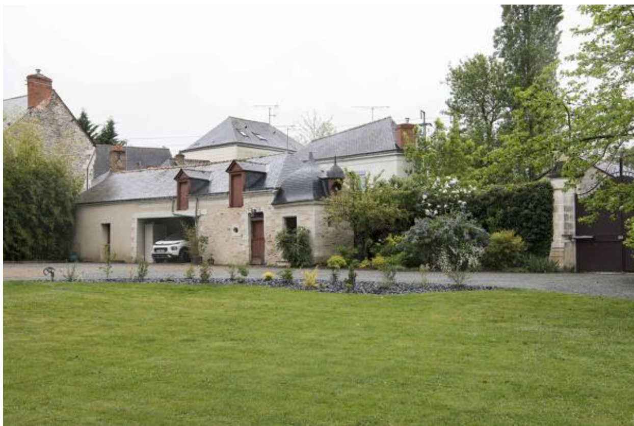
Vue des communs.