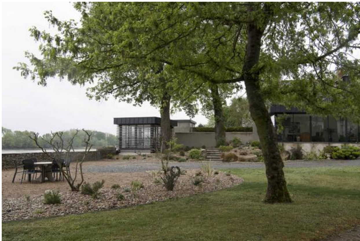
Vue sur le jardin et sur le pavillon moderne.