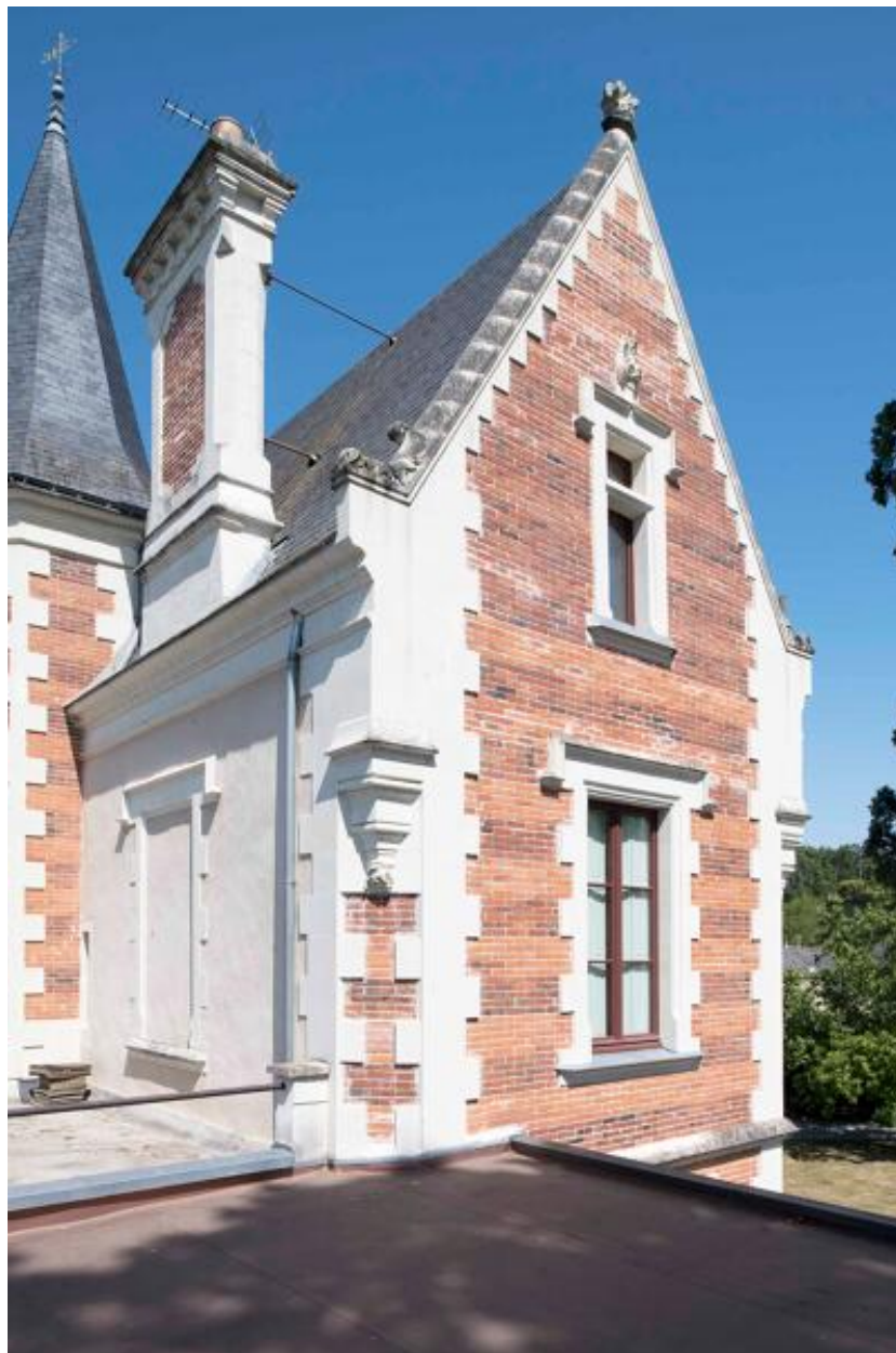
Détail du pignon ouest.