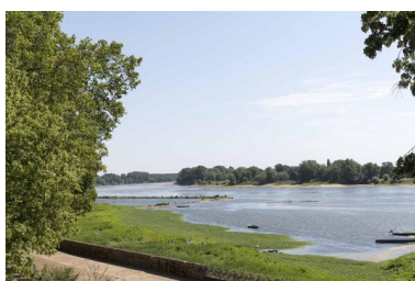
Vue sur la Loire.