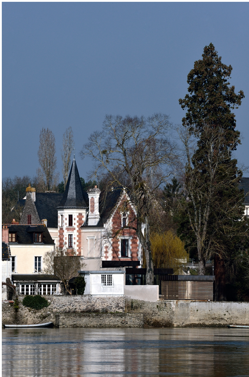
Vue d'ensemble depuis la Loire.