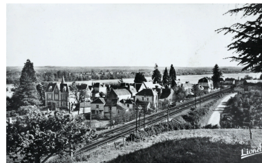
Le Mesnil-Riant (à gauche). Vue d'ensemble depuis la voie de chemin de fer. Carte Postale. Milieu du 20e siècle. IVR52_20134900376NUCA