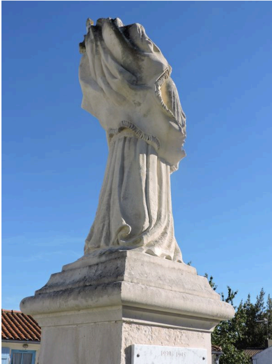
Vue arrière de la statue.