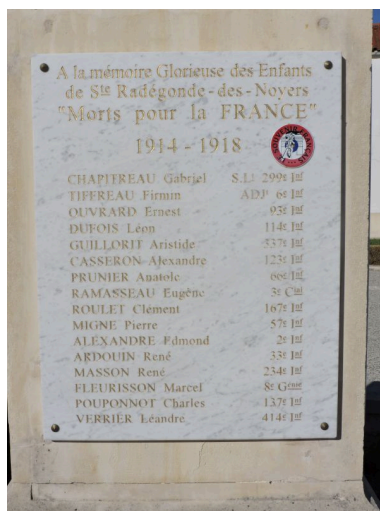
Plaque à l'avant du socle. IVR52_20188500488NUCA