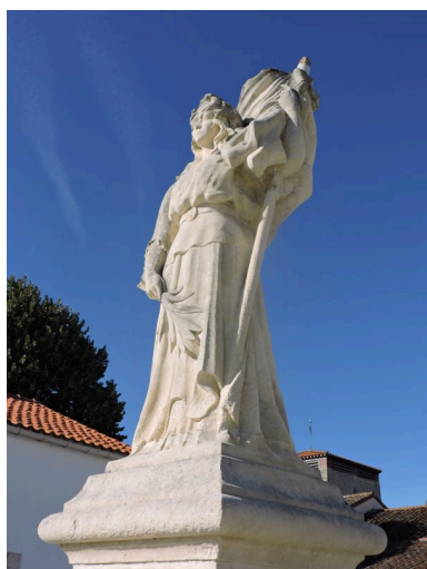
La statue vue de côté.