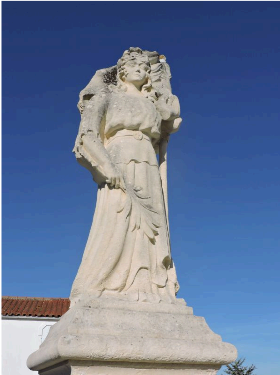
La statue vue de face.