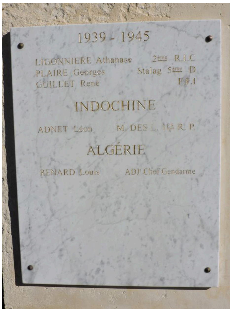
Plaque sur le côté gauche du socle.