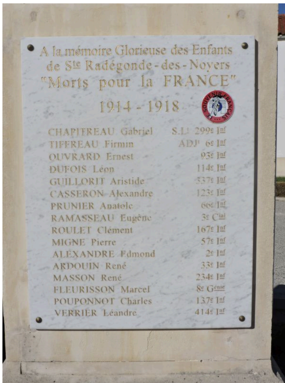
Plaque à l'avant du socle.