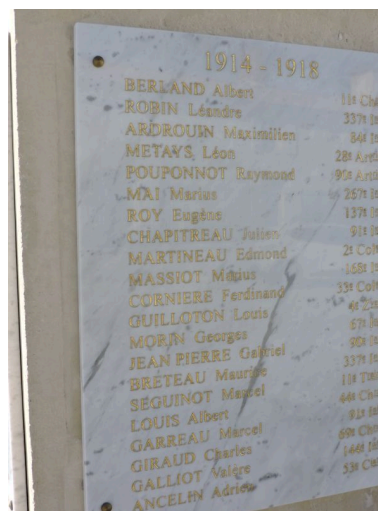
Plaque sur le côté droit du socle.