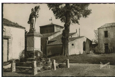
Le monument aux morts vers 1930.