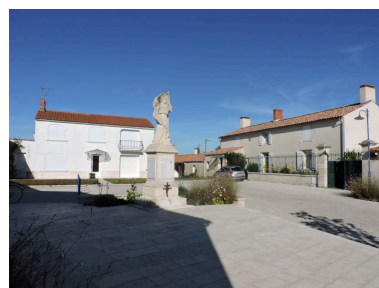
Le monument au centre de la place, vu depuis le sud-ouest. IVR52_20188500493NUCA