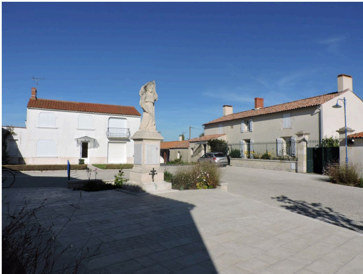
Le monument au centre de la place, vu depuis le sud-ouest.