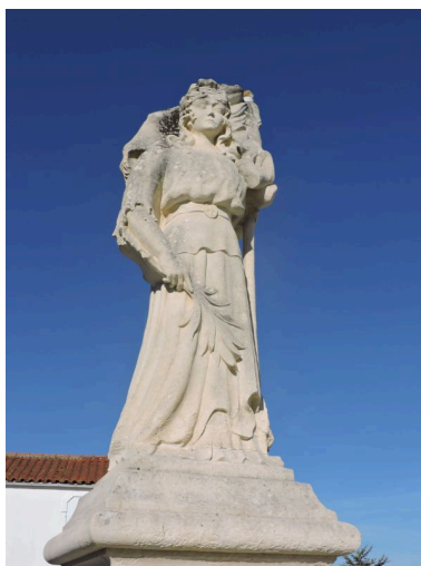
La statue vue de face.