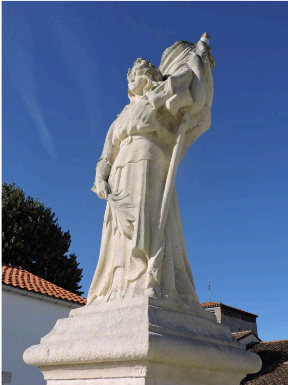
La statue vue de côté.