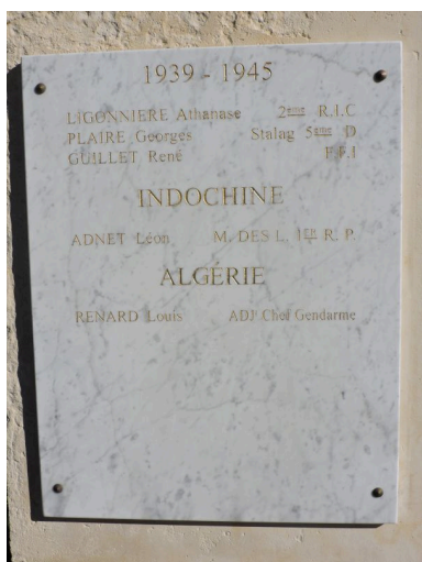
Plaque sur le côté gauche du socle.