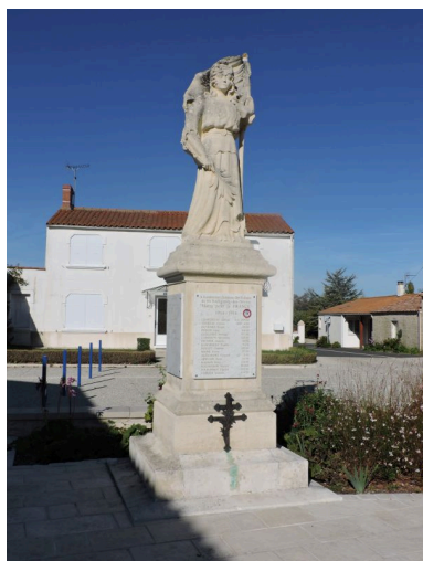
Vue d'ensemble depuis le sud-ouest. IVR52_20188500486NUCA