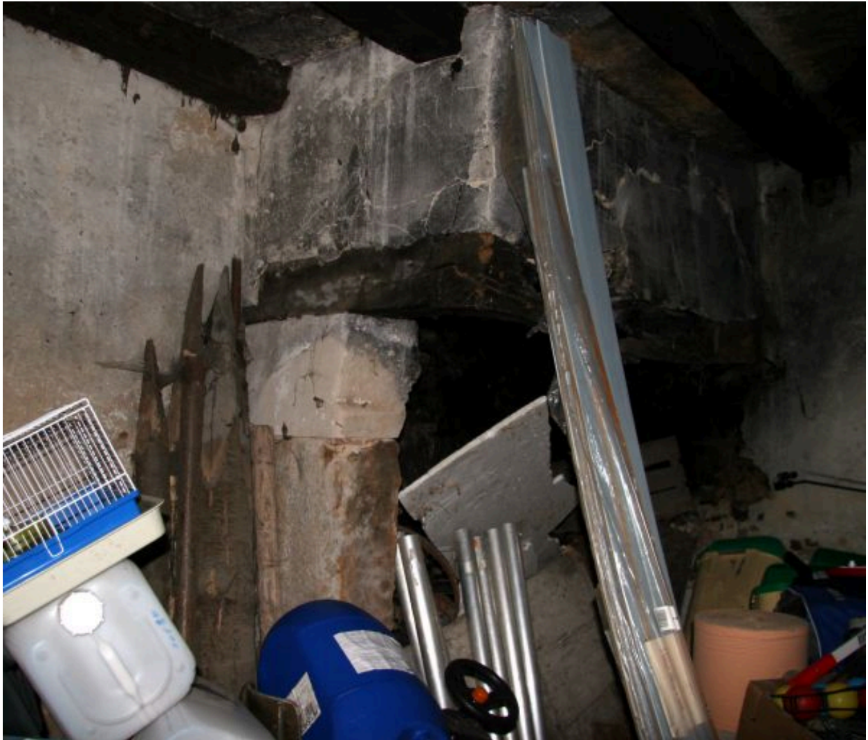
La buanderie : cheminée.