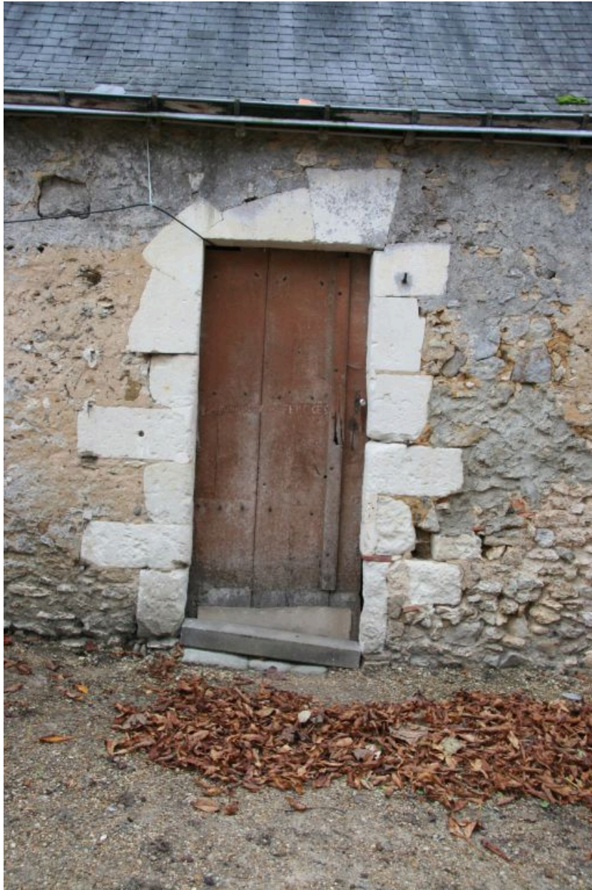
Porte d'entrée de l'écurie.