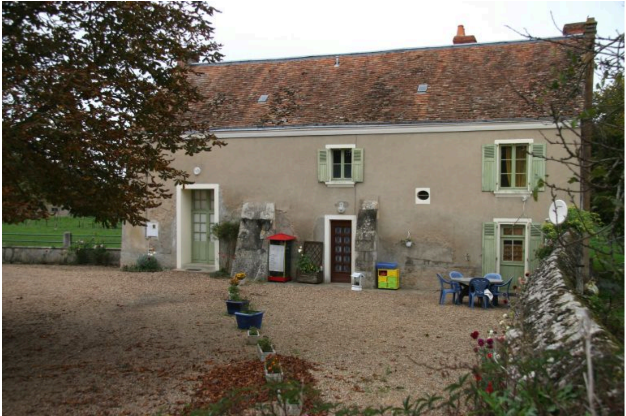
Façade antérieure sur cour.