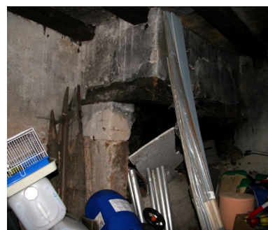
La buanderie : cheminée. IVR52_20067207630NUCA