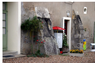
Façade antérieure sur cour, détail : contrefort. IVR52_20067207634NUCA