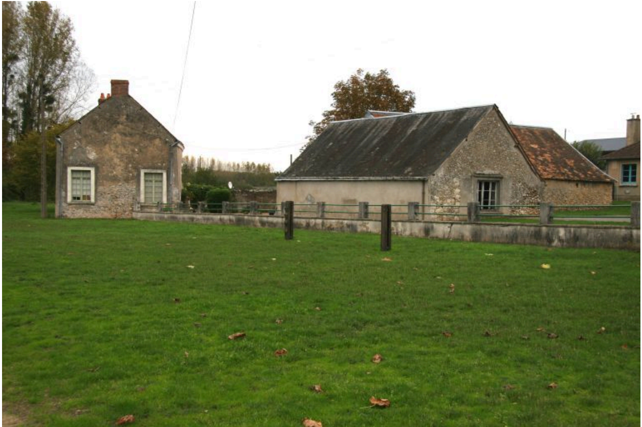
Vue d'ensemble prise de la vieille route de La Flèche.