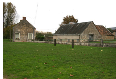
Vue d'ensemble prise de la vieille route de La Flèche.