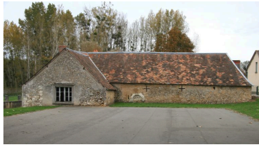
Les communs : façade postérieure.