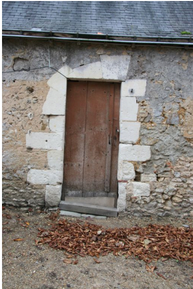
Porte d'entrée de l'écurie. IVR52_20067207631NUCA