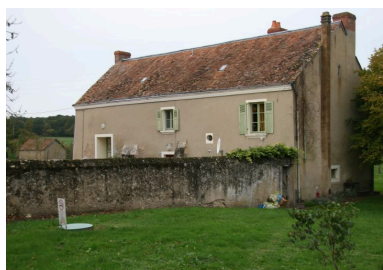
Façade postérieure et mur de clôture.