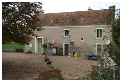
Façade antérieure sur cour.