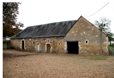
Les communs : façade antérieure sur cour.