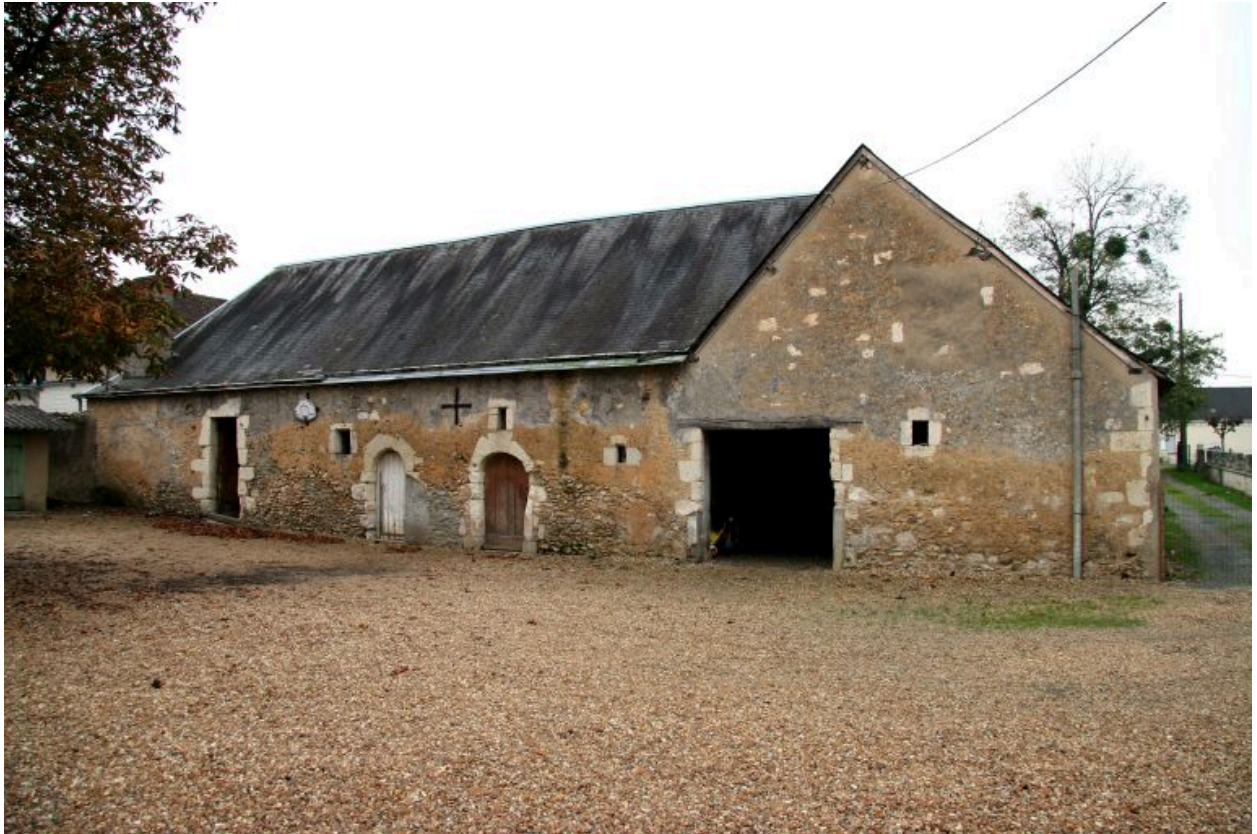
Les communs : façade antérieure sur cour.