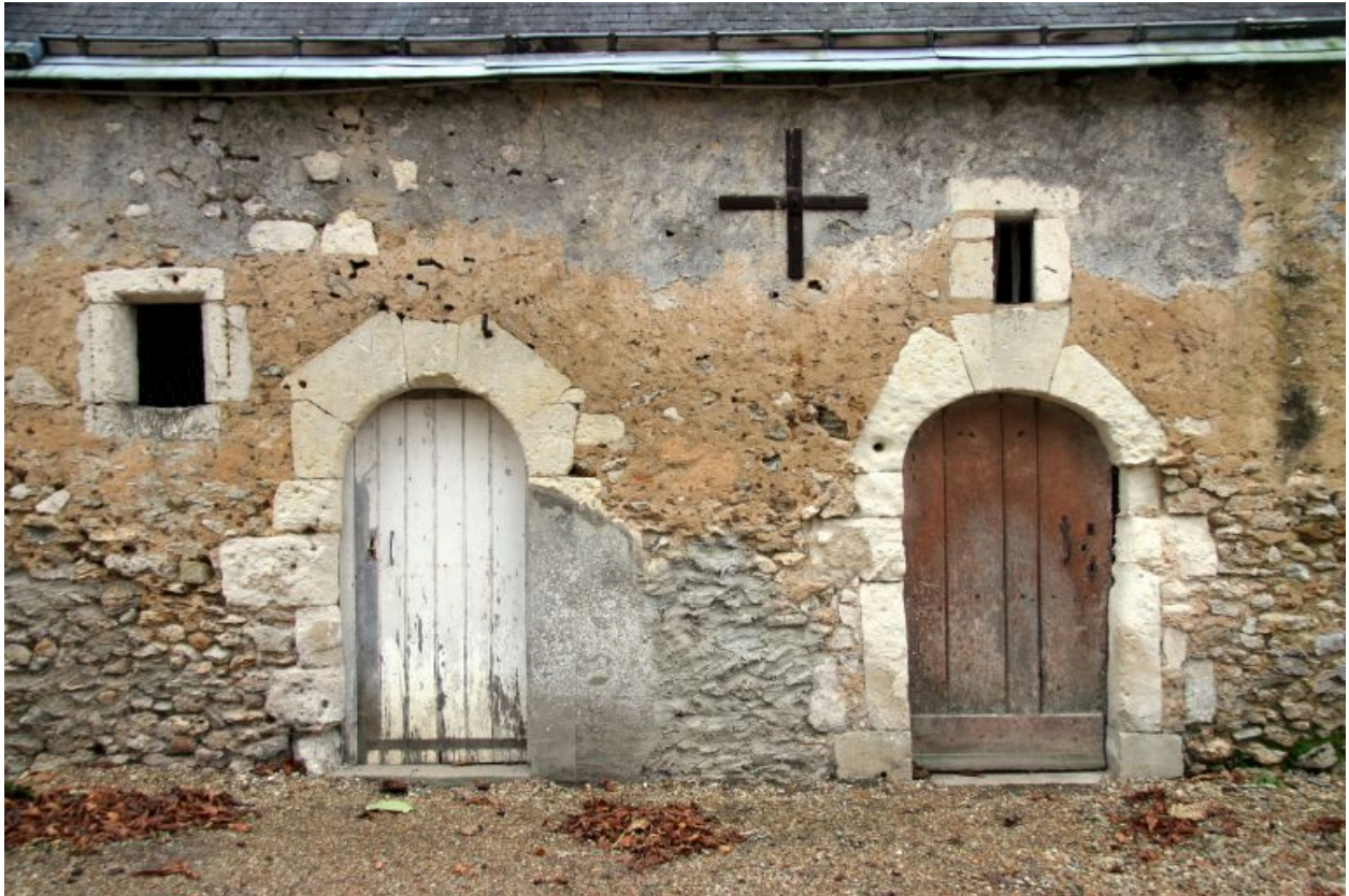
Les communs : porte en plein cintre et porte en anse-de-panier.