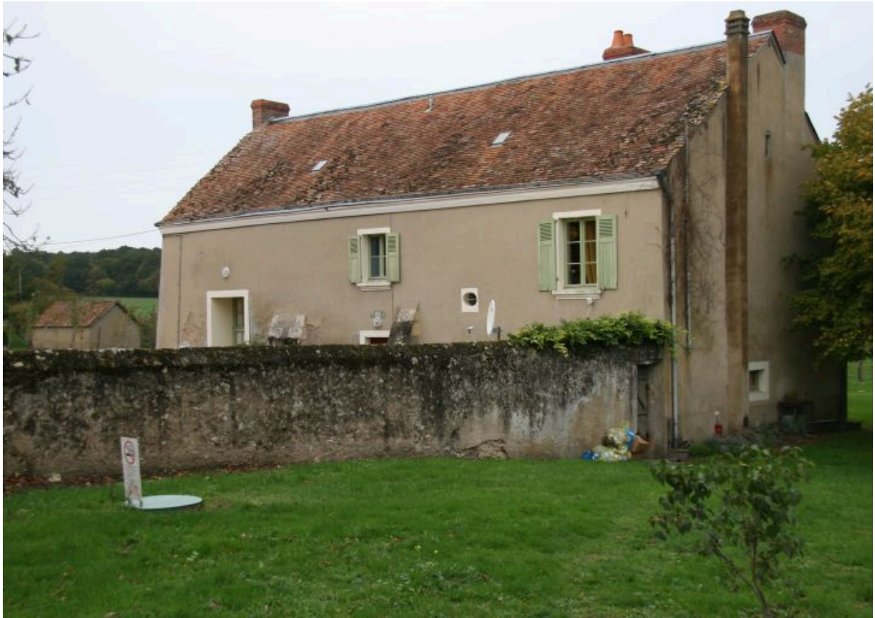
Façade postérieure et mur de clôture.