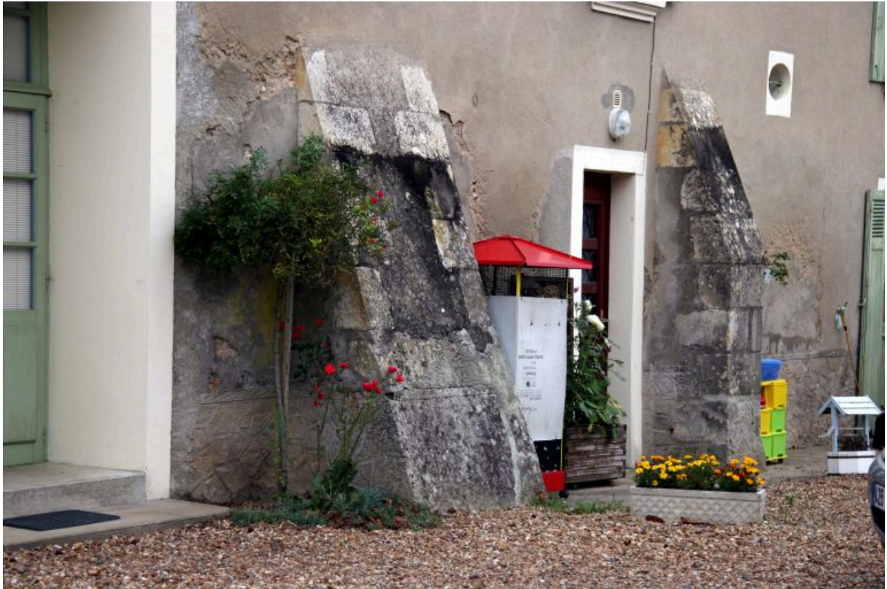
Façade antérieure sur cour, détail : contrefort.