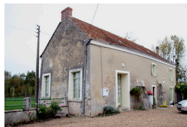
Façade antérieure sur cour. IVR52_20067207633NUCA