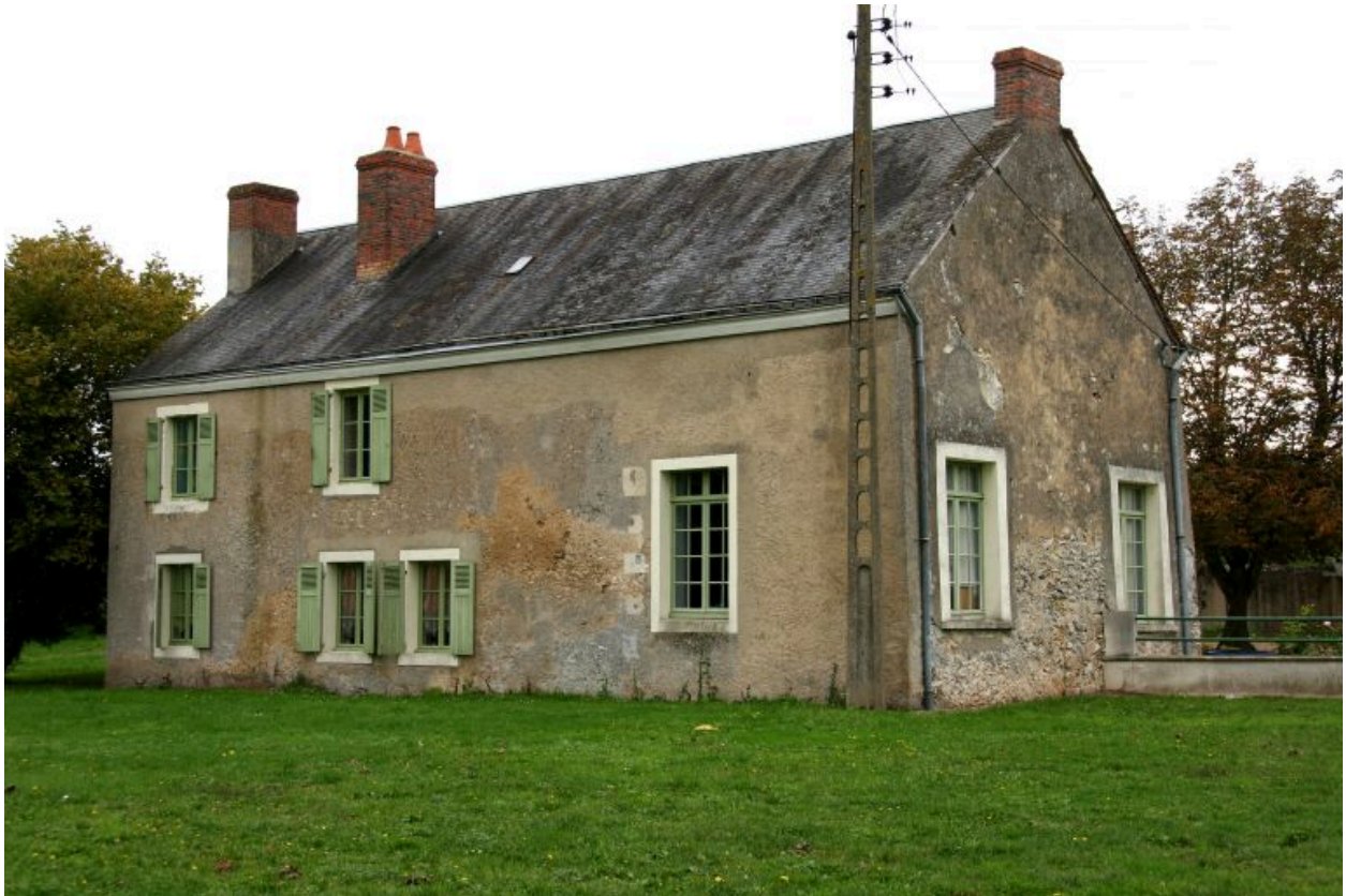
Vue de volume de la façade postérieure.