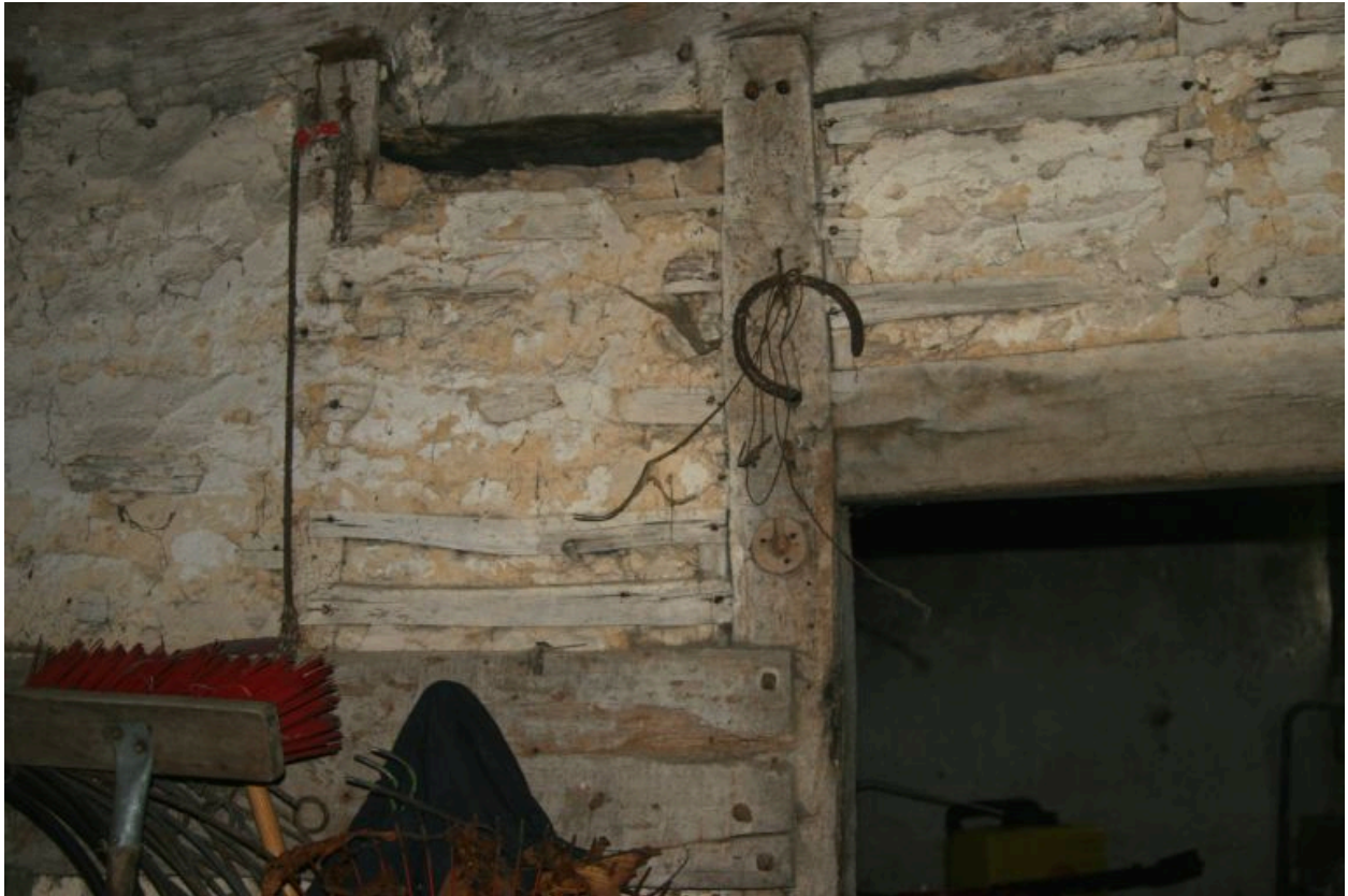
La buanderie : cloison en pan-de-bois.