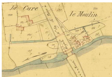
Plan de situation en 1845. IVR52_20057204513NUCA