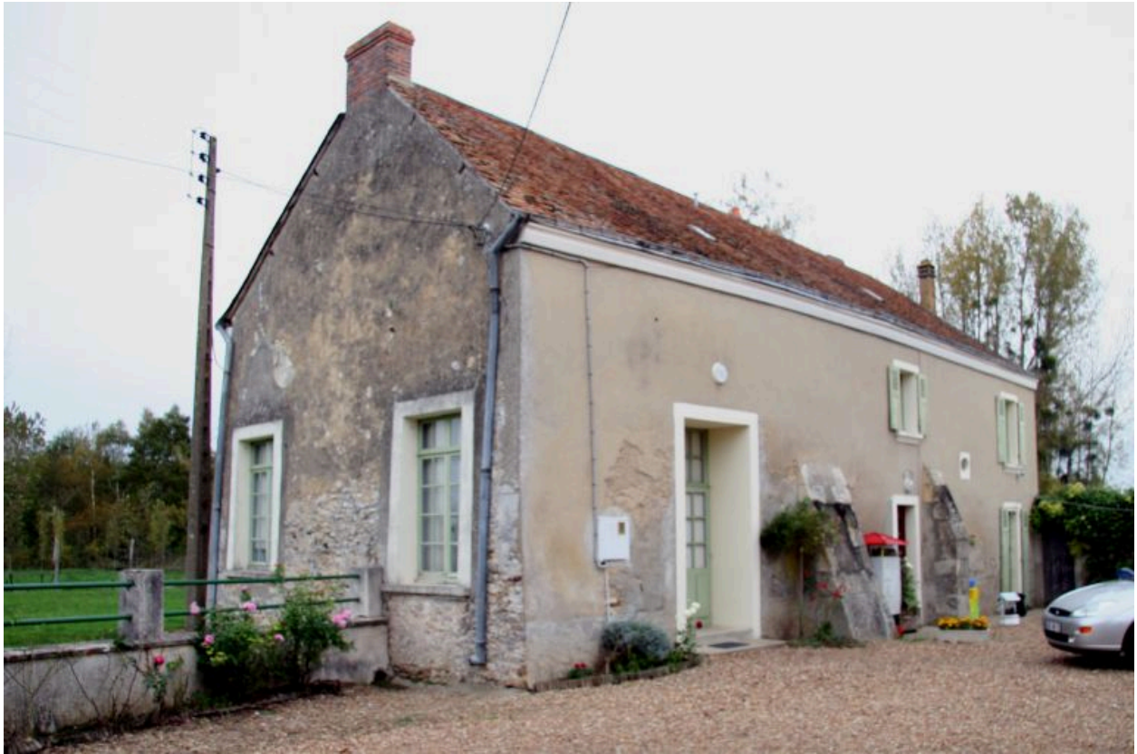
Façade antérieure sur cour.