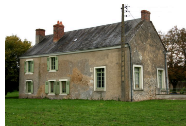
Vue de volume de la façade postérieure.