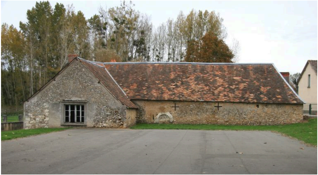
Les communs : façade postérieure.