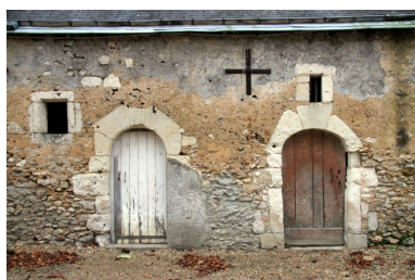
Les communs : porte en plein cintre et porte en anse-de-panier. IVR52_20067207632NUCA