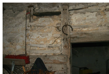
La buanderie : cloison en pan-de-bois. IVR52_20067207629NUCA