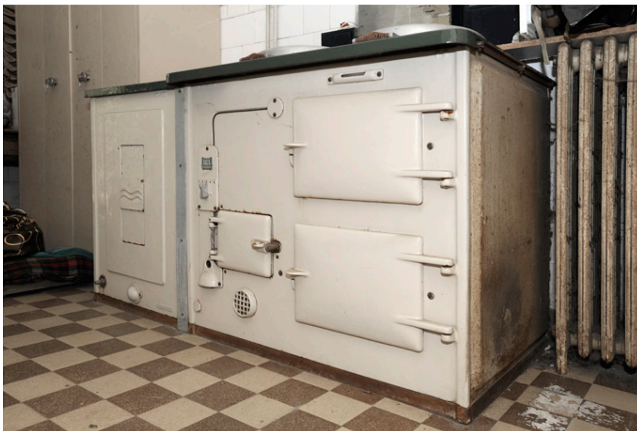
Maison de Jean Pasquier : ancienne cuisinière en fonte émaillée à cloche