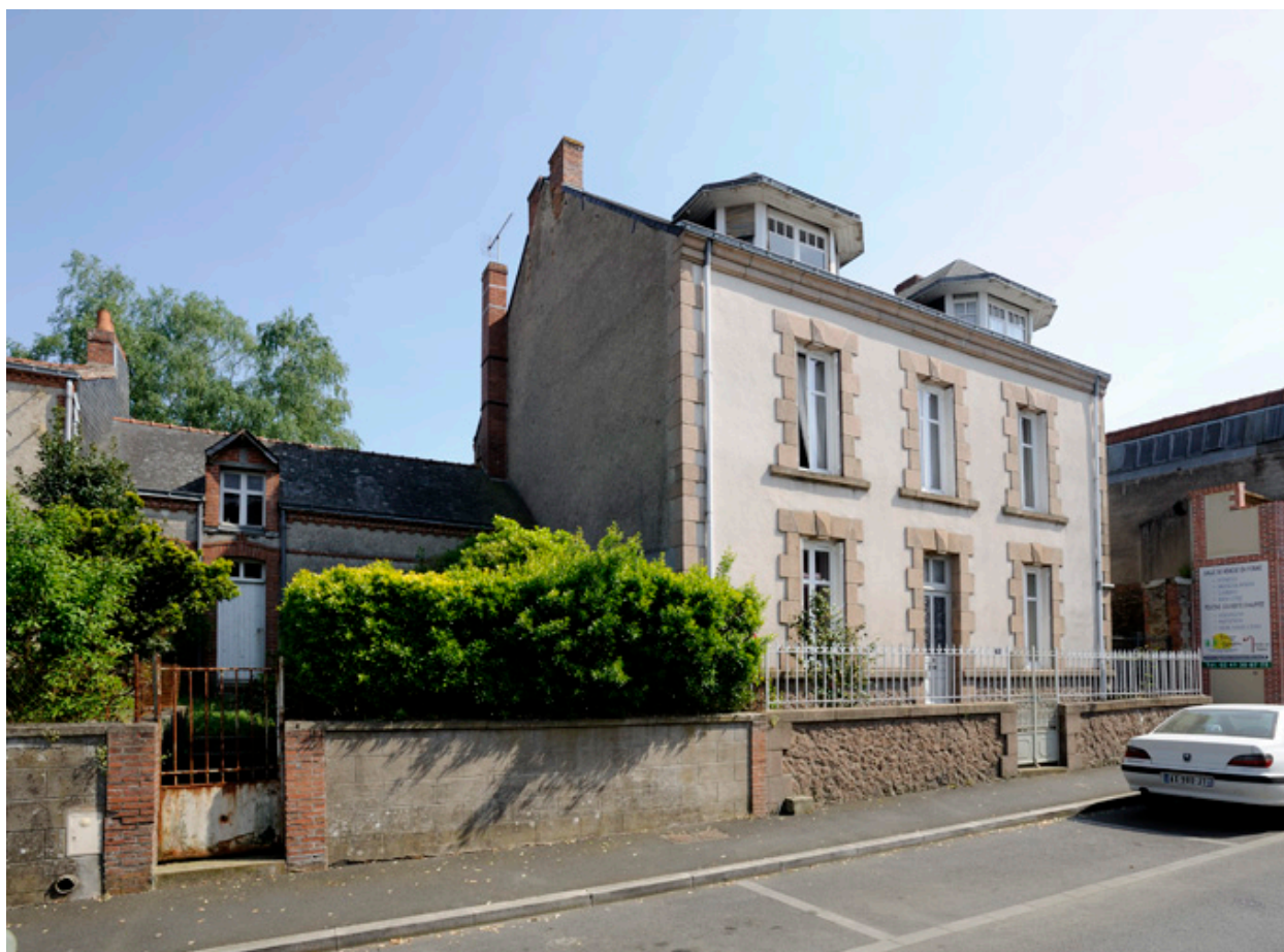
Vue générale de la maison de Jean Pasquier depuis la rue Jeanne d'Arc.