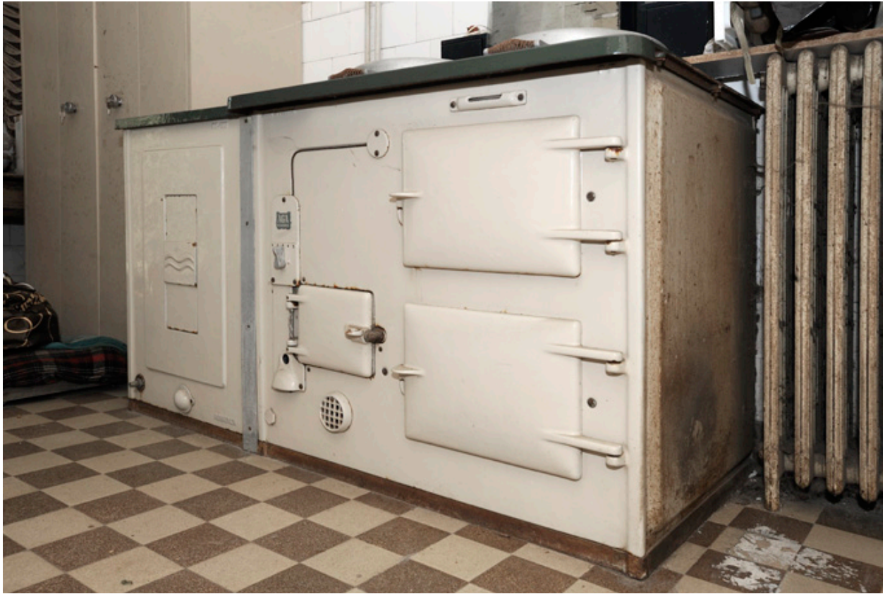
Maison de Jean Pasquier : ancienne cuisinière en fonte émaillée à cloche