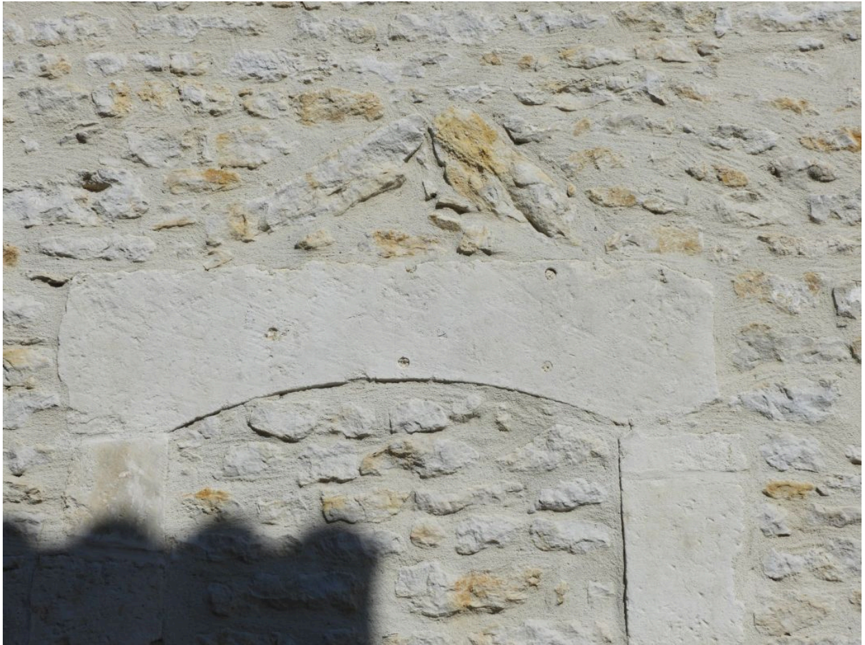
Ancienne ouverture murée, avec linteau en arc segmentaire et arc de décharge.