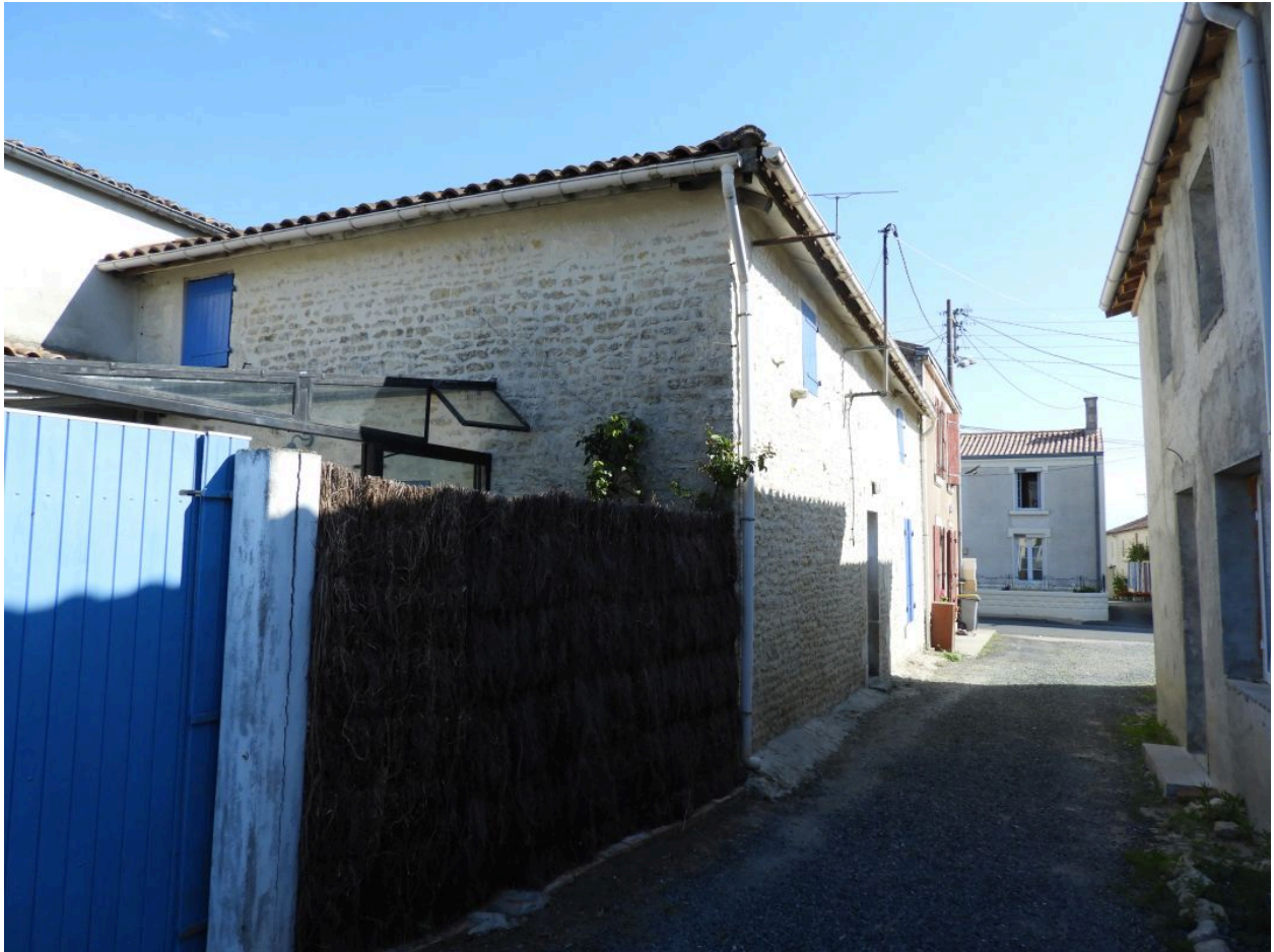
La maison vue depuis le sud.