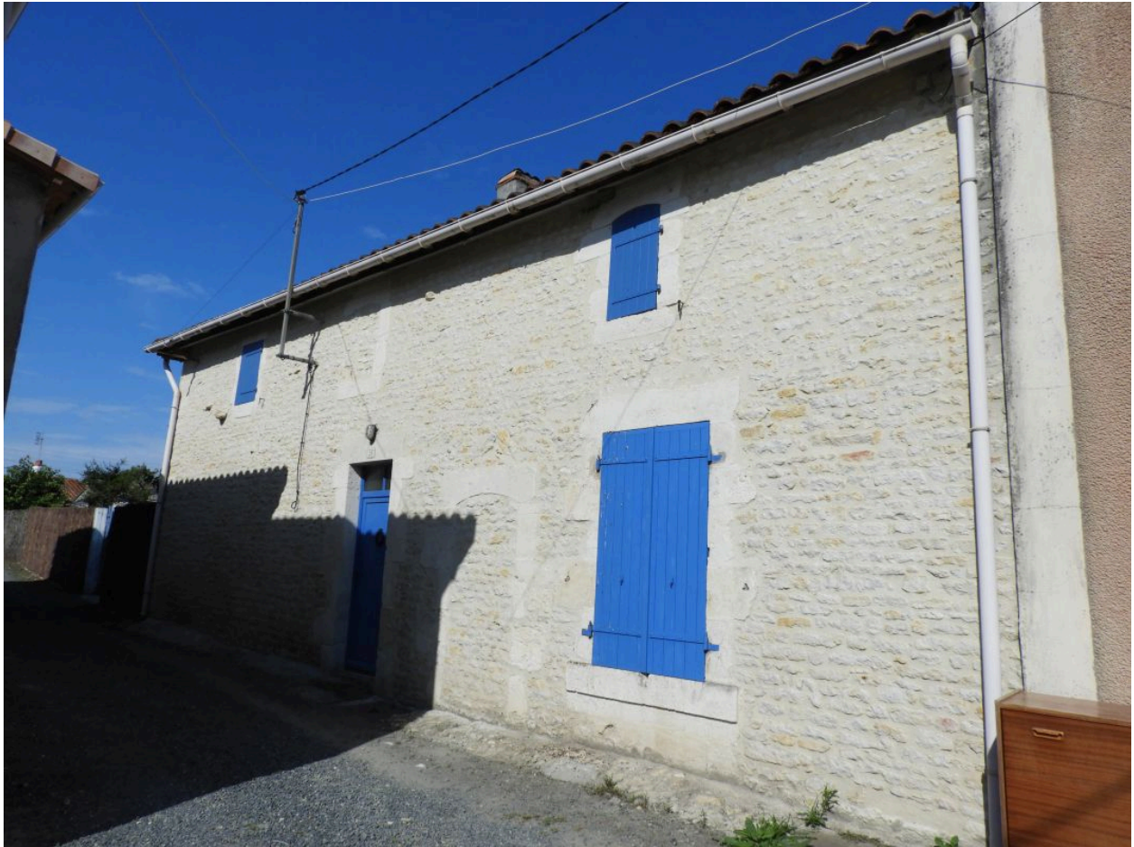
La maison vue depuis le nord-est.