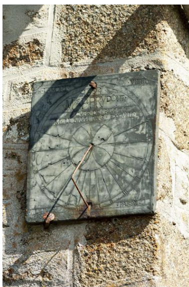
Cadran solaire, flanc sud de l'église.