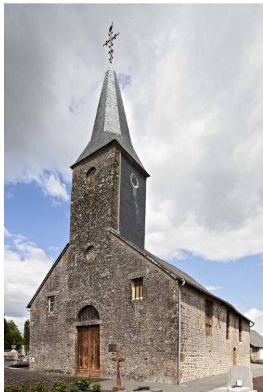
Façade occidentale de l'église de Rennes-en-Grenouilles. IVR52_20215300638NUCA