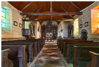
Nef de l'église de Rennes-en-Grenouilles.