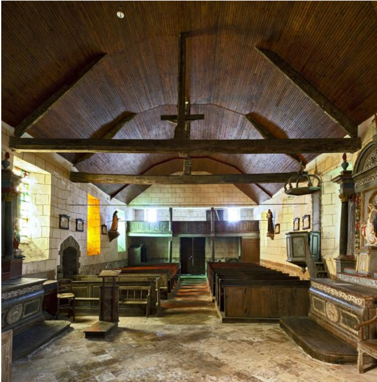
Nef vue depuis le chœur.