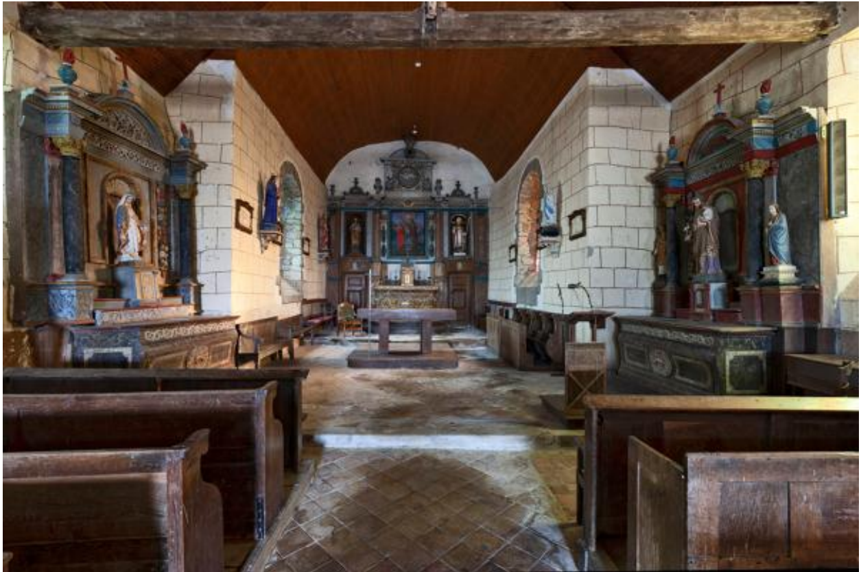
Nef et chœur.