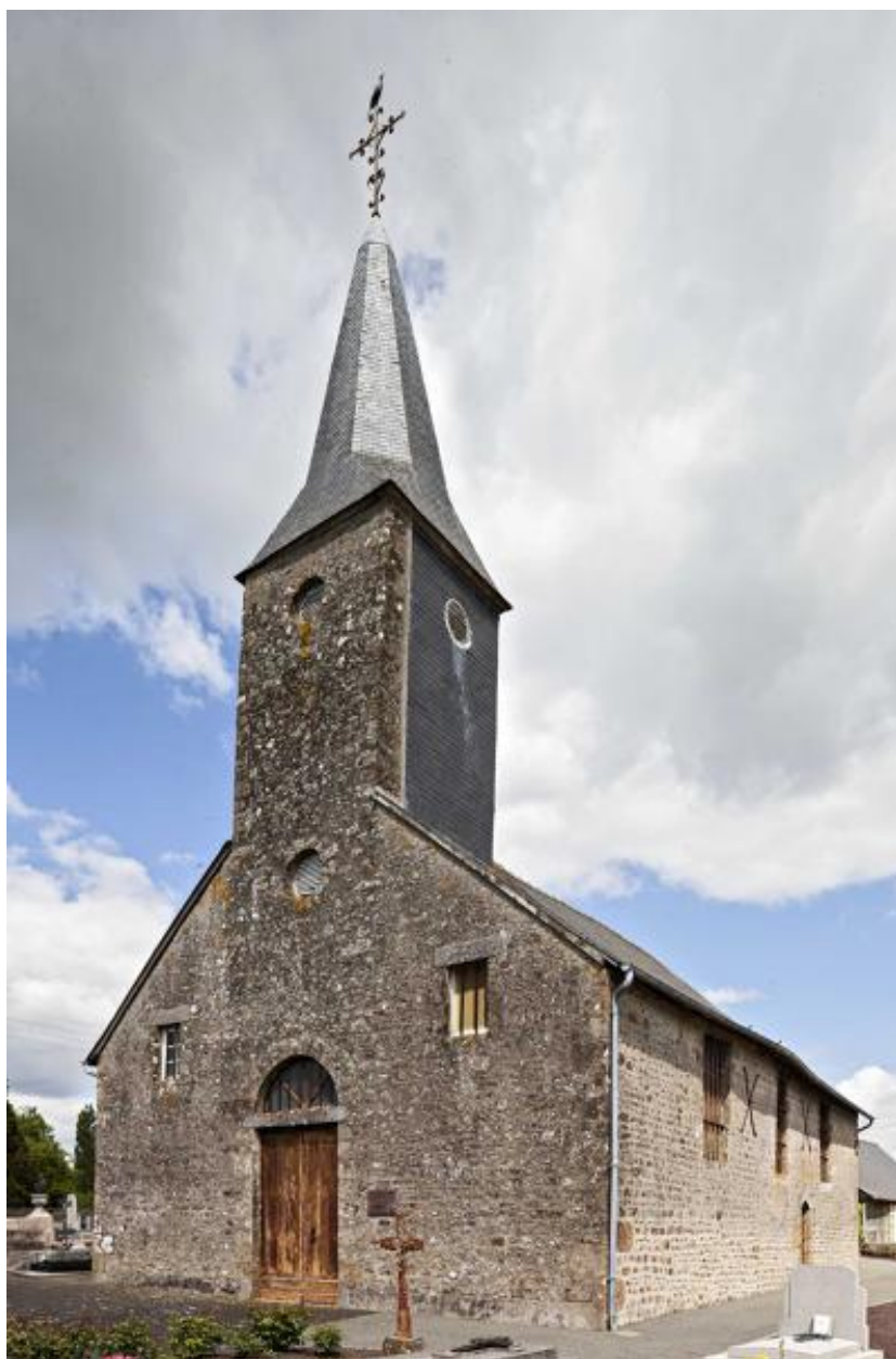
Façade occidentale de l'église de Rennes-en-Grenouilles.