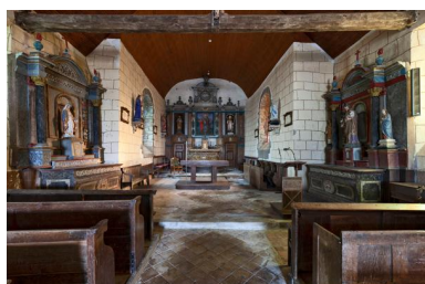
Nef et chœur.