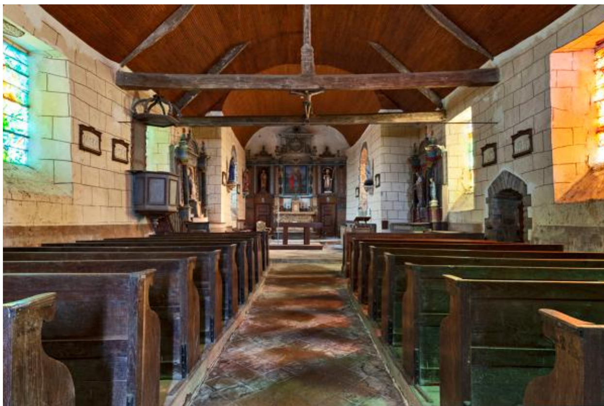
Nef de l'église de Rennes-en-Grenouilles.