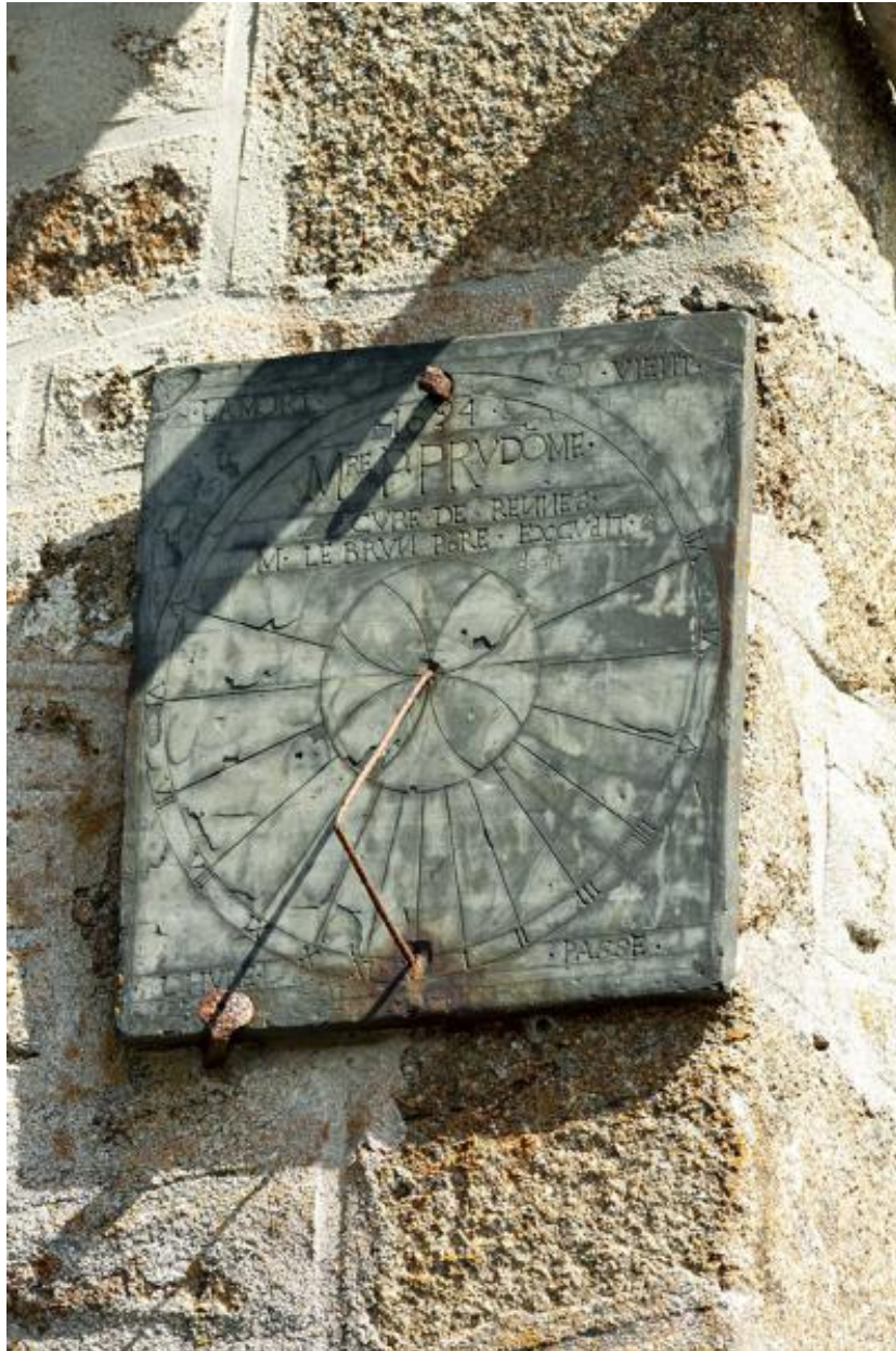
Cadran solaire, flanc sud de l'église.