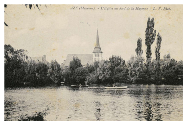
Le bourg d'Azé sur les bords de la Mayenne, carte postale du début du XXe siècle.