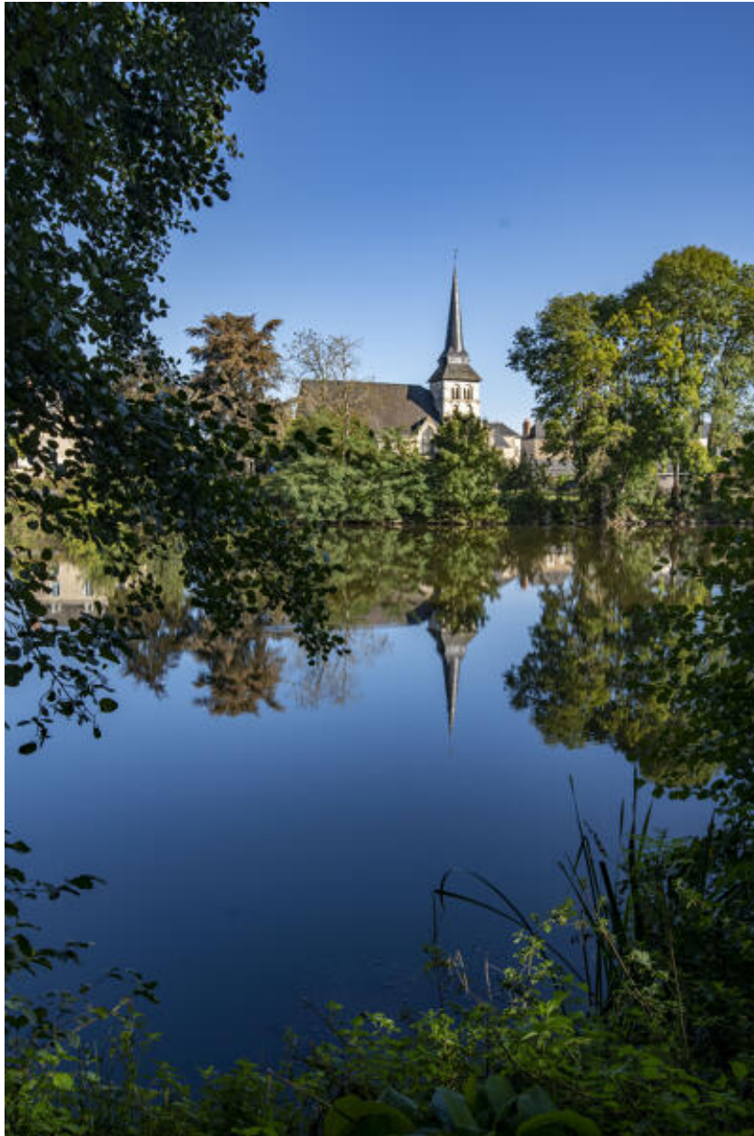
Le bourg depuis la rive opposée de la Mayenne.