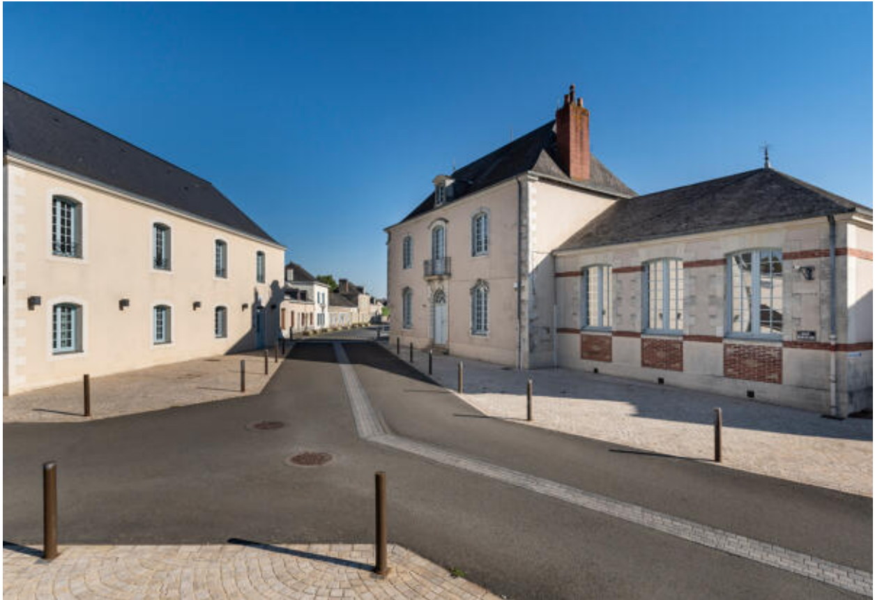
La rue principale du bourg.