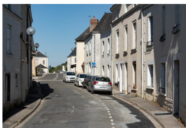
La rue principale du bourg.