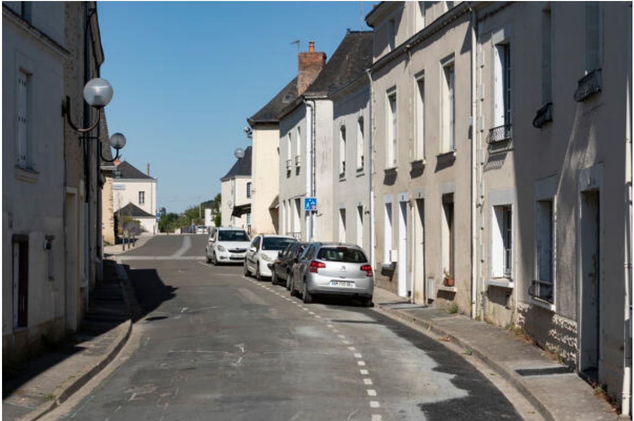
La rue principale du bourg.