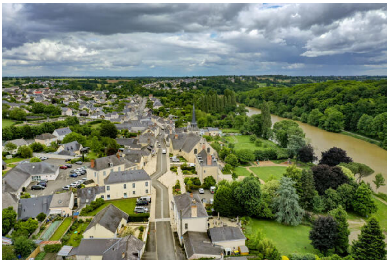
Une vue aérienne du bourg.