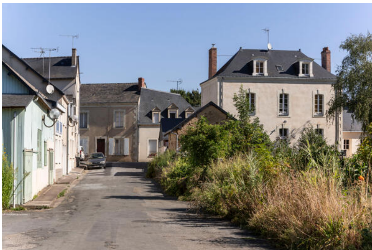
Une impasse menant à la Mayenne.