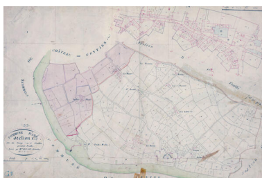
Le bourg d'Azé sur le plan cadastral de 1833. IVR52_20225301233NUCA