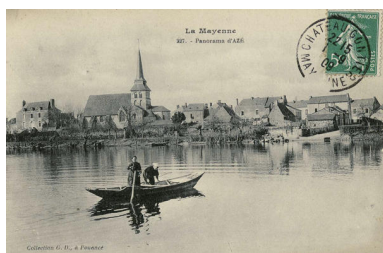
Le bourg d'Azé sur les bords de la Mayenne, carte postale du début du XXe siècle. IVR52_20215300033NUCA