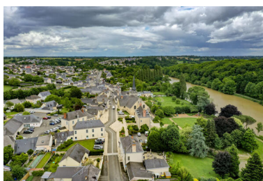
Une vue aérienne du bourg.