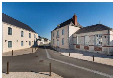
La rue principale du bourg.