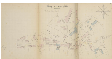
Le bourg d'Azé dessiné dans la monographie communale de 1899. IVR52_20225300907NUCA