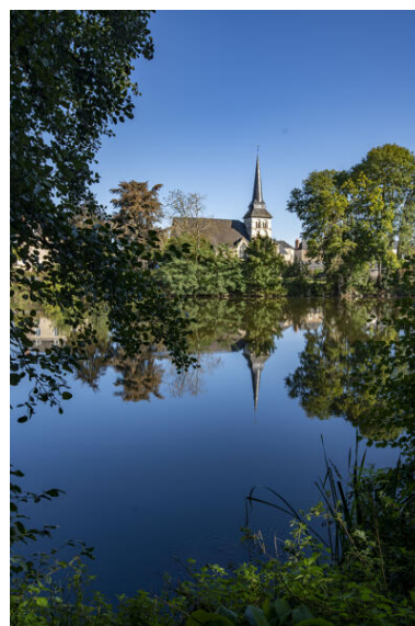
Le bourg depuis la rive opposée de la Mayenne.