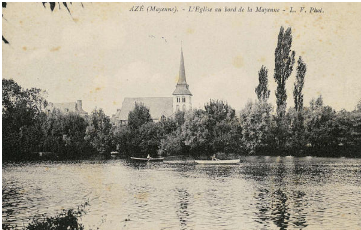
Le bourg d'Azé sur les bords de la Mayenne, carte postale du début du XXe siècle.