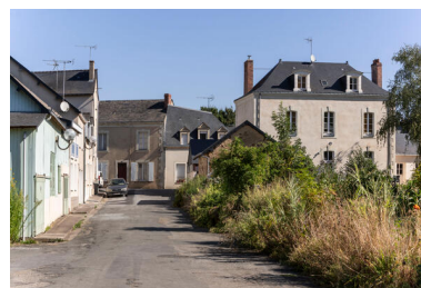
Une impasse menant à la Mayenne.