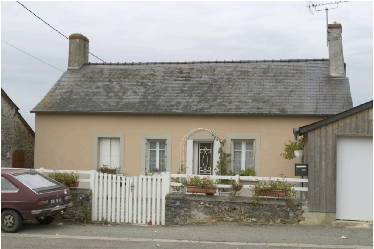
Vue depuis la route.