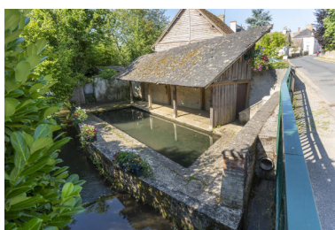
Vue d'ensemble du lavoir.