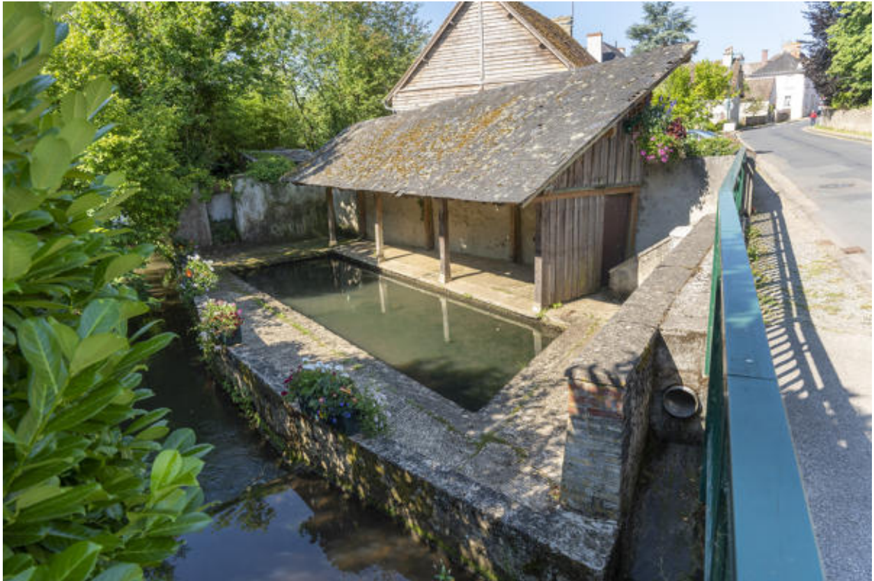
Vue d'ensemble du lavoir.