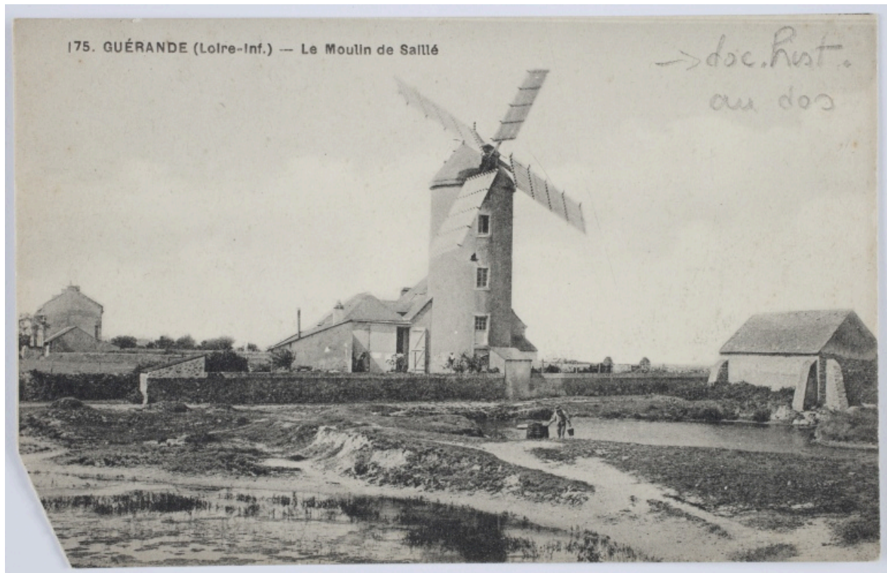
175 . GUÉRANDE (Loire-Inférieure) - Le moulin de Saillé. Le moulin équipé de ses ailes Berton.