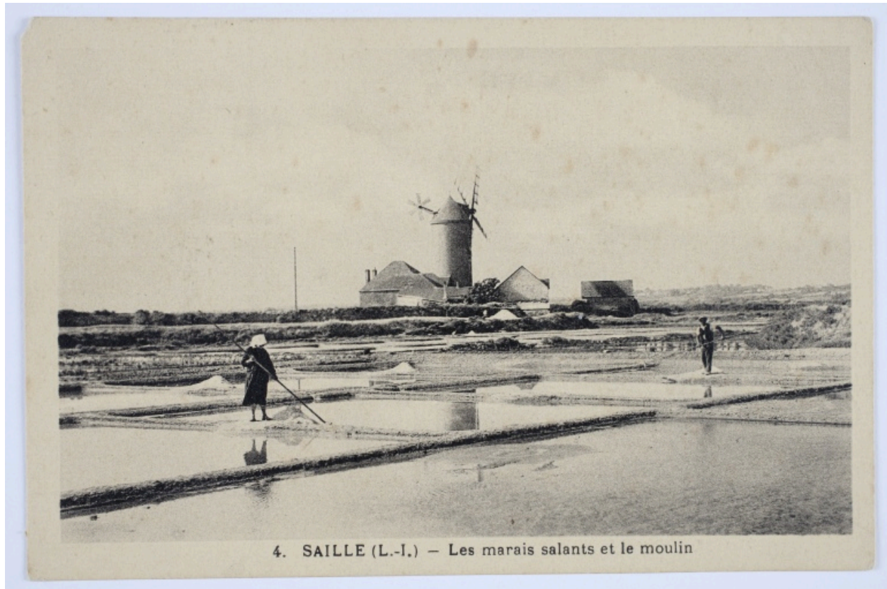
4. Saillé (Loire-Inférieure) - Les marais salants et le moulin. Vue lointaine du moulin, équipé de ses ailes Berton et de son moulinet d'orientation.