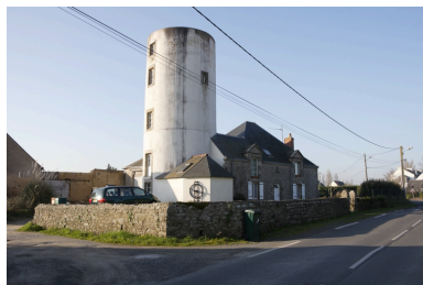
Vue d'ensemble du moulin et de la maison de meunier depuis le nord-ouest. IVR52_20084400206NUCA