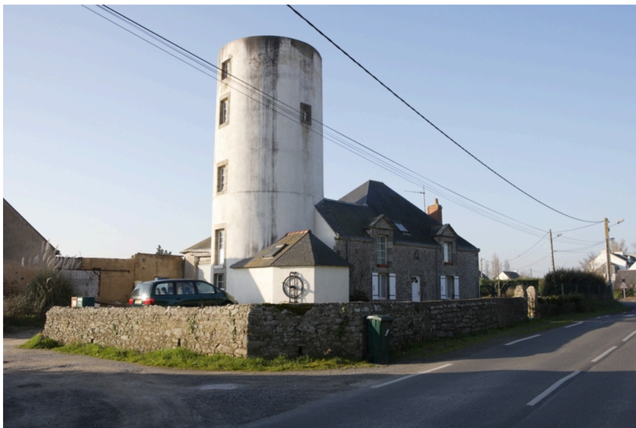
Vue d'ensemble du moulin et de la maison de meunier depuis le nord-ouest.