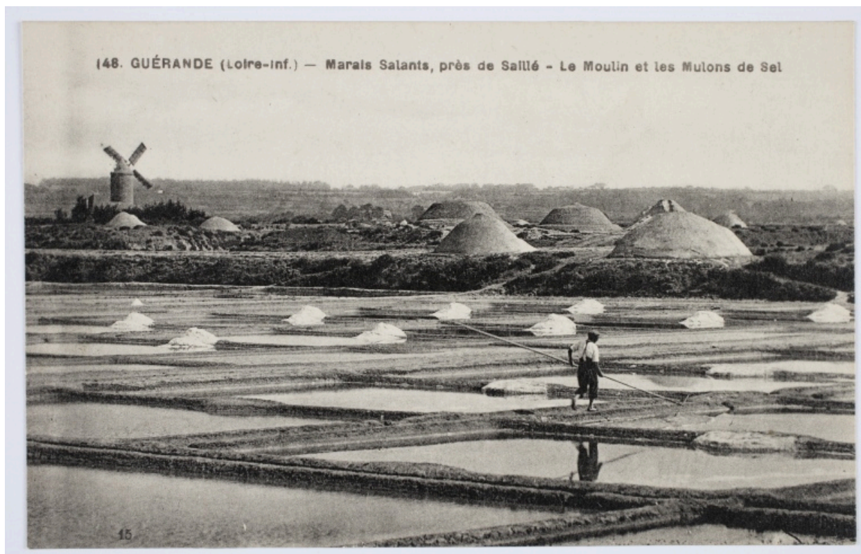
148. GUÉRANDE (Loire-Inférieure) - Marais salants, près de Saillé - Le moulin et les mulons de sel. Vue lointaine du moulin équipé de ses ailes Berton.