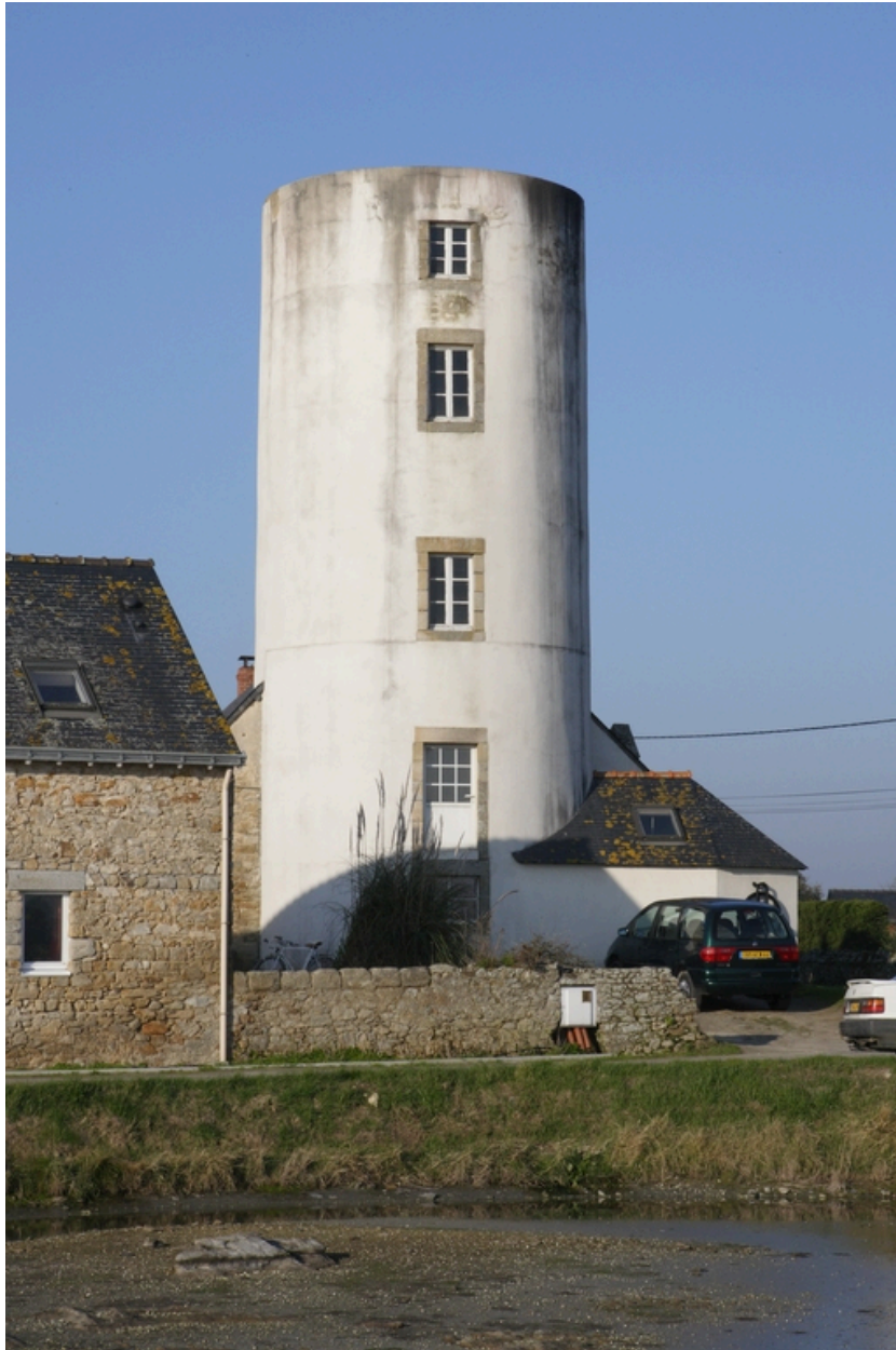
La tour du moulin. Vue prise depuis le nord-est.