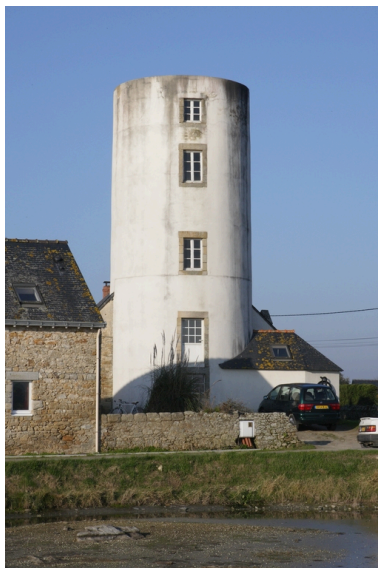
La tour du moulin. Vue prise depuis le nord-est. IVR52_20084400207NUCA