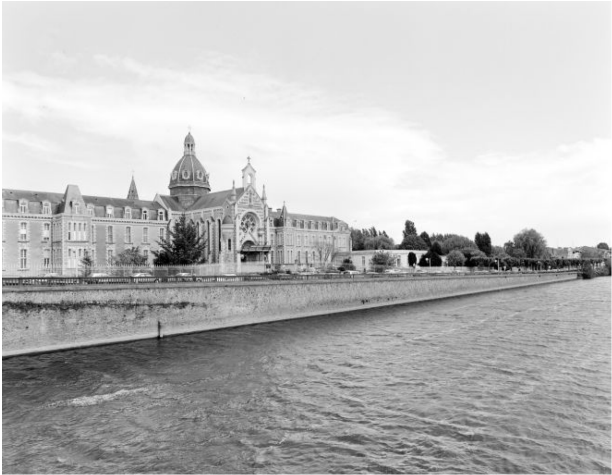
Le quai du docteur Lelièvre, sur la rive gauche, en aval du vieux pont, vus depuis ce pont. Au second plan, l'hopital.