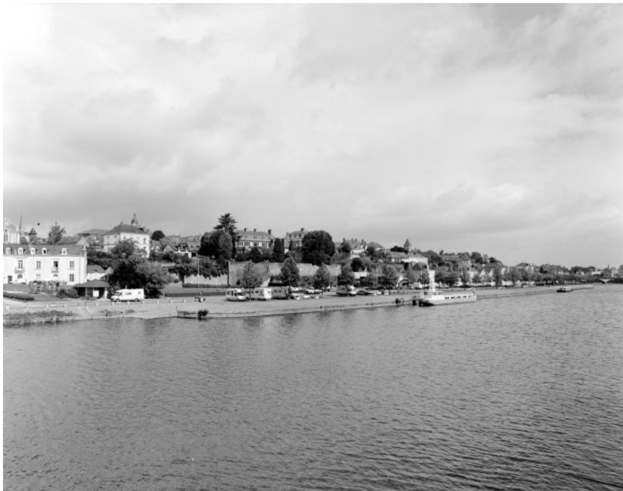
Le quai d'Alsace, sur la rive droite, et le port d'aval, vus depuis le pont de l'Europe. Au fond, le vieux pont.