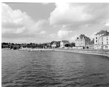
Le quai Pasteur et le port d'amont, sur la rive gauche, vus depuis le vieux pont.