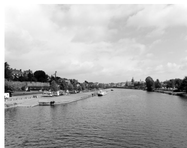
Le port d'aval, sur la rive droite, et, au second plan, le quai du docteur Lelièvre, sur la rive gauche, vus depuis le pont de l'Europe.