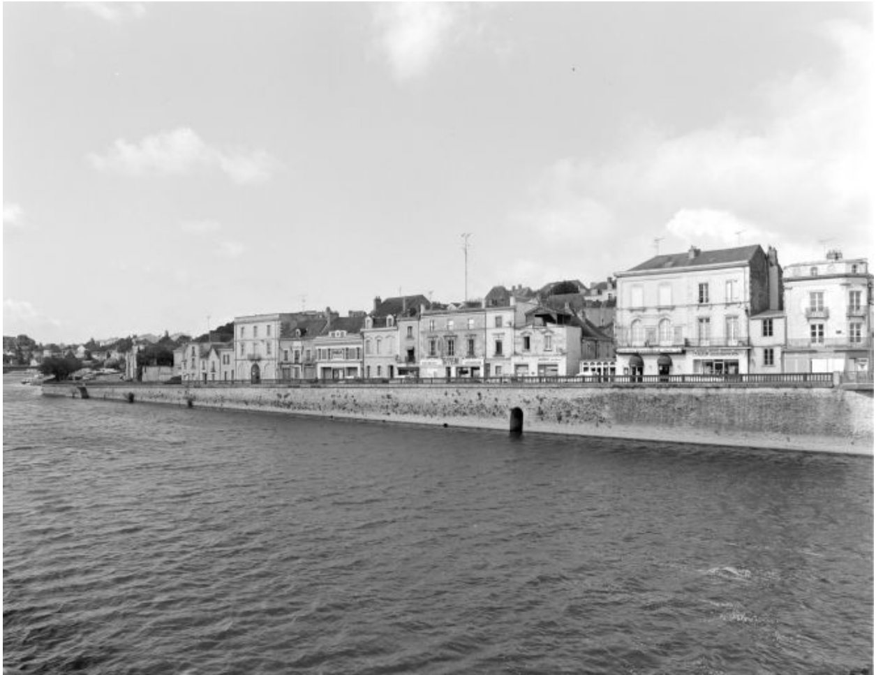
Le quai Charles de Gaulle, sur la rive droite, en aval du vieux pont, vu depuis ce pont. Au fond, le port d'aval.