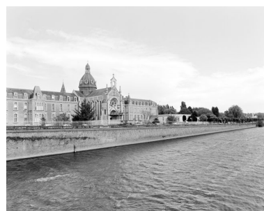
Le quai du docteur Lelièvre, sur la rive gauche, en aval