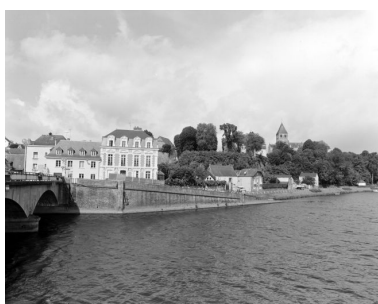
Le quai de Verdun, sur la rive droite, en amont du vieux pont, vu depuis la rive opposée.