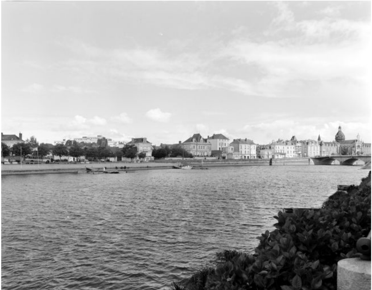
Le port d'amont et le quai Pasteur, sur la rive gauche en amont du vieux pont, vus depuis la rive opposée.