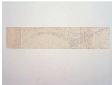
Plan d'ensemble : quais en amont du pont, déjà construits en 1869 ; quais d'aval en projet (réalisés).