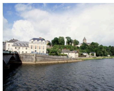
Le quai de Verdun, sur la rive droite, en amont du vieux pont, vu depuis la rive opposée.