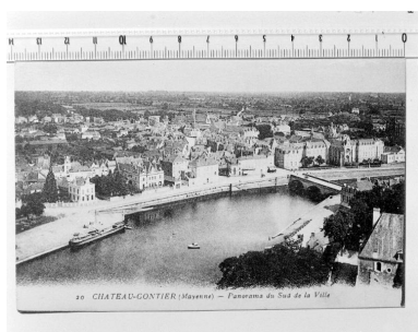
Vue d'ensemble de la rive gauche de la ville depuis la rive opposée, vers le nord (en amont de la rivière). IVR52_19745300749X