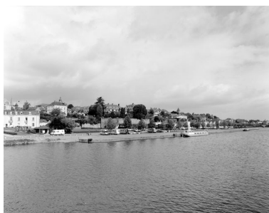
Le quai d'Alsace, sur la rive droite, et le port d'aval, vus depuis le pont de l'Europe. Au fond, le vieux pont. IVR52_20025300705X