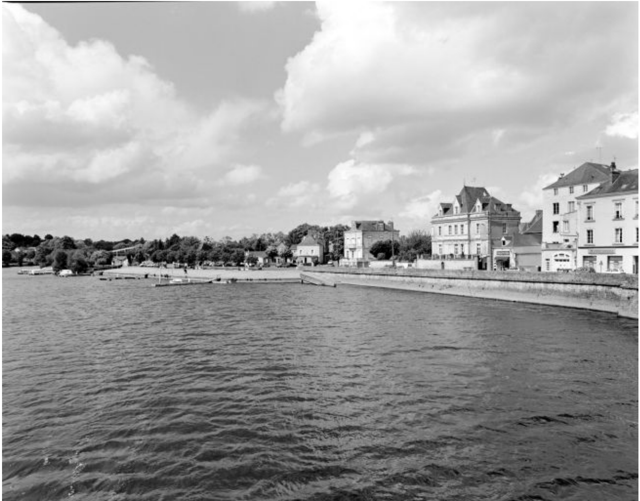
Le quai Pasteur et le port d'amont, sur la rive gauche, vus depuis le vieux pont.