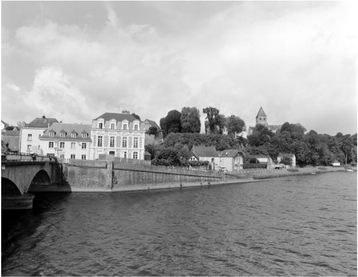
Le quai de Verdun, sur la rive droite, en amont du vieux pont, vu depuis la rive opposée.