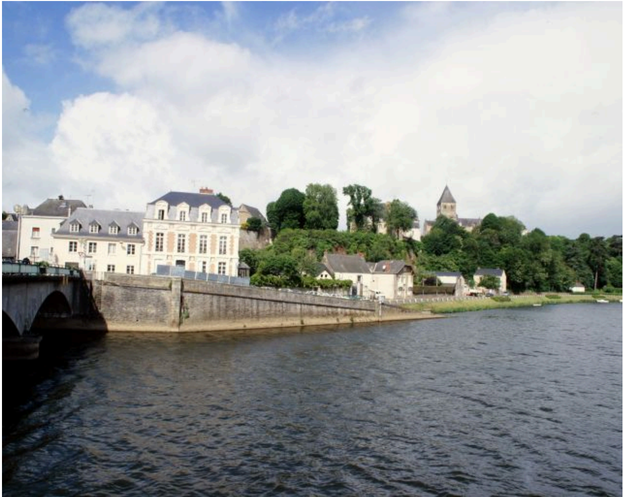
Le quai de Verdun, sur la rive droite, en amont du vieux pont, vu depuis la rive opposée.