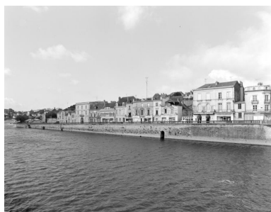
Le quai Charles de Gaulle, sur la rive droite, en aval du vieux pont, vu depuis ce pont. Au fond, le port d'aval.