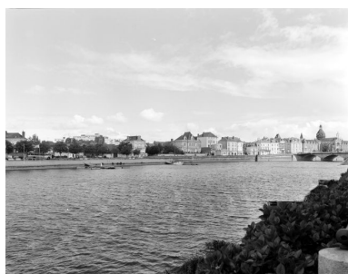
Le port d'amont et le quai Pasteur, sur la rive gauche en amont du vieux pont, vus depuis la rive opposée.