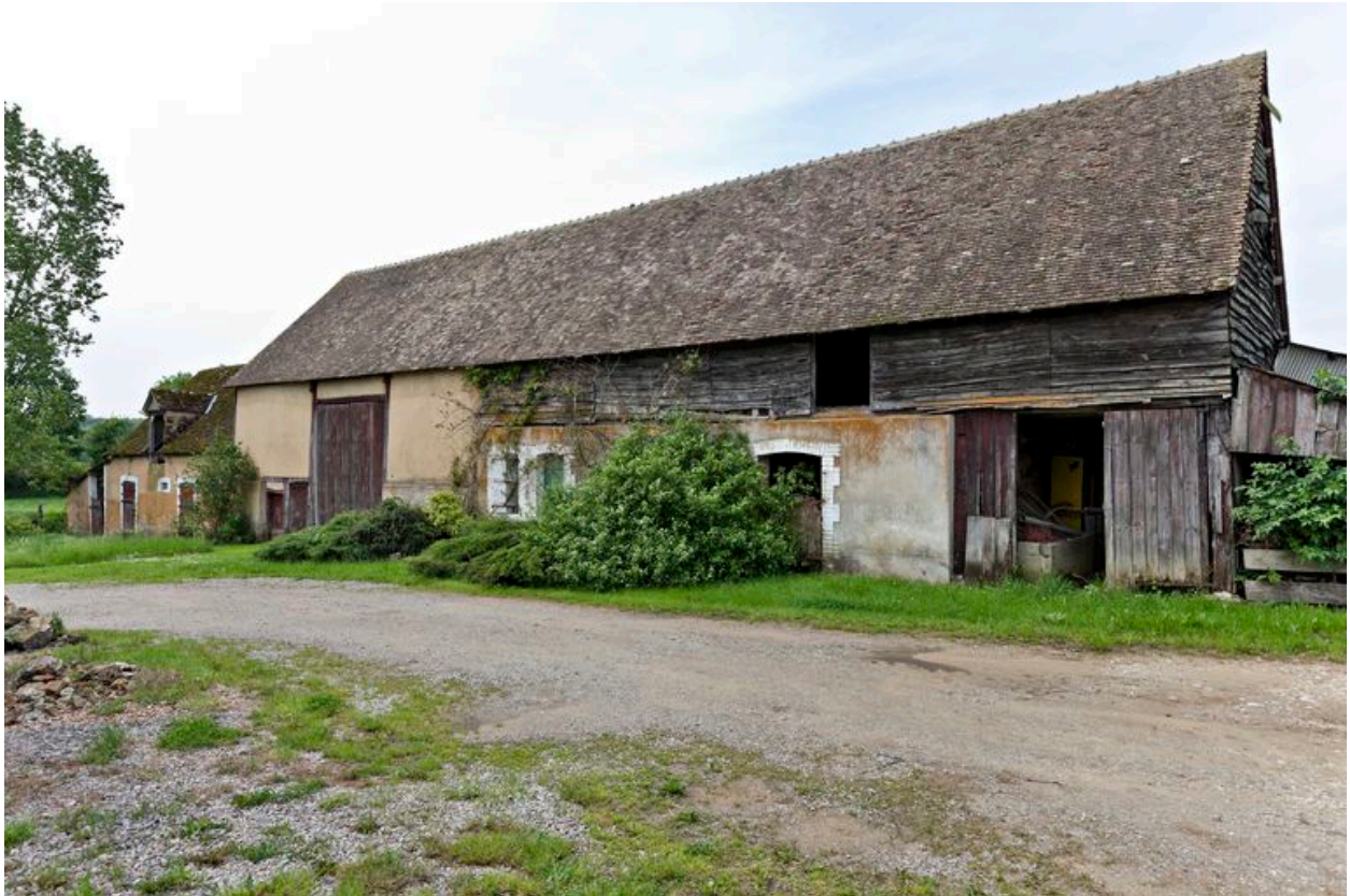
Grange-étables-logement-remise, élévation antérieure