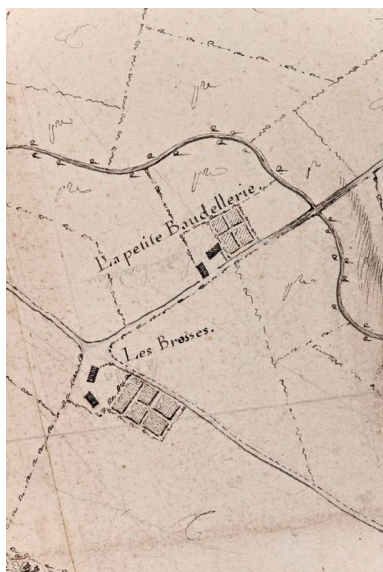
Plan vers 1747-1748 Autr. Jacques Oudry, IVR52_20127200612NUCAB