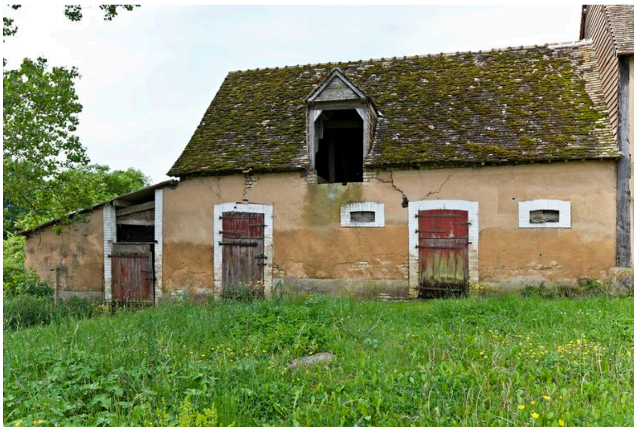
Elévation sur cour des étables en prolongement de la grange-étable