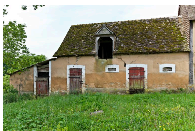
Elévation sur cour des étables en prolongement de la grange-étable IVR52_20127201218NUCA