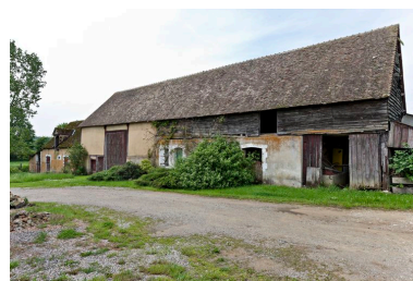
Grange-étables-logement- remise, élévation antérieure IVR52_20127201217NUCA