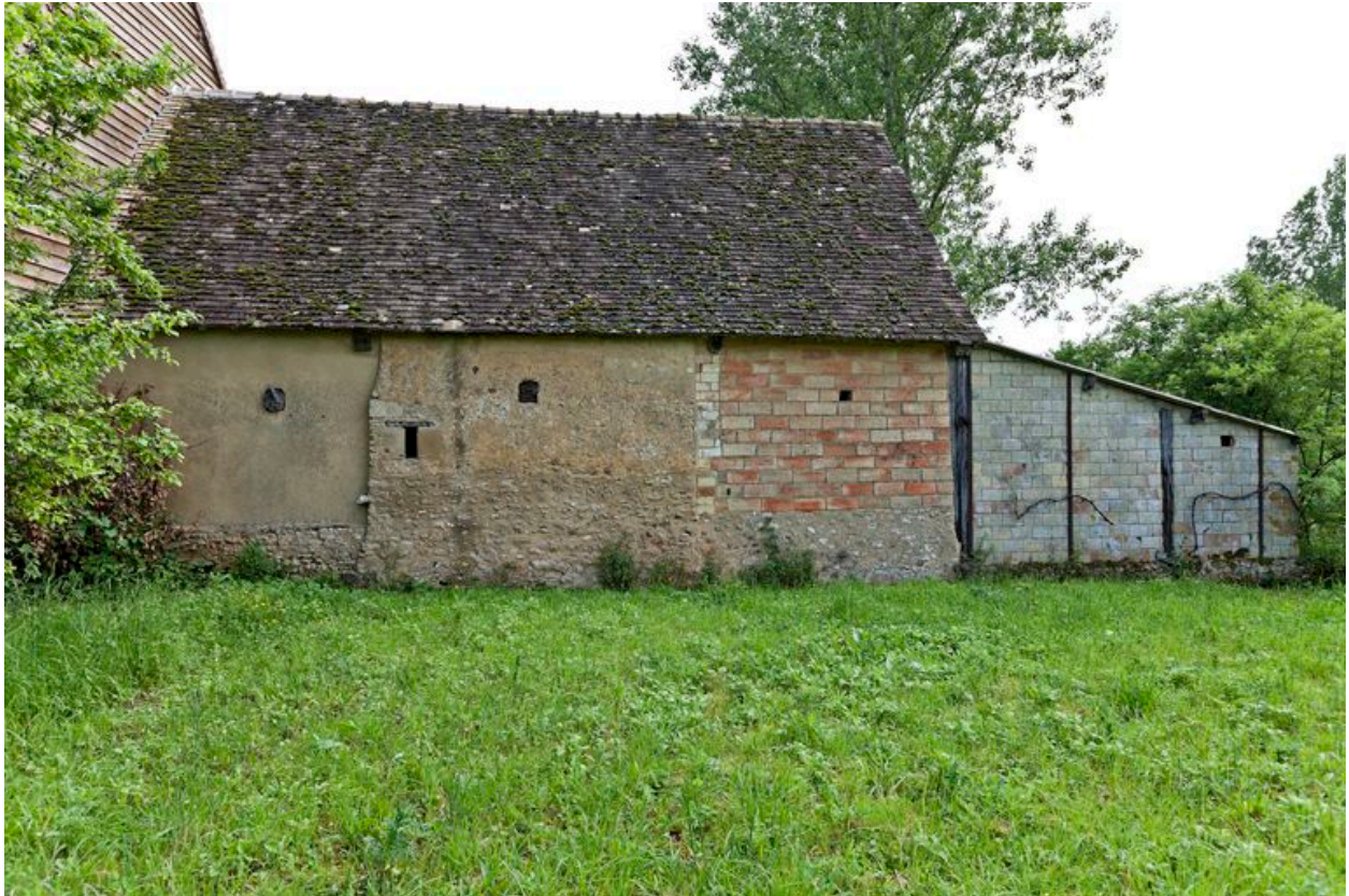
Elevation postérieure des étables en prolongement