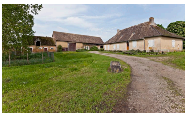
Vue générale IVR52_20127200032NUCAB