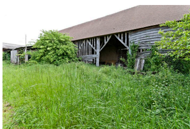
Elevation postérieure de la grange-étable