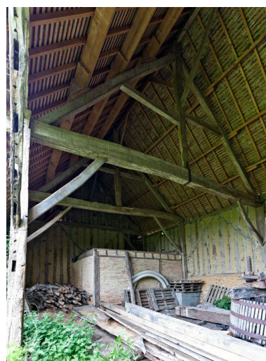
Intérieur de la grange-étable et le logement en briques IVR52_20127201214NUCA