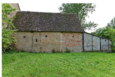
Elevation postérieure des étables en prolongement