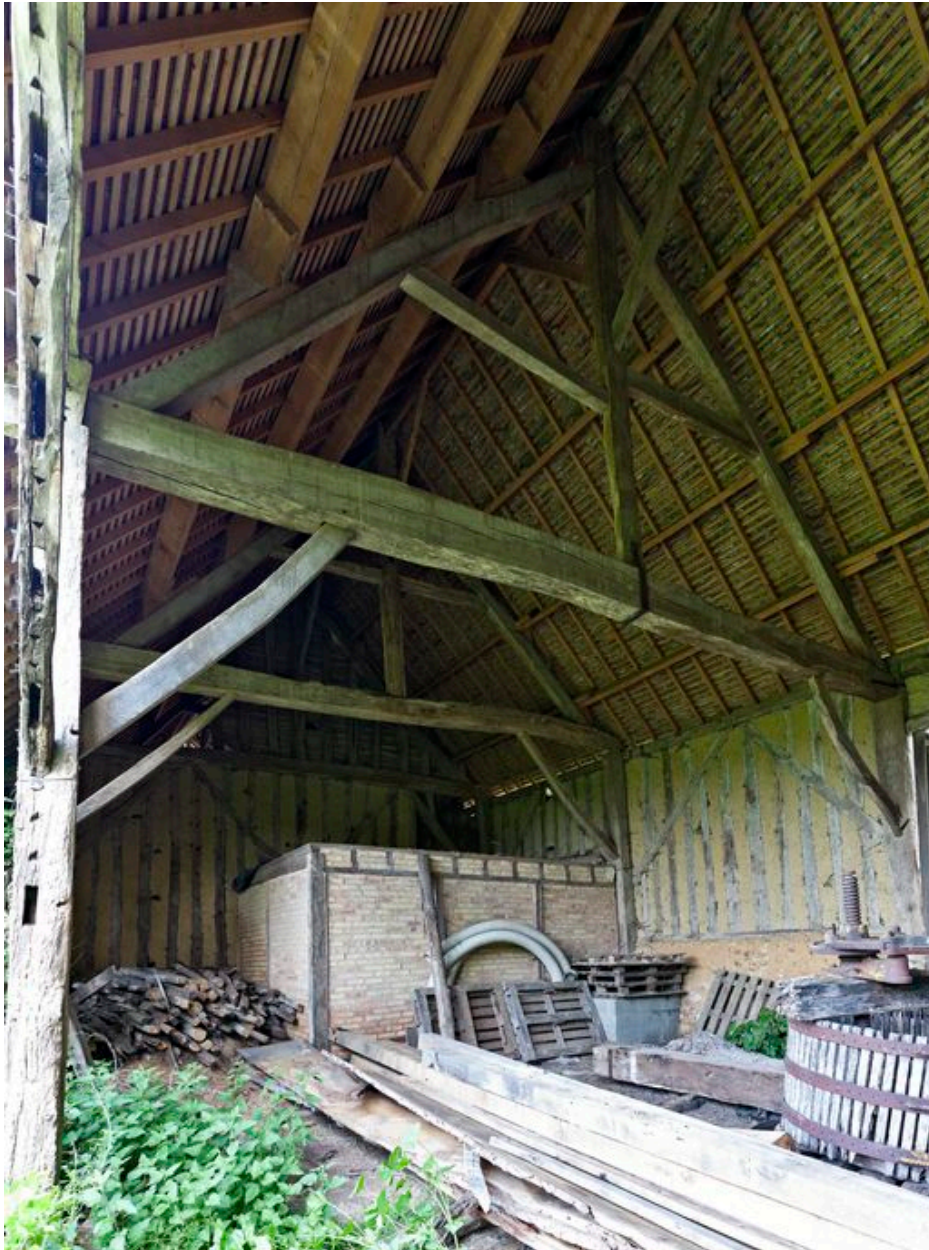
Intérieur de la grange-étable et le logement en briques