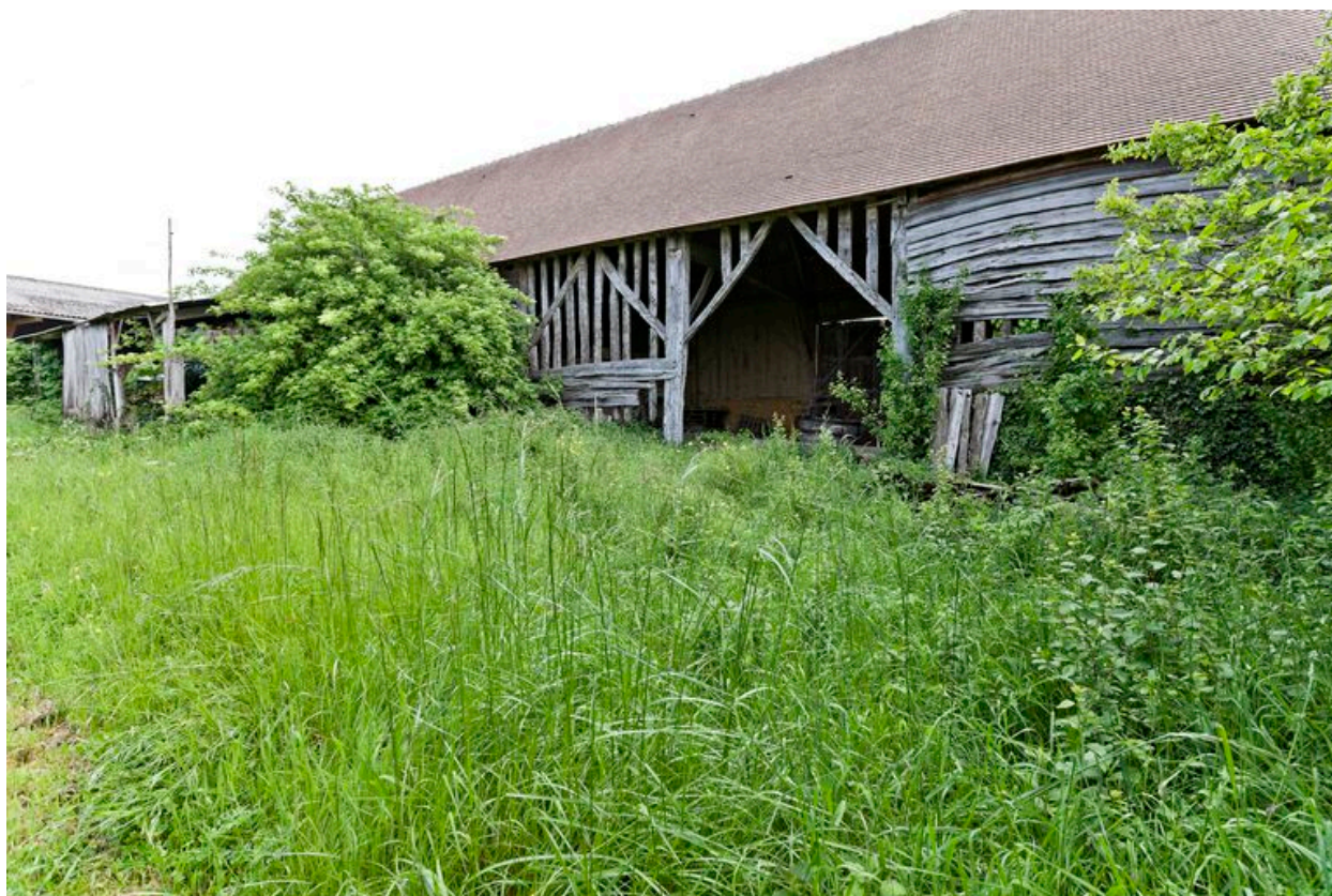
Elevation postérieure de la grange-étable