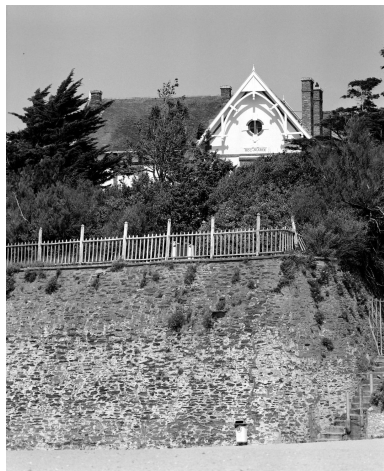
Vue de la villa depuis la plage.