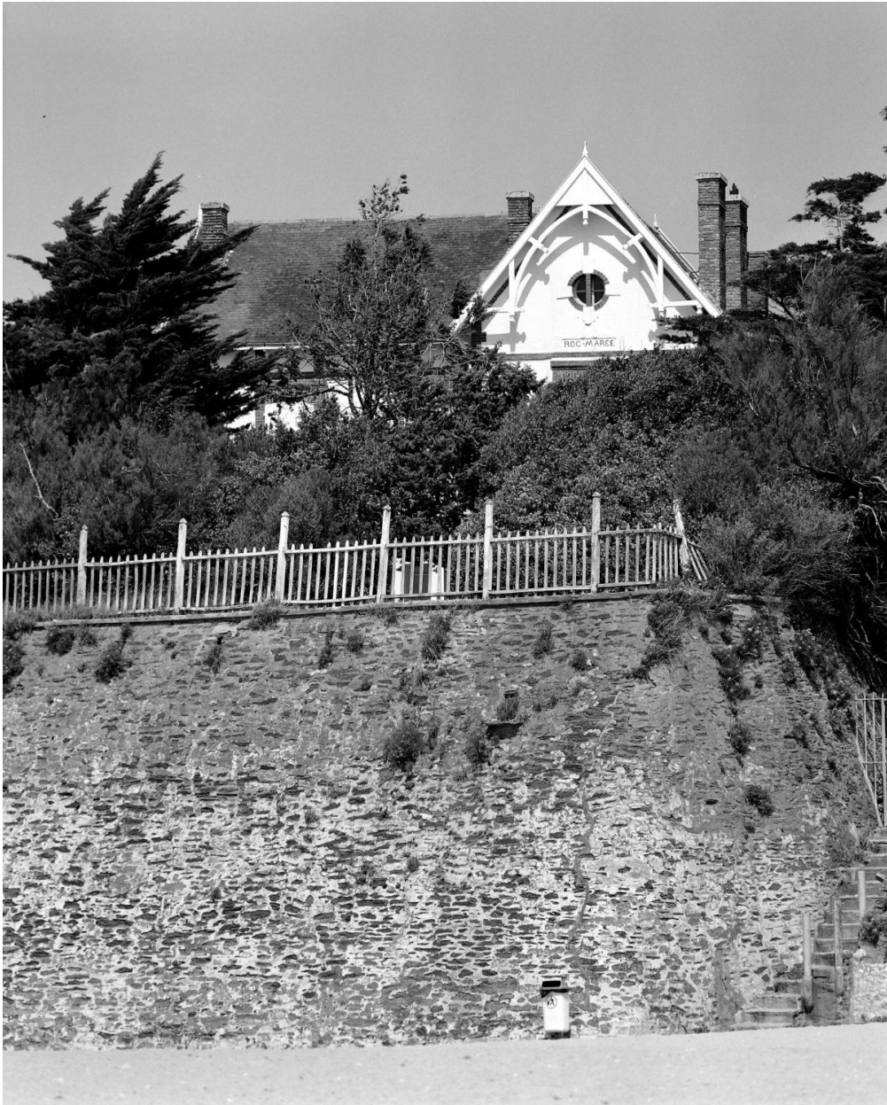
Vue de la villa depuis la plage.