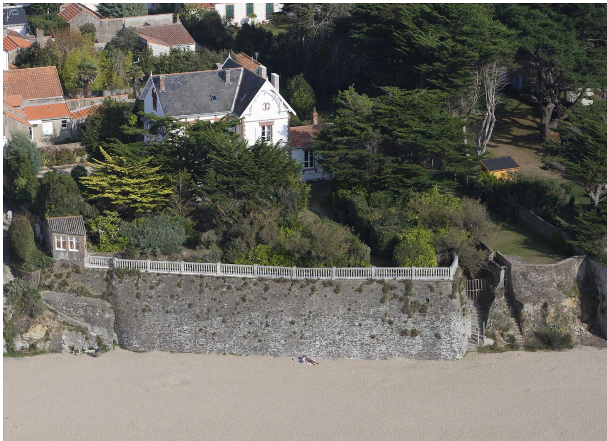
Vue aérienne de la villa.