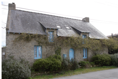
Vue d'ensemble de la rangée. IVR52_20084400476NUCA