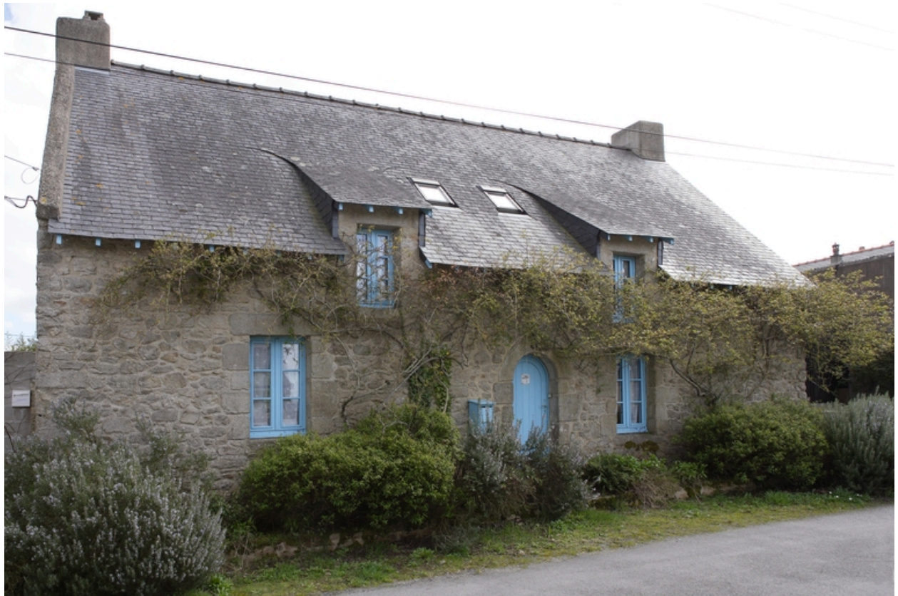
Vue d'ensemble de la rangée.