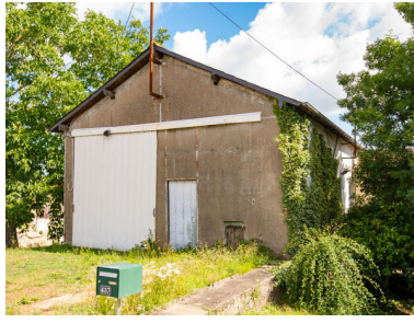
Garage au 437 route du Château de la Cour. IVR52_20234400170NUCA