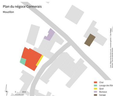
Plan du négoce Cormerais IVR52_20234400535NUDA