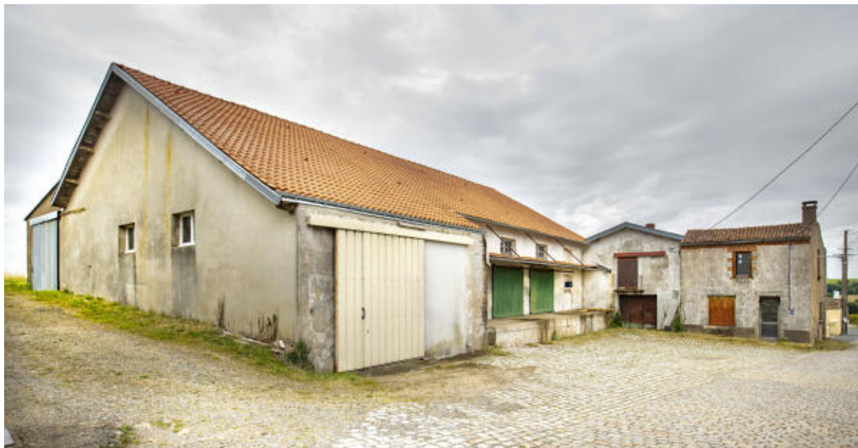
Façade et quai du magasin ; à gauche, accès au local de lavage des fûts.