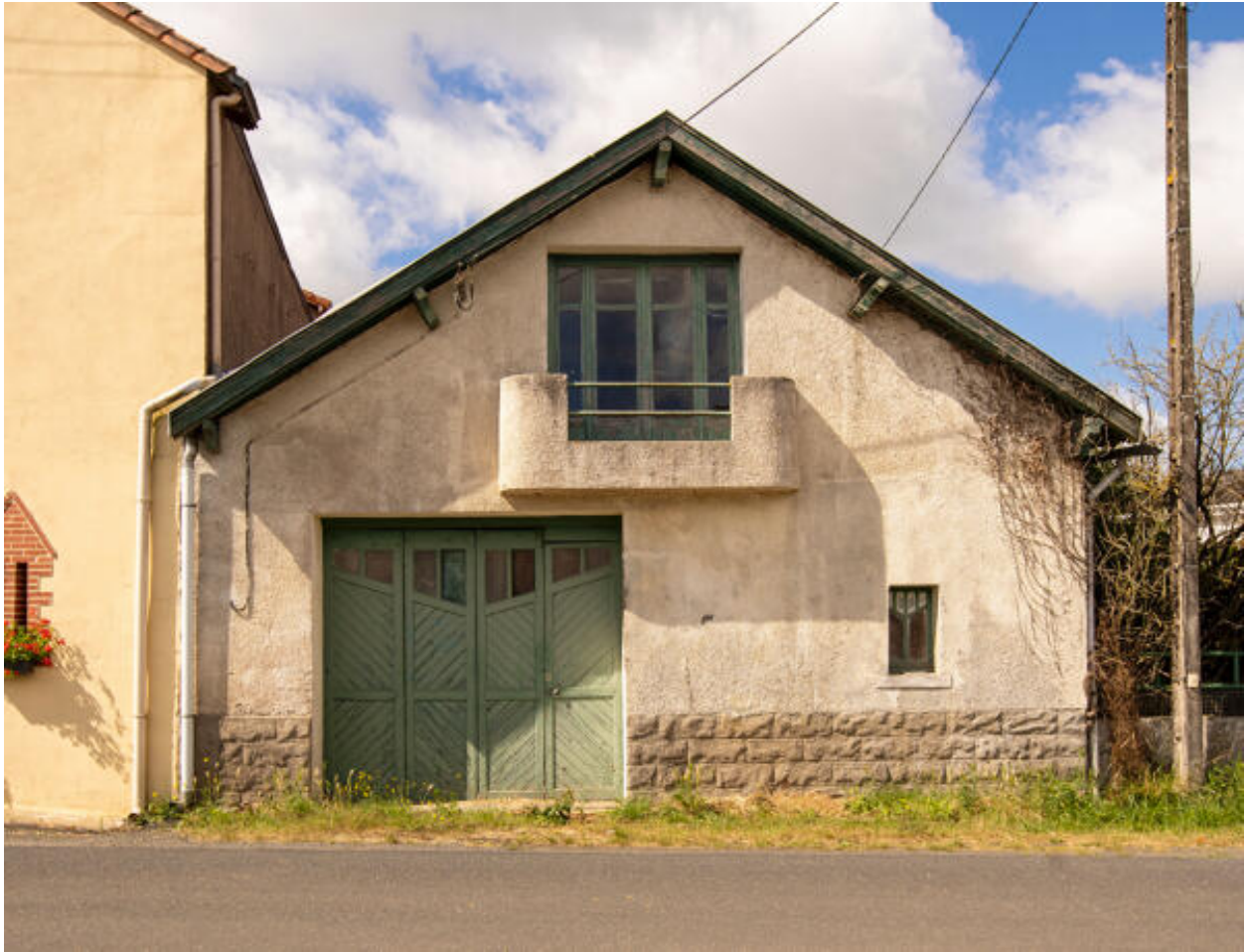
Bâtiment de bureaux.