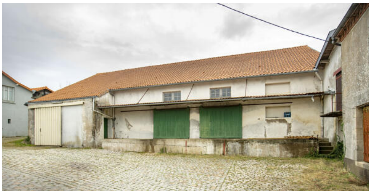
Façade et quai du magasin