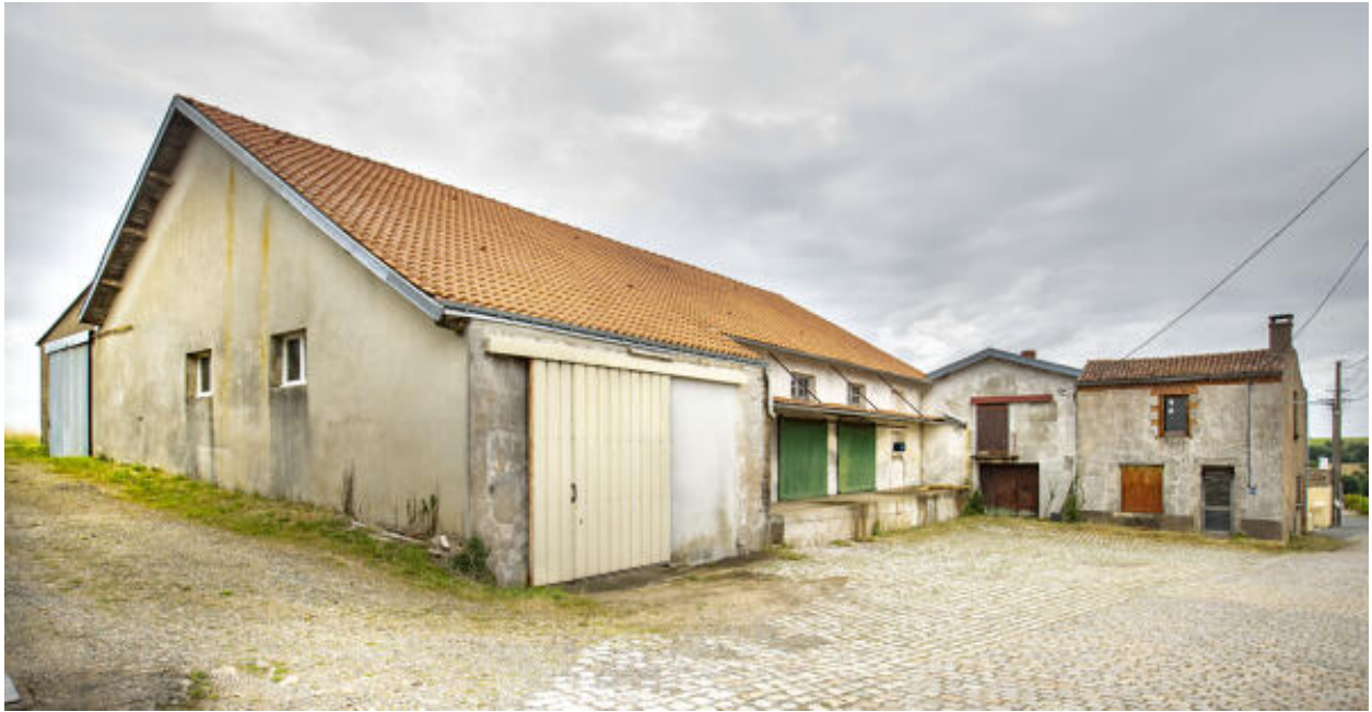
Façade et quai du magasin ; à gauche, accès au local de lavage des fûts.