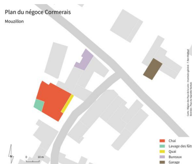
Plan du négoce Cormerais