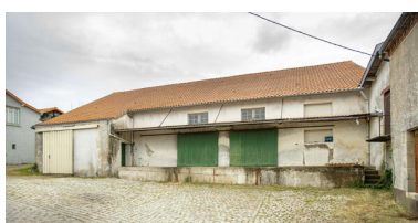
Façade et quai du magasin IVR52_20224400258NUCA