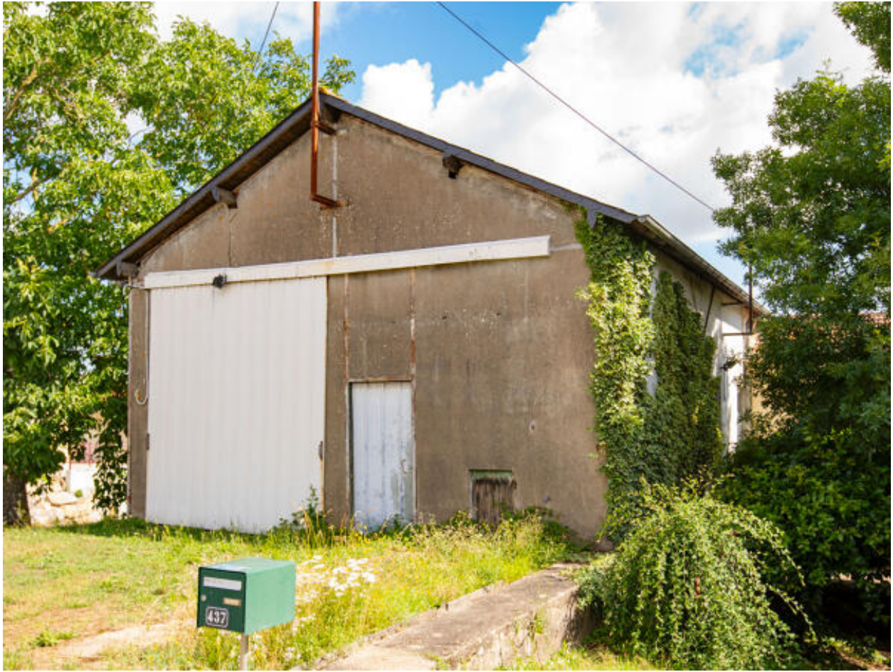
Garage au 437 route du Château de la Cour.