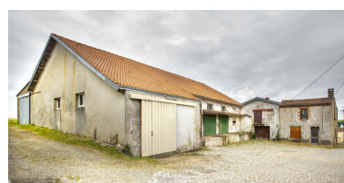
Façade et quai du magasin ; à gauche, accès au local de lavage des fûts. IVR52_20224400259NUCA