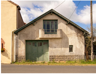
Bâtiment de bureaux.