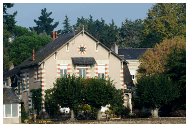
Vue de la façade est. IVR52_20134901524NUCA