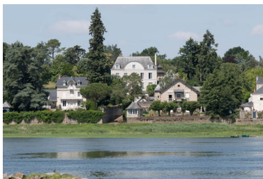
Vue d'ensemble depuis la rive gauche.