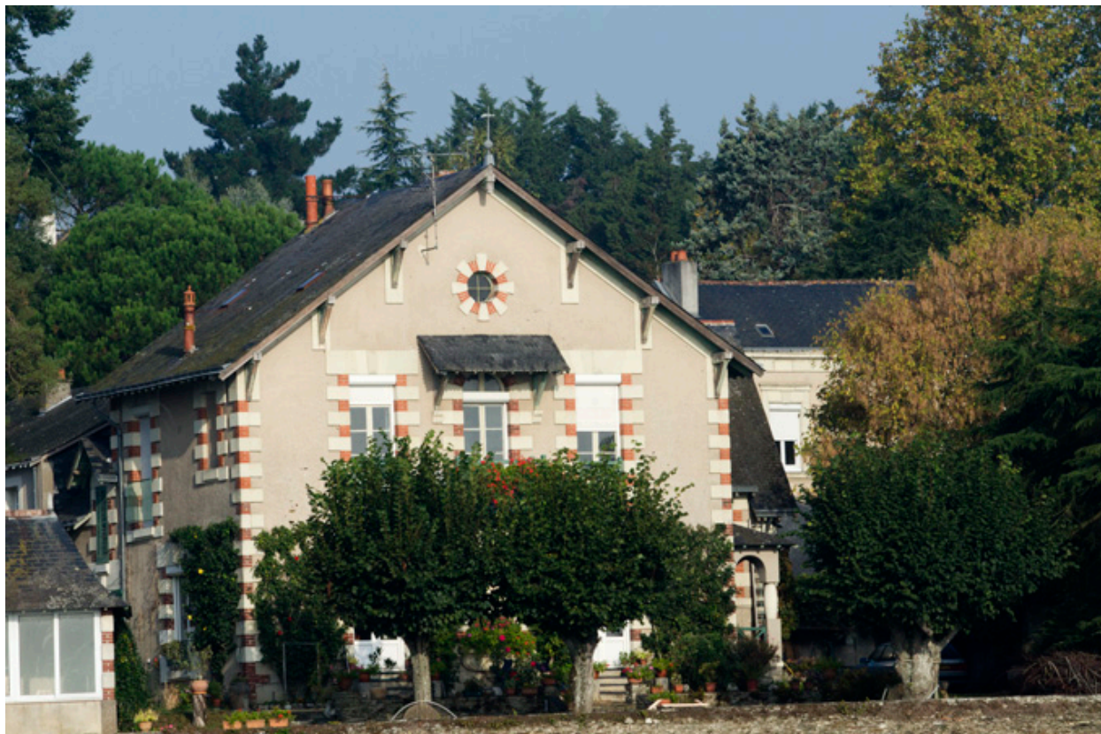
Vue de la façade est.