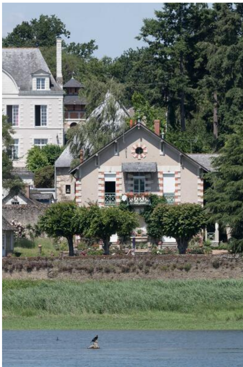
Vue d'ensemble depuis la rive gauche.