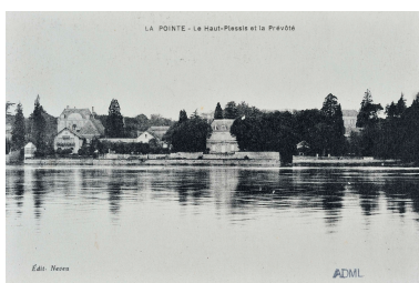
Vue de la maison au 17 rue des Saulniers. Façade sur la Loire. Carte postale. 1er quart 20e siècle. IVR52_20174900516NUCA