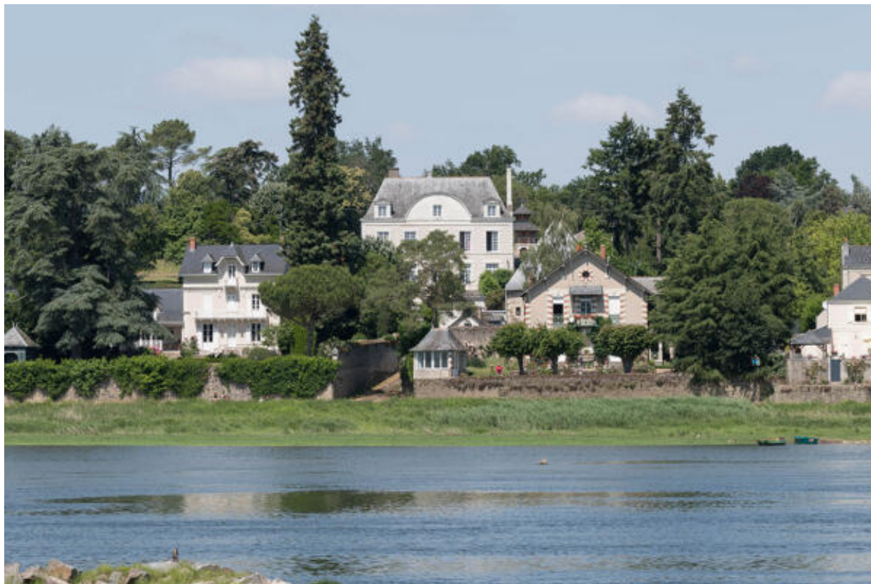
Vue d'ensemble depuis la rive gauche.