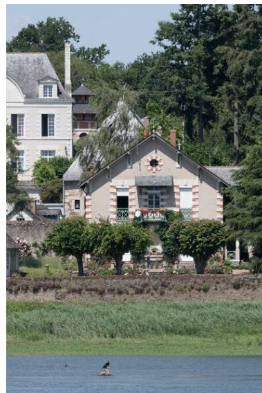
Vue d'ensemble depuis la rive gauche.