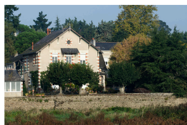
Vue d'ensemble depuis l'est. IVR52_20134901525NUCA