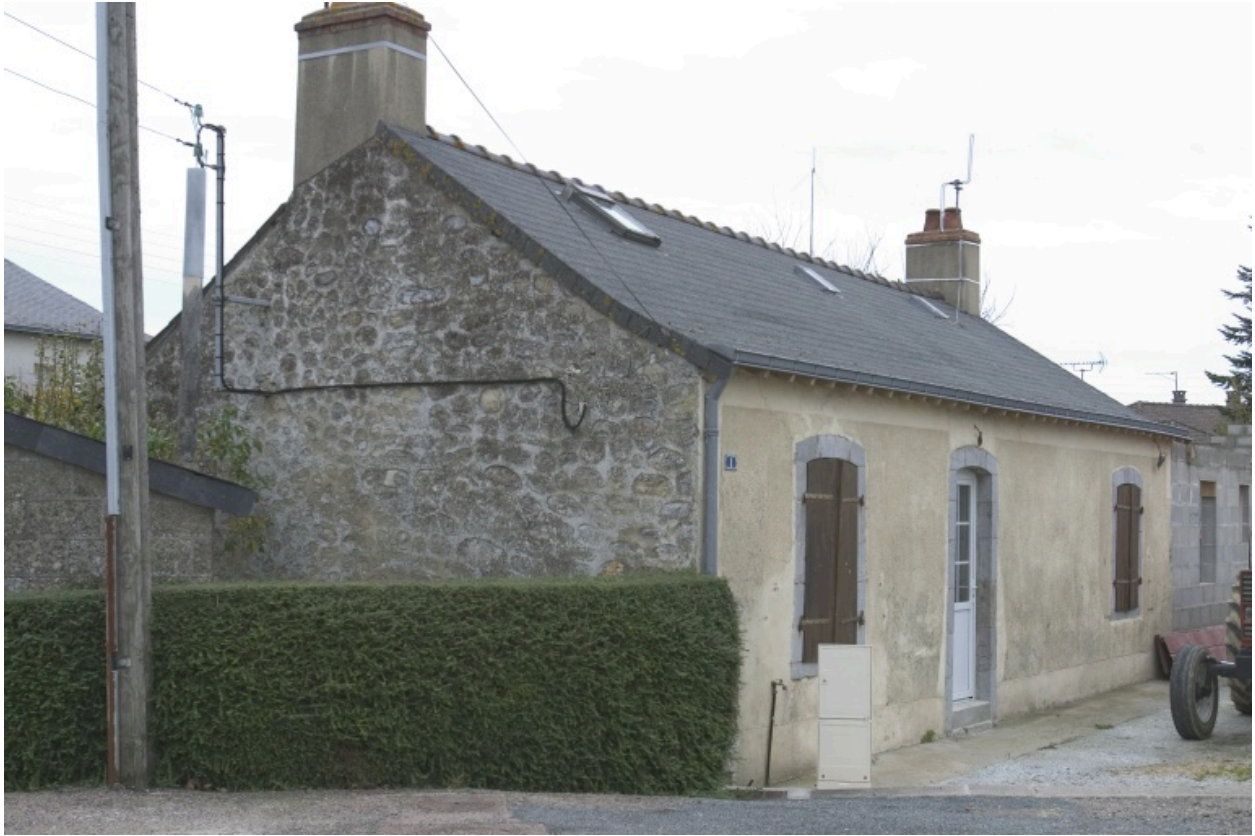
Vue depuis la route.