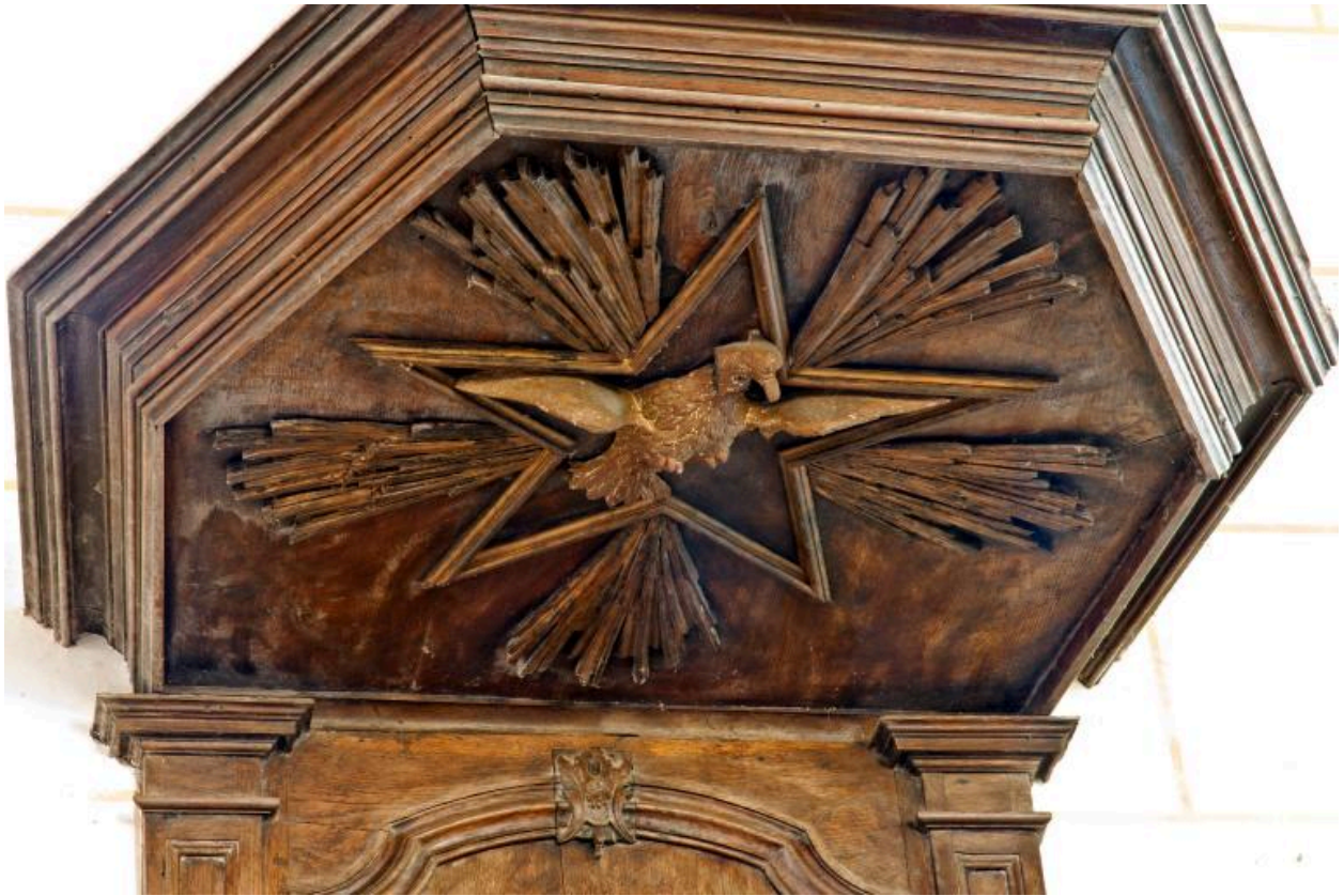
Chaire à prêcher, détail.