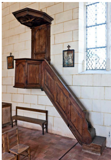
Chaire à prêcher : vue générale. IVR52_20117201533NUCA