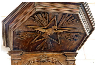
Chaire à prêcher, détail. IVR52_20117201538NUCA