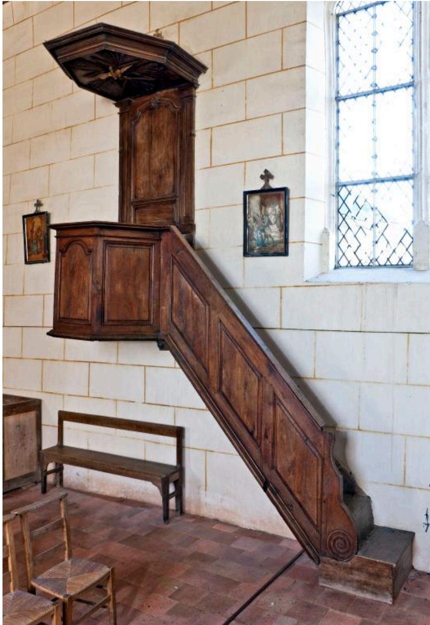
Chaire à prêcher : vue générale.