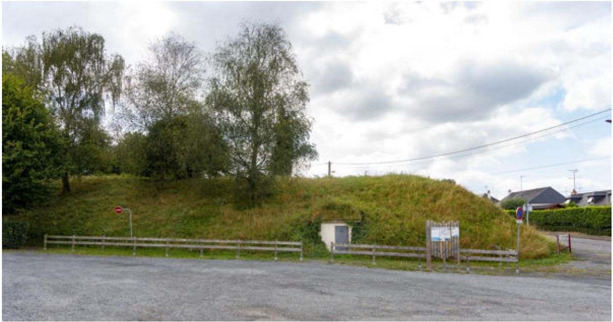
Le rempart gaulois ceinturant le bourg.