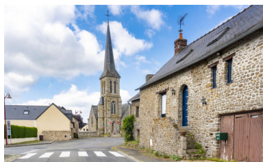
Le centre-bourg et l'église.