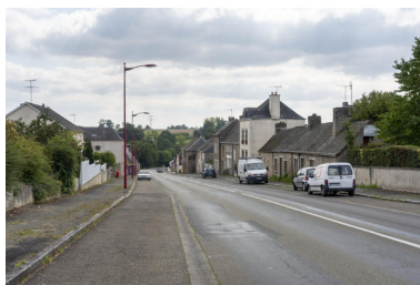
Les Ormeaux et l'ancienne route nationale. IVR52_20215301191NUCA