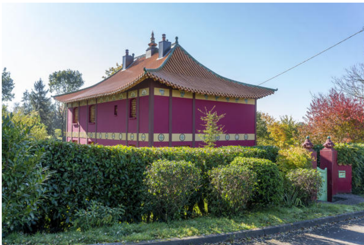
La "maison chinoise".