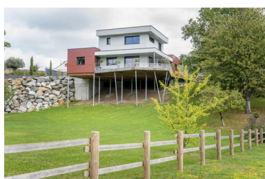
Une maison contemporaine sur pilotis à Beau-Rivage.