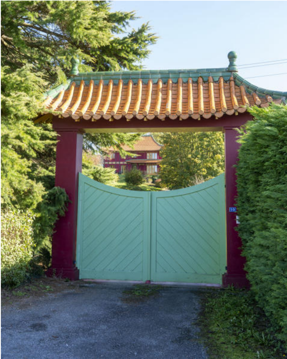
Le portail de la "maison chinoise".