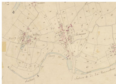
Le bourg et les Ormeaux sur le plan cadastral napoléonien de 1827.