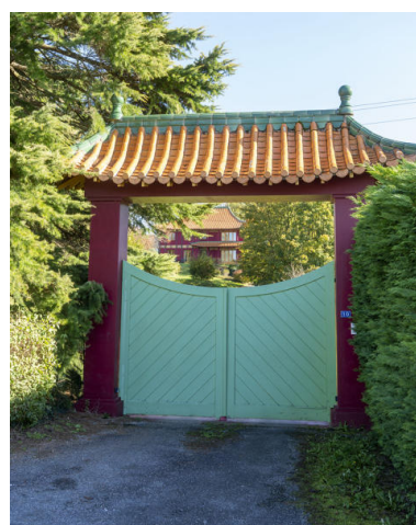
Le portail de la "maison chinoise".