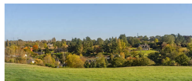
Les maisons de Beau-Rivage depuis le coteau opposé.