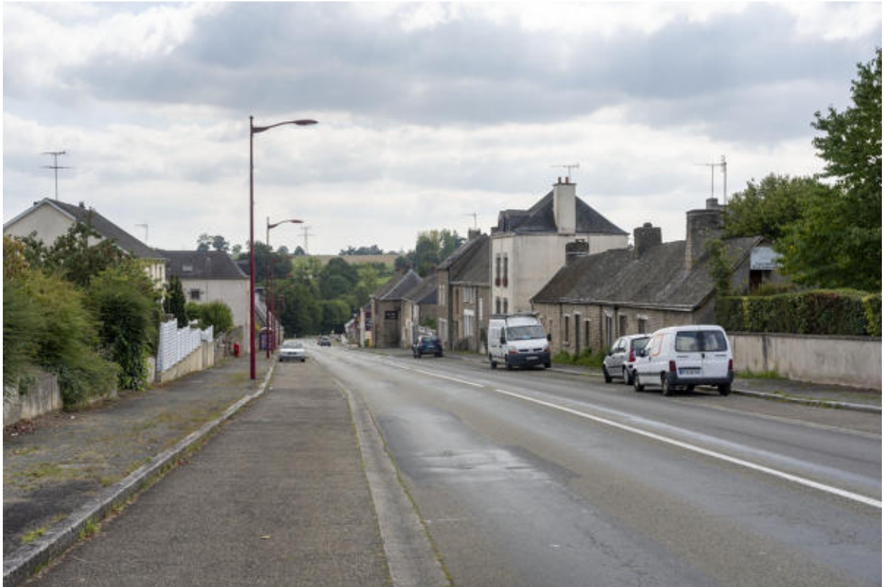
Les Ormeaux et l'ancienne route nationale.