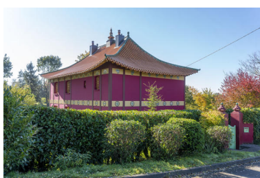
La "maison chinoise". IVR52_20215301702NUCA