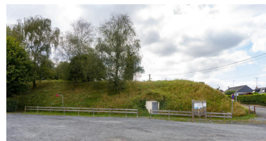
Le rempart gaulois ceinturant le bourg.