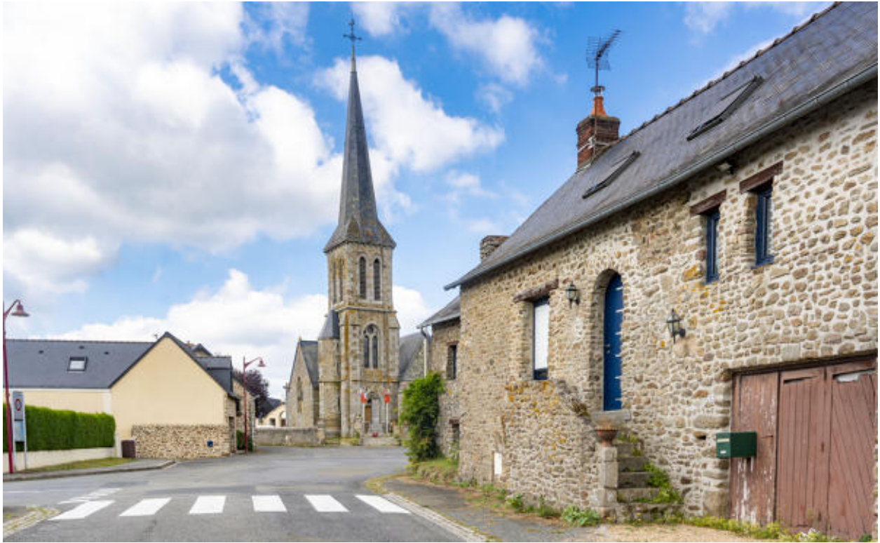
Le centre-bourg et l'église.