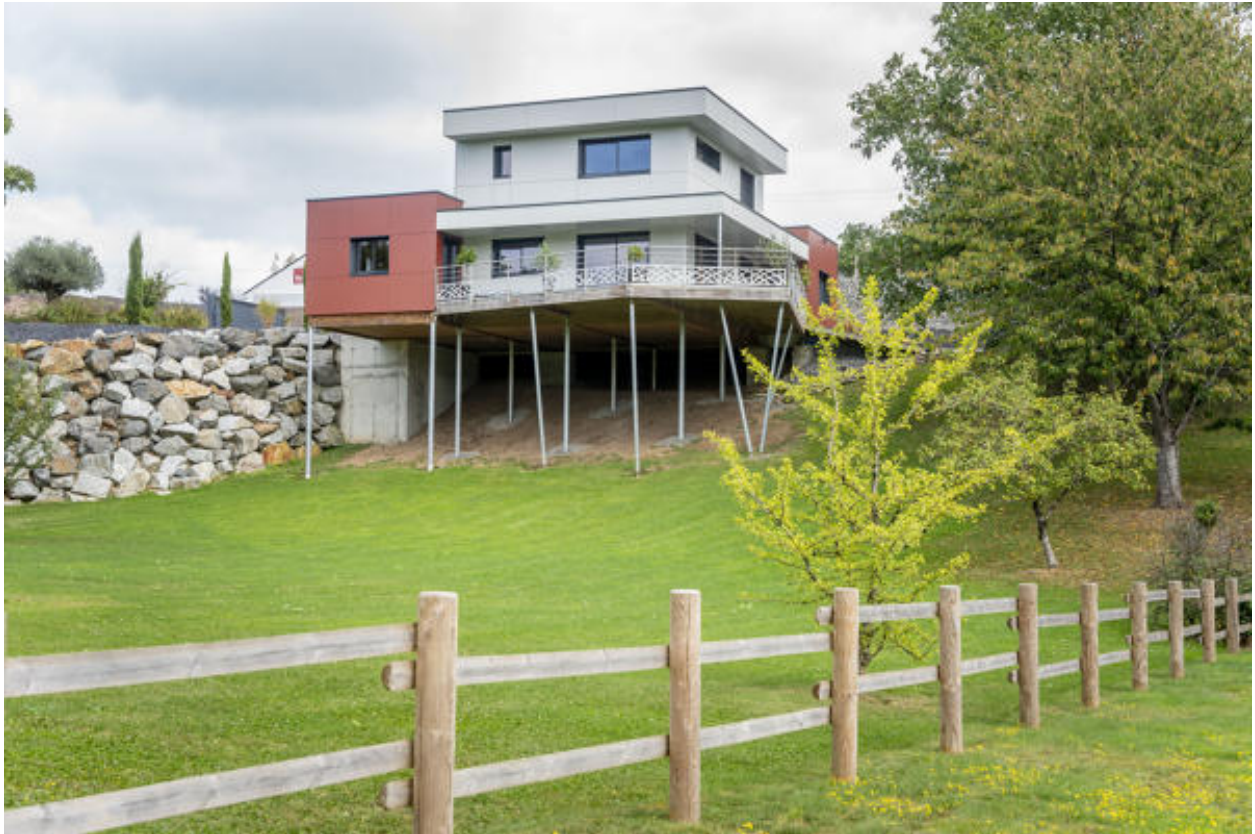
Une maison contemporaine sur pilotis à Beau-Rivage.