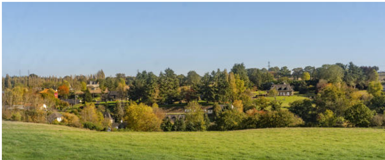
Les maisons de Beau-Rivage depuis le coteau opposé.