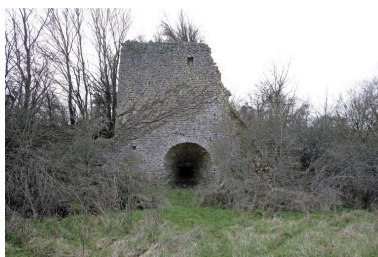
Le four vu depuis le nord. IVR52_20075301313NUCA

IVR52_20075301316NUCA