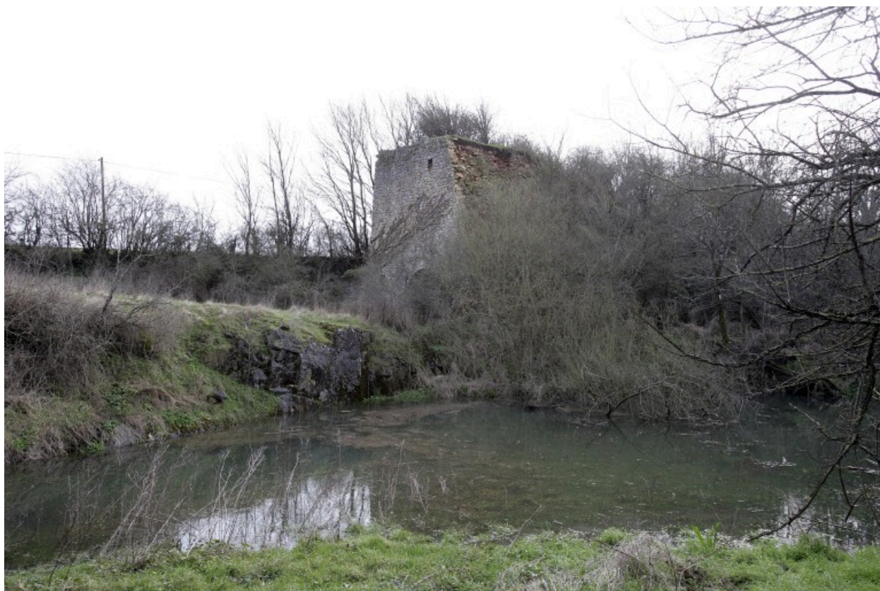
Vue d'ensemble du site depuis le nord-ouest : au premier plan, l'ancienne carrière, au second, le four à chaux.