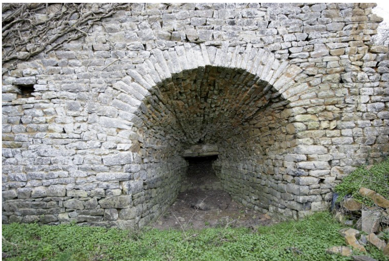
L'ouverture de déchargement.