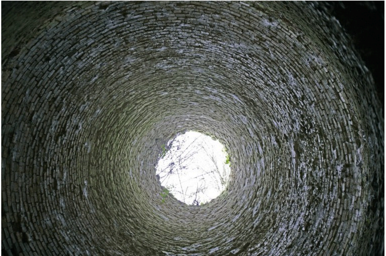
Vue intérieure du four depuis le bas : la cuve.