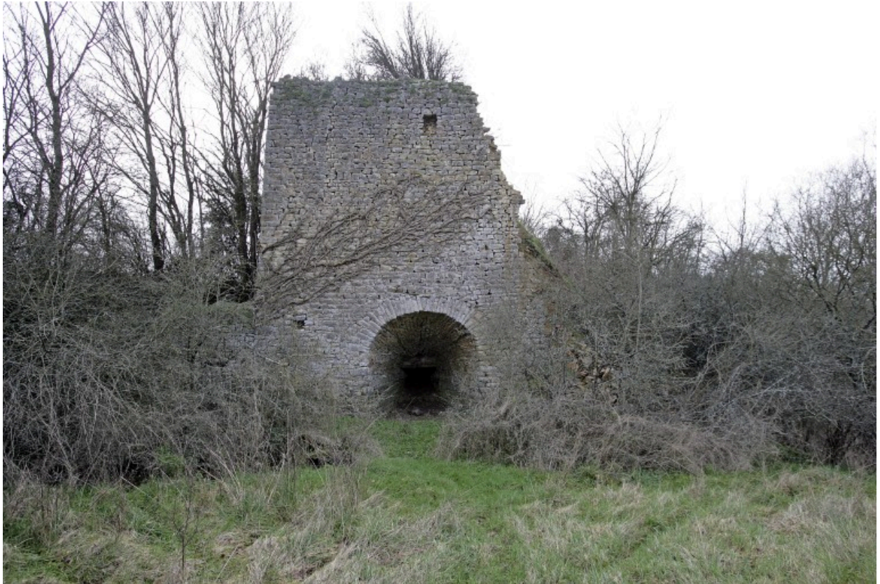
Le four vu depuis le nord.