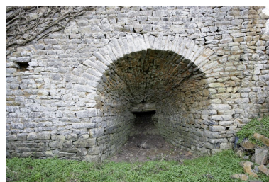
L'ouverture de déchargement. IVR52_20075301314NUCA