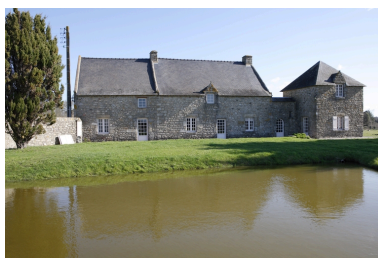
Vue d'ensemble depuis le sud-ouest. IVR52_20084400461NUCA