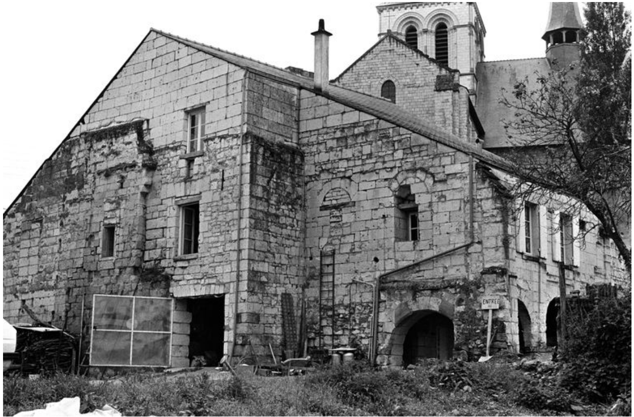
Vue générale depuis la cour, en 1979.