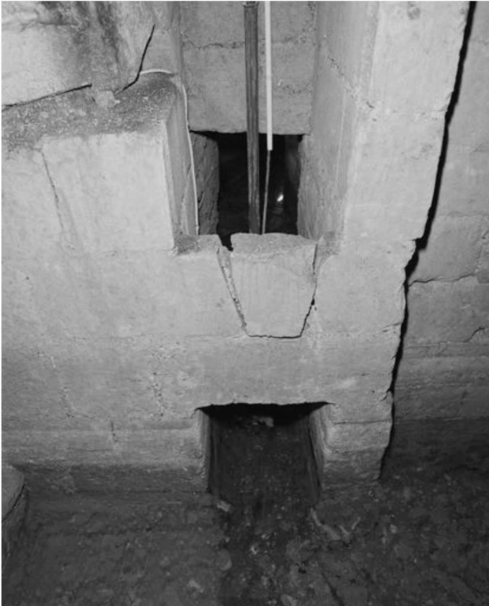
Sous-sol, système hydraulique, détail des canalisations.