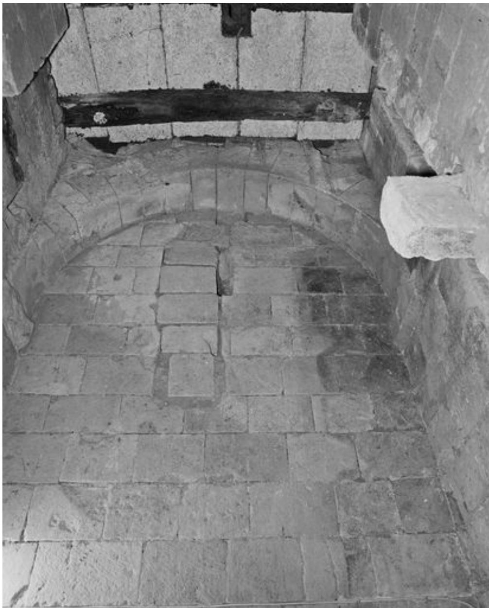
Sous-sol, système hydraulique, puits central des latrines (?).