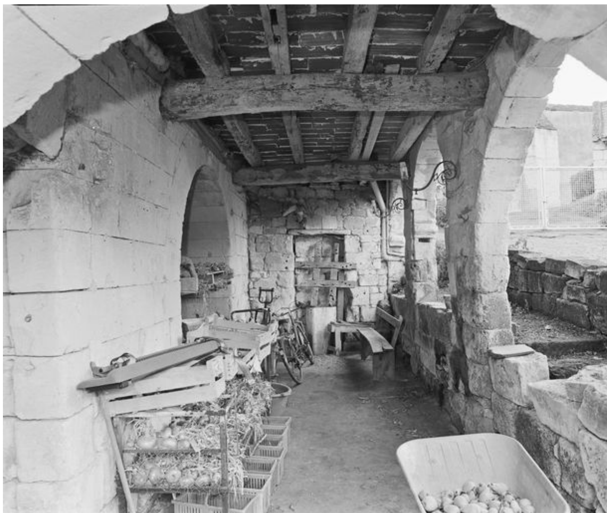
Rez-de-chaussée. Galerie ouverte sur l'ancienne cour de la Secrétainerie.