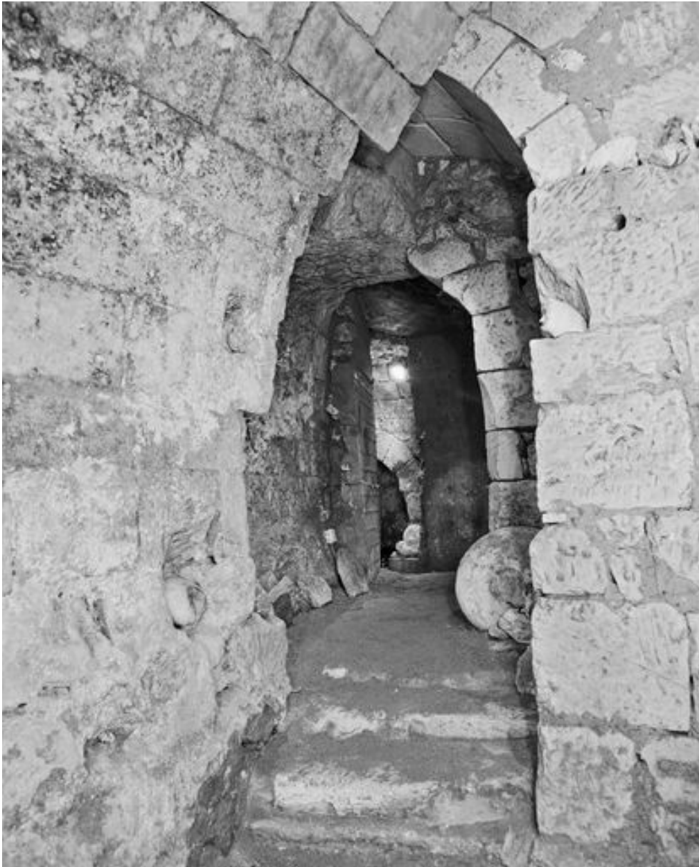
Sous-sol, enchevêtrement de caves d'époques diverses.