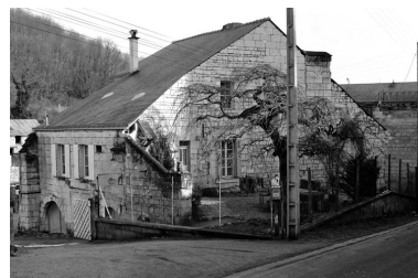
Vue générale depuis la rue, en 1980. IVR52_19804900915Z