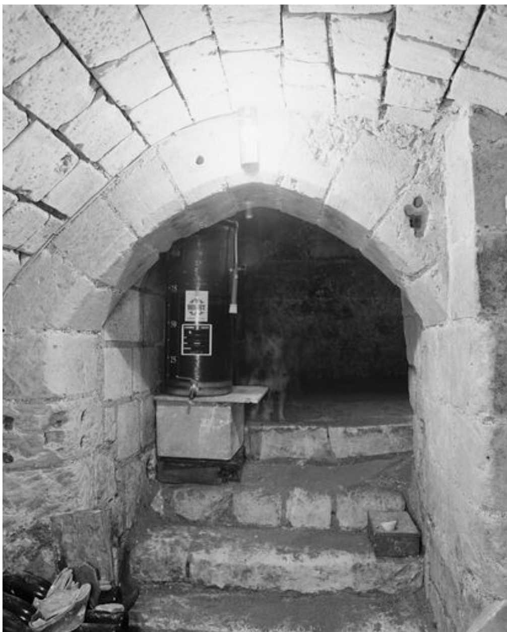
Sous-sol, porte à couverture en arc brisé et chanfreiné.