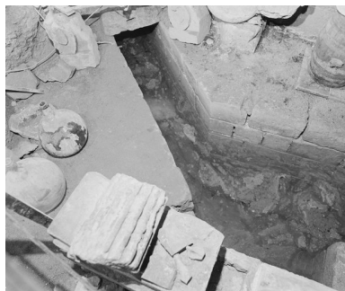
Sous-sol, système hydraulique, détail des canalisations.