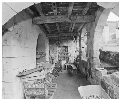
Rez-de-chaussée. Galerie ouverte sur l'ancienne cour de la Secrétainerie. IVR52_19964901732X