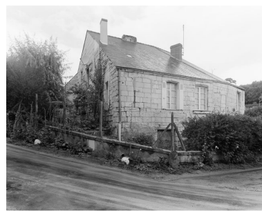
Vue générale de la façade est. IVR52_19964901737V