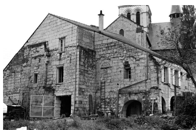
Vue générale depuis la cour, en 1979.