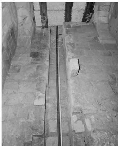
Sous-sol, système hydraulique, puits central des latrines (?).