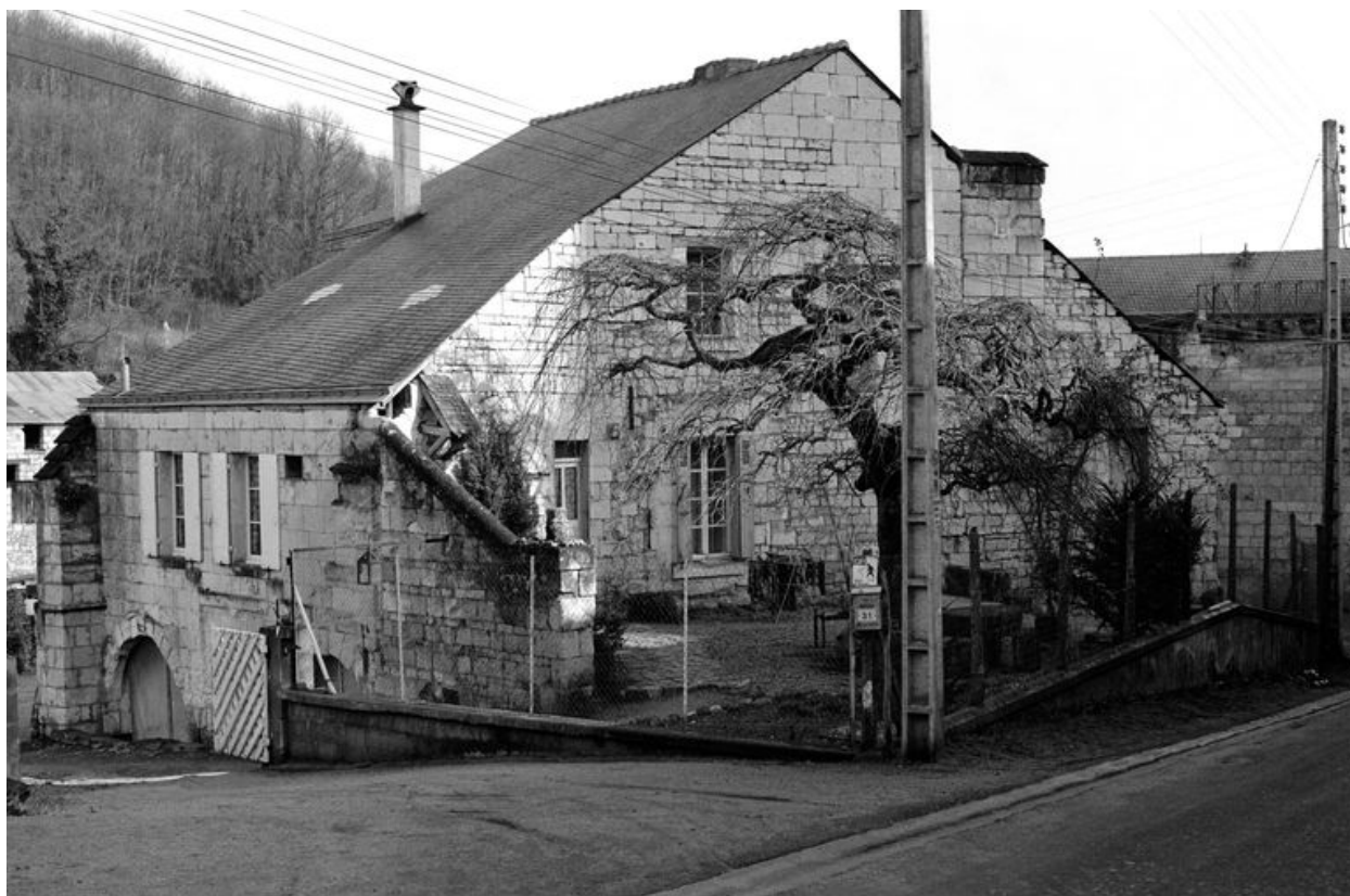
Vue générale depuis la rue, en 1980.