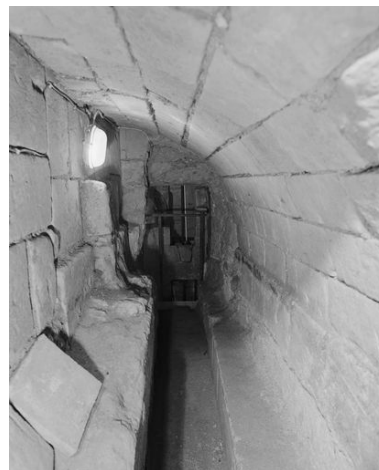
Sous-sol, système hydraulique, détail des canalisations. IVR52_19964901442X