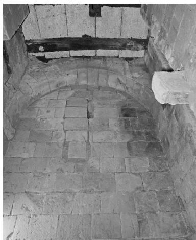
Sous-sol, système hydraulique, puits central des latrines (?). IVR52_19964901441X