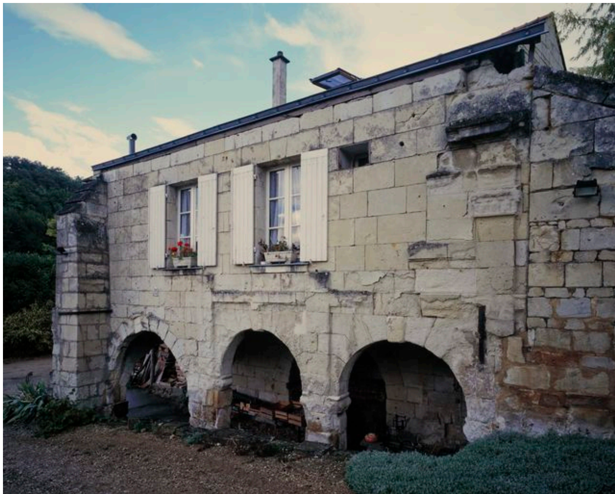
Vue générale de la façade ouest, sur cour, avec galerie de la fin du XVIe ou du début du XVIIe siècle.