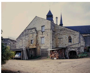
Vue générale de la façade nord, très remaniée.