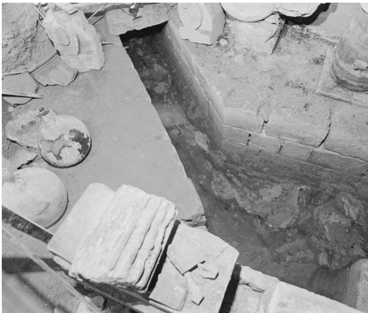
Sous-sol, système hydraulique, détail des canalisations.