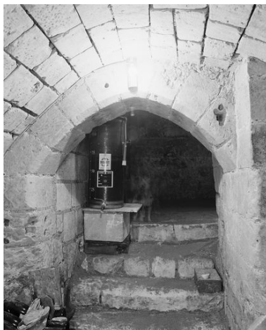
Sous-sol, porte à couverture en arc brisé et chanfreiné.