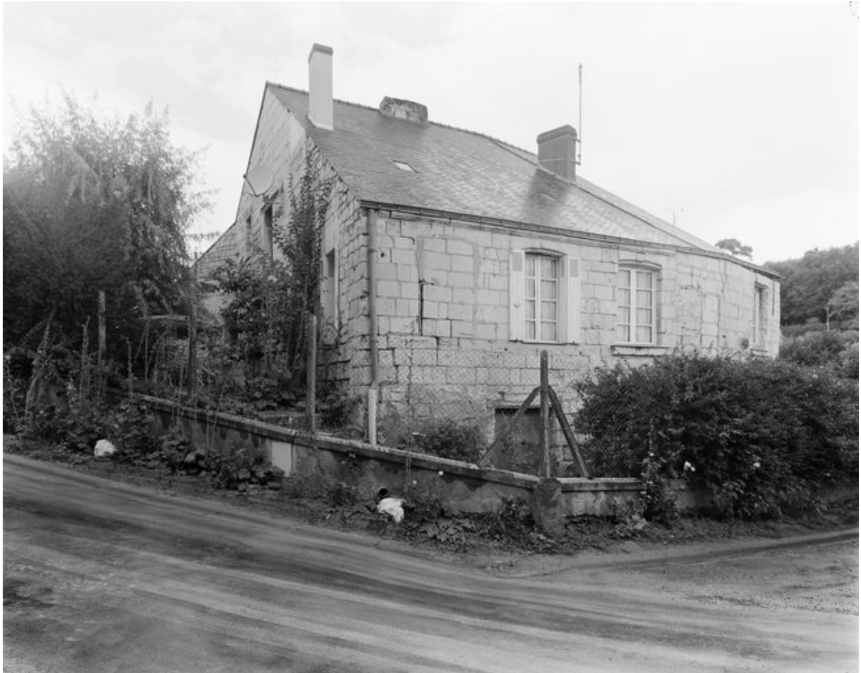
Vue générale de la façade est.