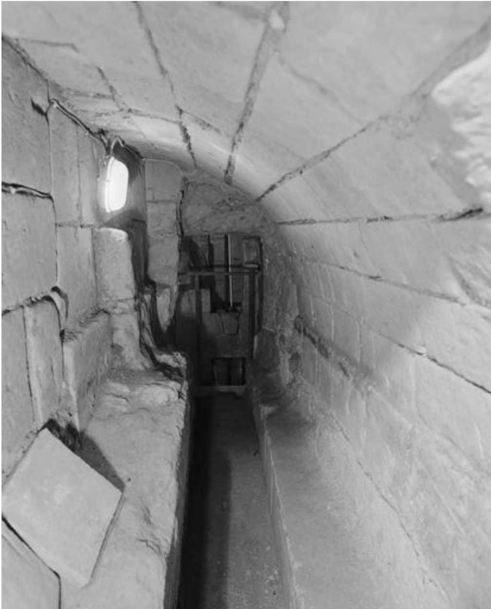
Sous-sol, système hydraulique, détail des canalisations.