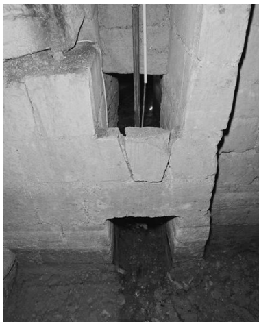
Sous-sol, système hydraulique, détail des canalisations. IVR52_19964901439X