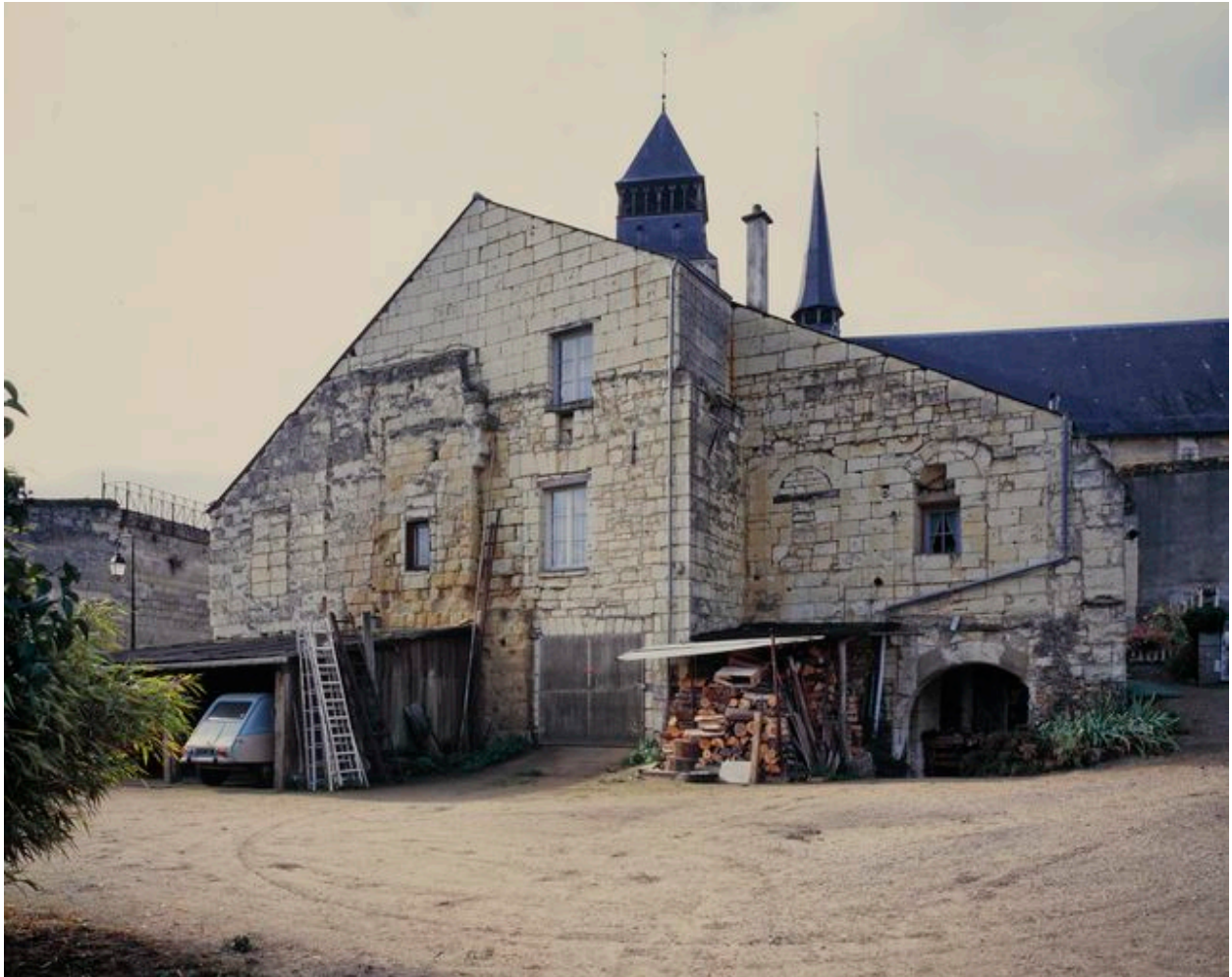
Vue générale de la façade nord, très remaniée.