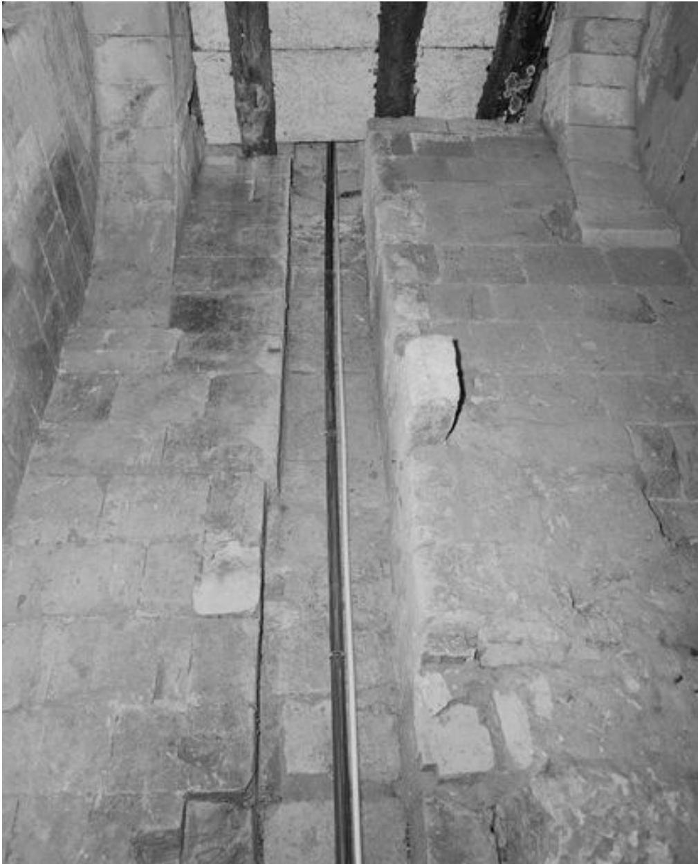
Sous-sol, système hydraulique, puits central des latrines (?).