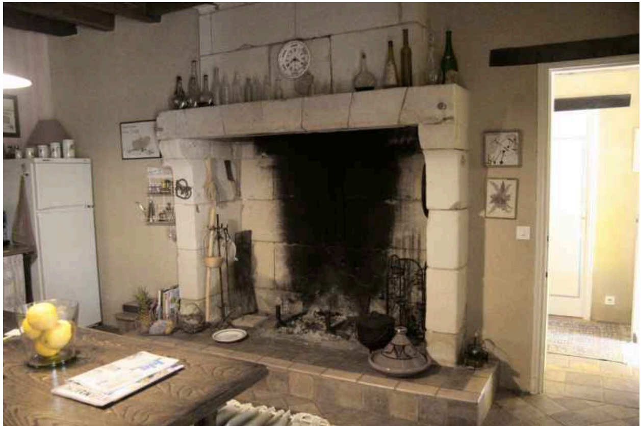
Salle à droite : cheminée début XIXe s.