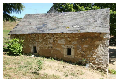
Écurie : façade postérieure.