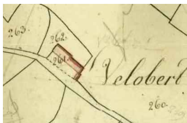
Plan en 1811. IVR52_20057204103NUCA