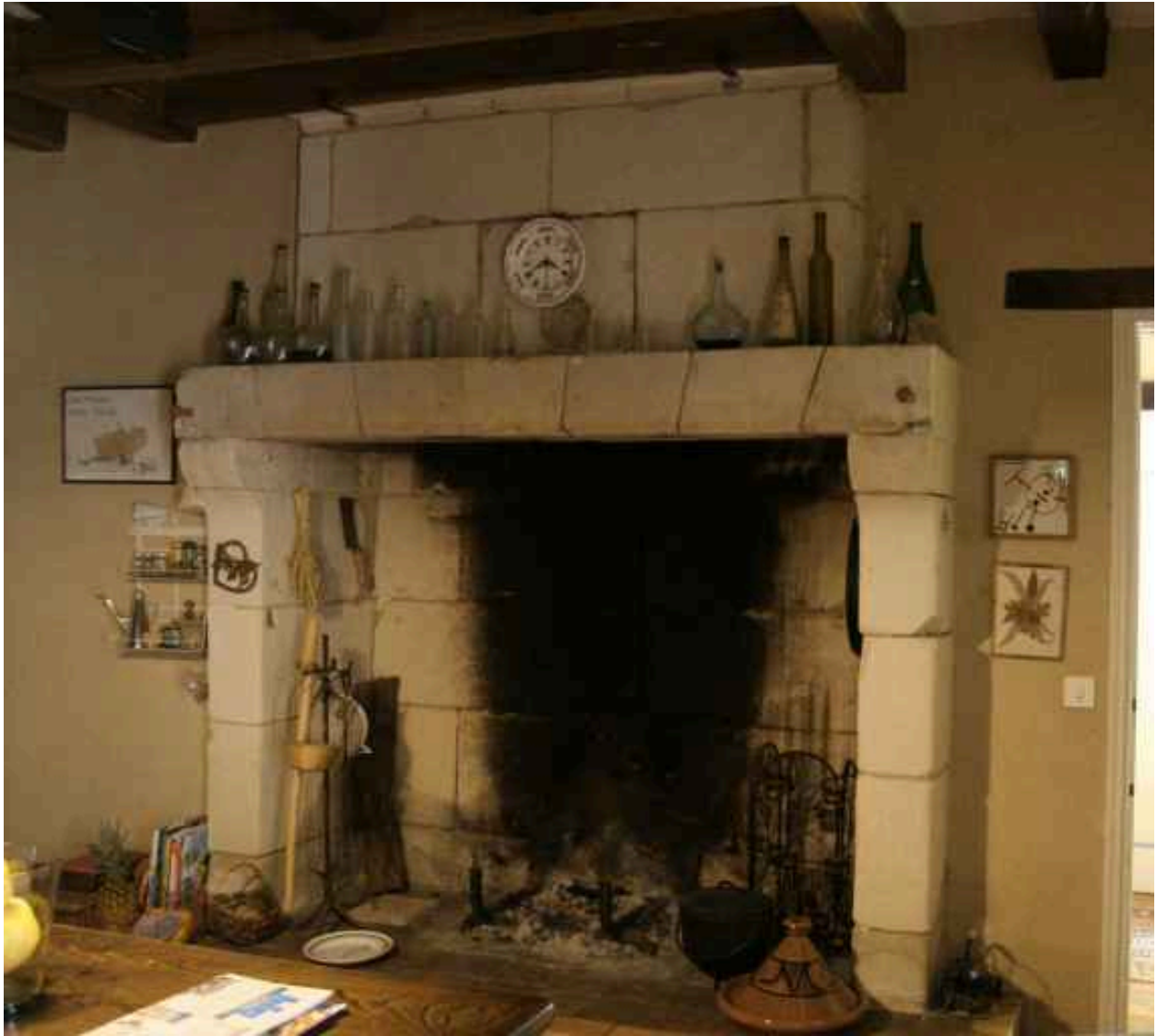
Salle à droite, cheminée.