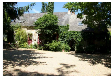
Façade antérieure sur cour. IVR52_20067205779NUCA