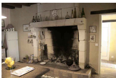
Salle à droite : cheminée début XIXe s.