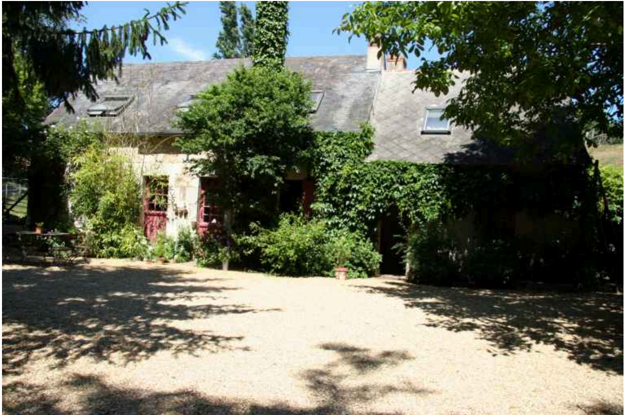
Façade antérieure sur cour.