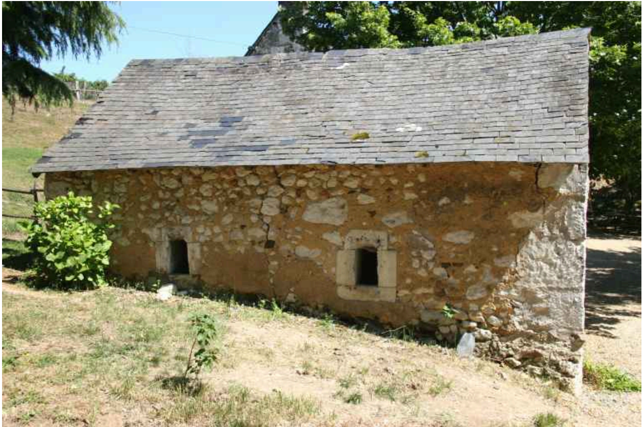
Écurie : façade postérieure.