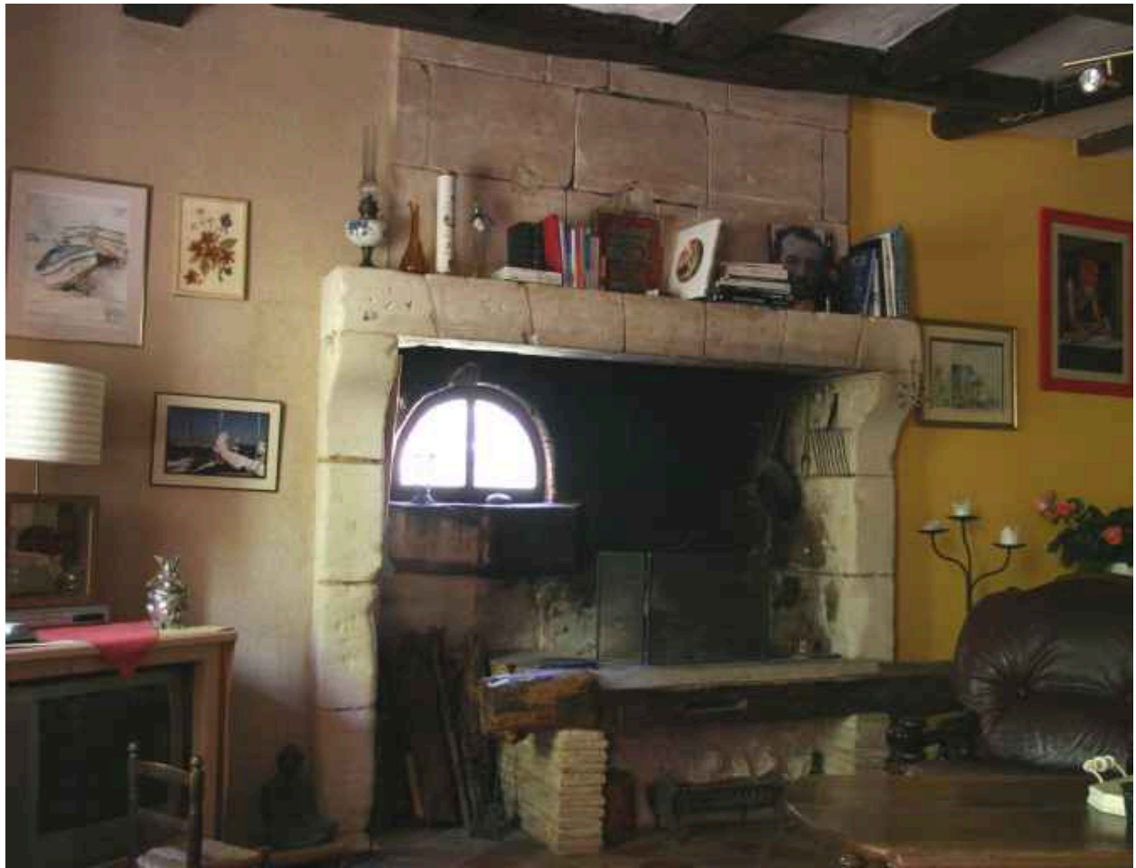
Salle à gauche : cheminée avec four (disparu).