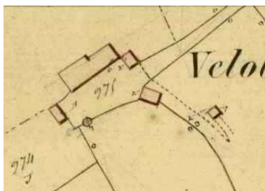
Plan en 1845. IVR52_20057204159NUCA