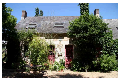
Façade antérieure, détail. IVR52_20067205778NUCA