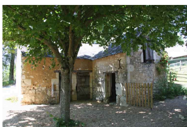
Écurie et toit à porcs ? IVR52_20067205783NUCA