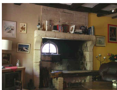
Salle à gauche : cheminée avec four (disparu).