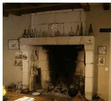
Salle à droite, cheminée. IVR52_20067205781NUCA