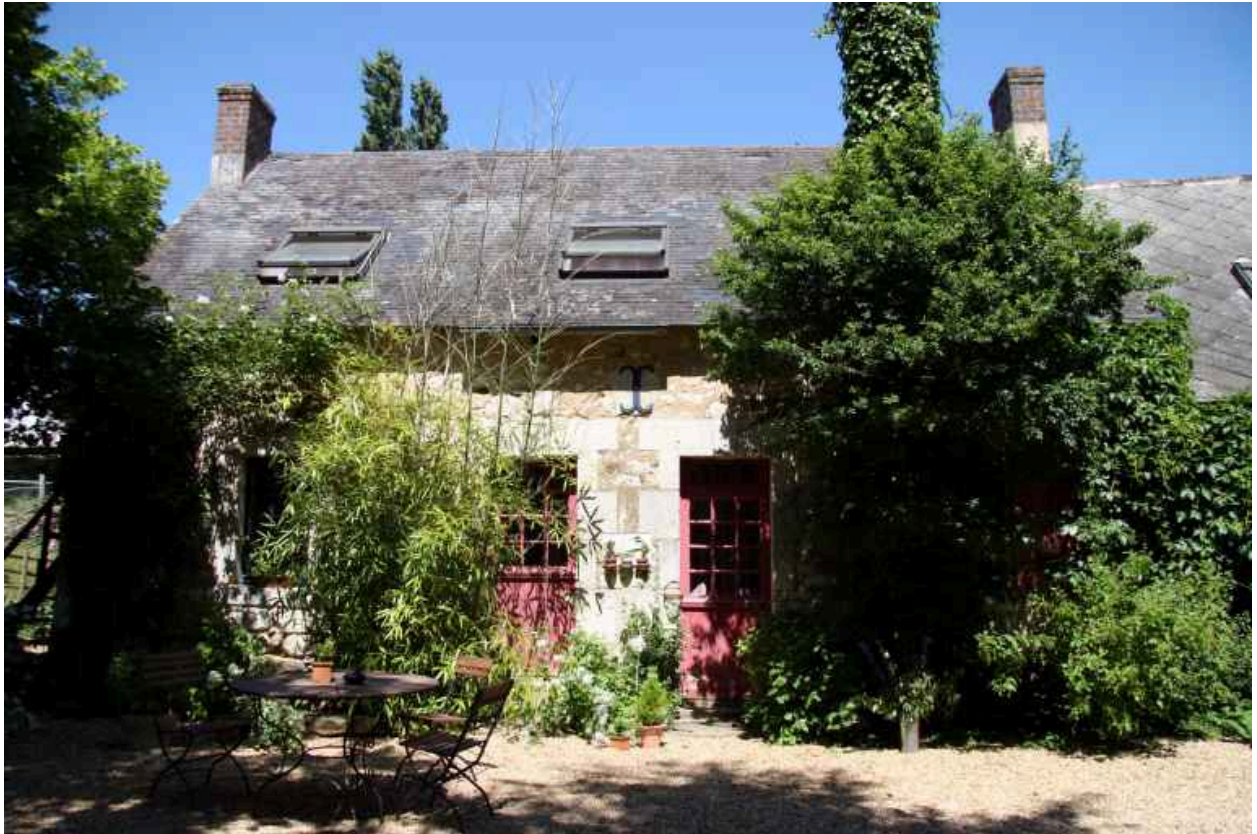
Façade antérieure, détail.