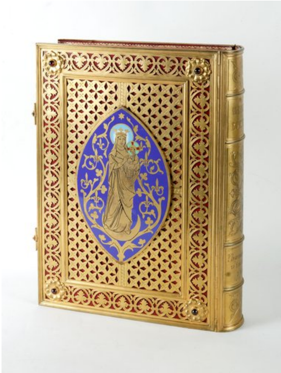
Vue du livre, montrant le plat de reliure postérieur avec la Vierge à l'Enfant.