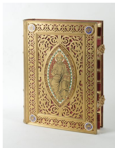
Vue du livre, montrant le plat de reliure supérieur avec le Christ bénissant et, aux quatre coins, le Tétramorphe.