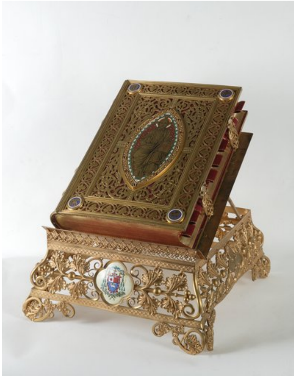
Vue du livre sur le pupitre.