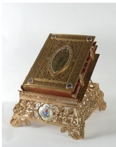
Vue du livre sur le pupitre. IVR52_20088500093NUCA