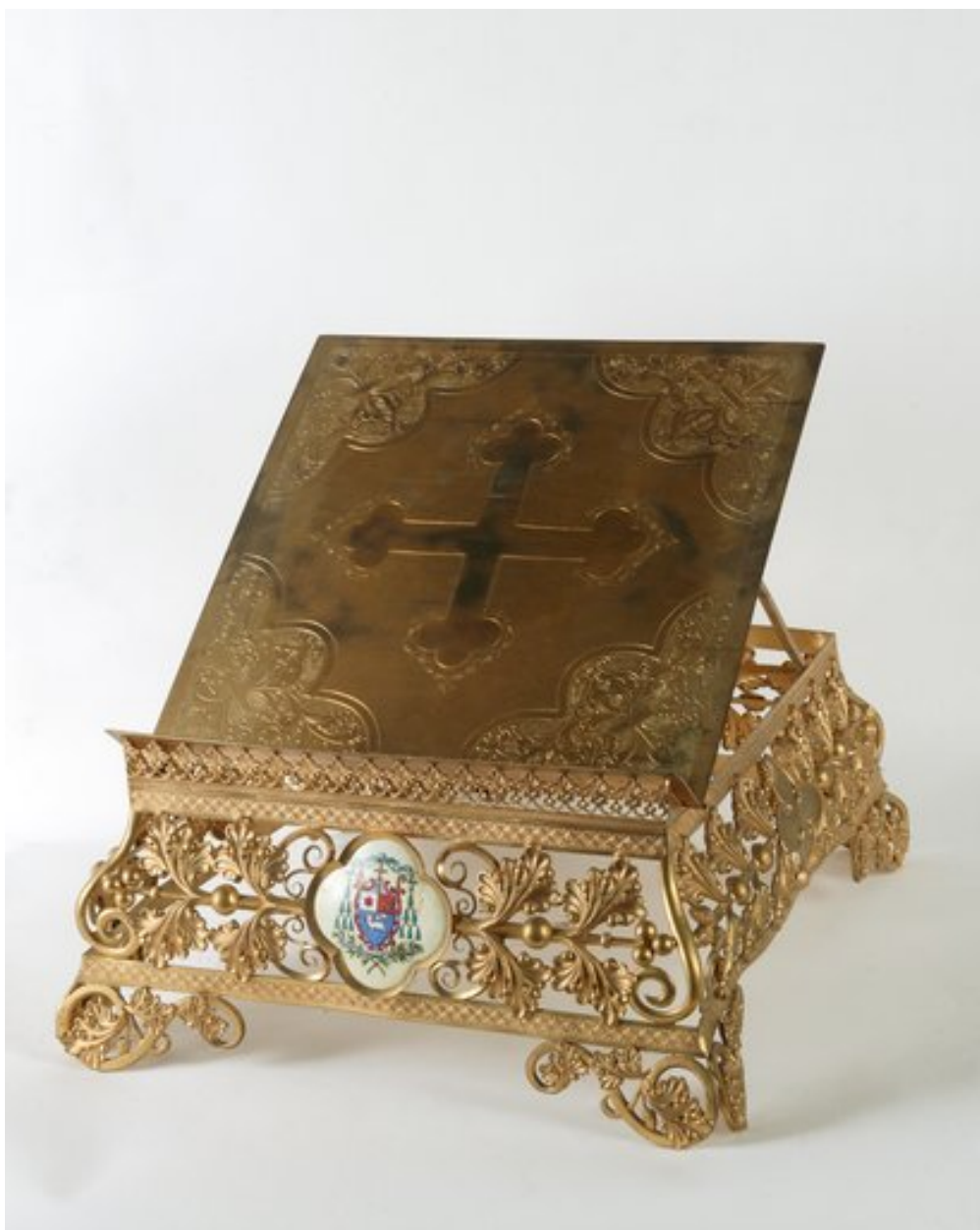
Vue du pupitre, avec les armoiries de Mgr Catteau.