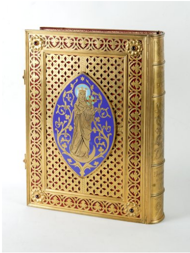
Vue du livre, montrant le plat de reliure postérieur avec la Vierge à l'Enfant. IVR52_20088500090NUCA