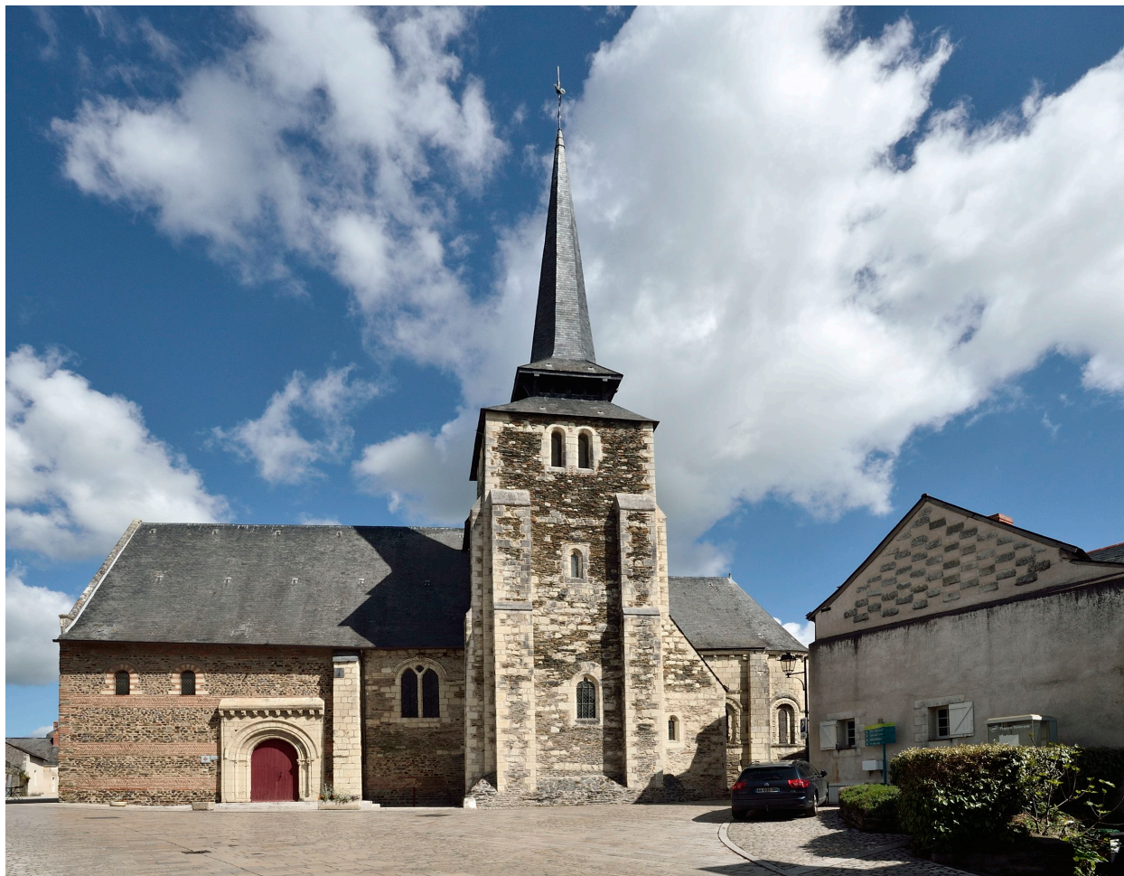
Vue de l'église Saint-Pierre depuis l'ouest.