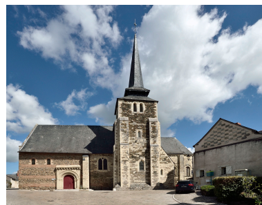
Vue de l'église Saint-Pierre depuis l'ouest. IVR52_20164900414NUCA