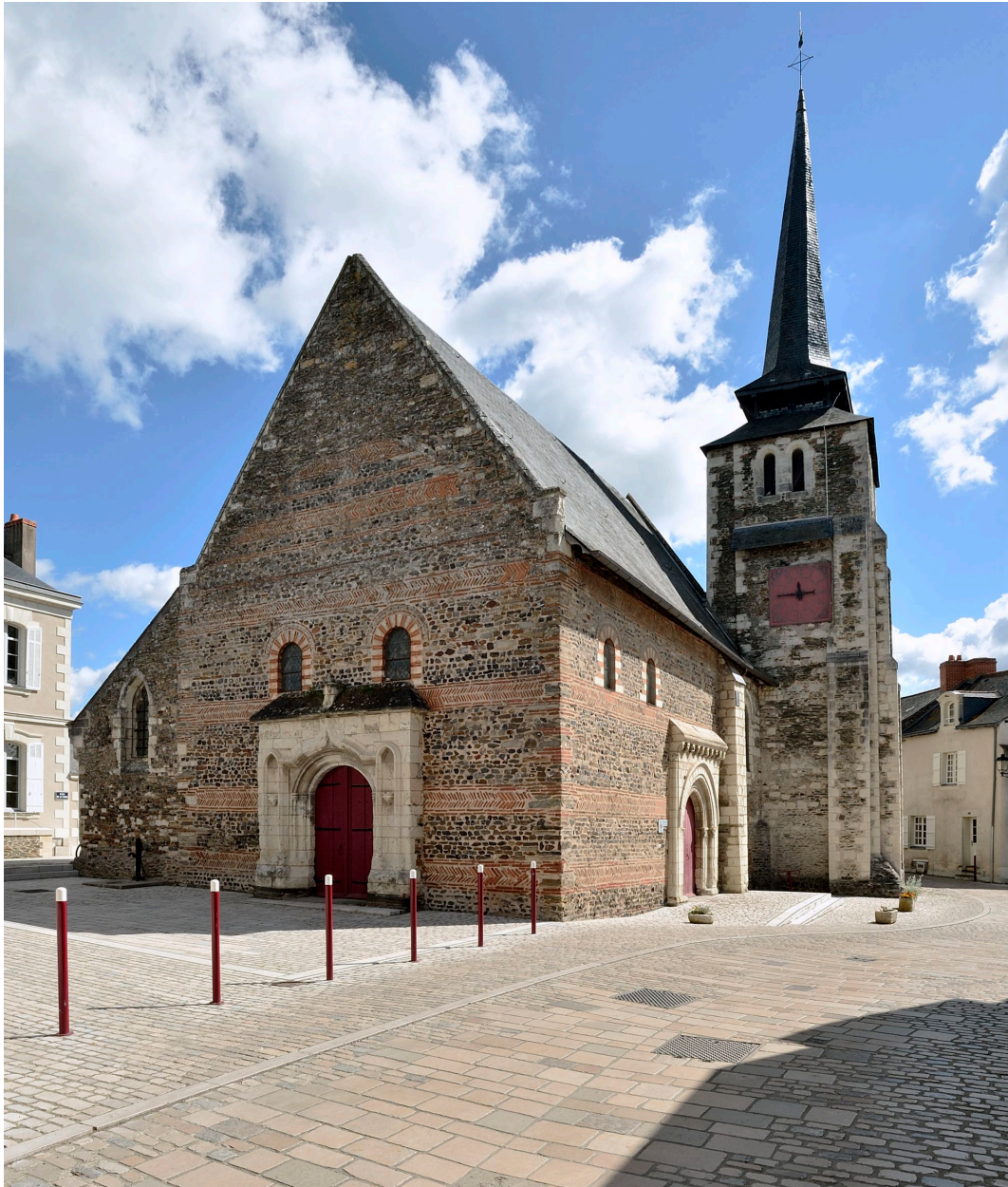
Vue de l'église Saint-Pierre depuis le sud-ouest.