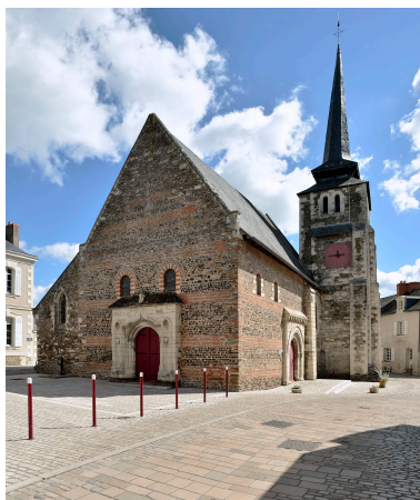
Vue de l'église Saint-Pierre depuis le sud-ouest. IVR52_20164900415NUCA