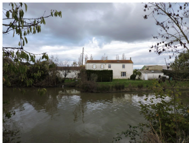
L'ancienne ferme, au bord du canal, vue depuis le sud. IVR52_20198503186NUCA