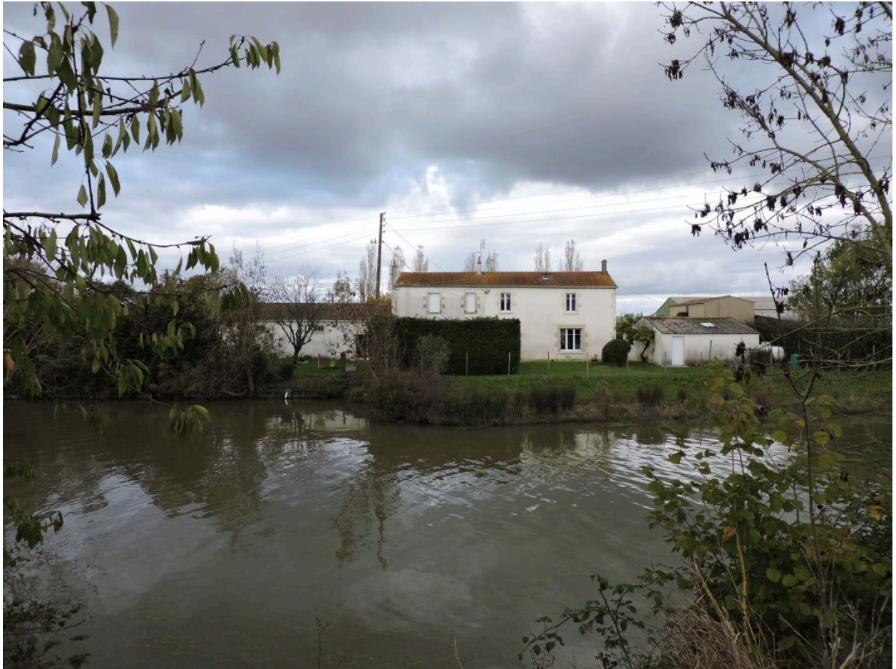
L'ancienne ferme, au bord du canal, vue depuis le sud.