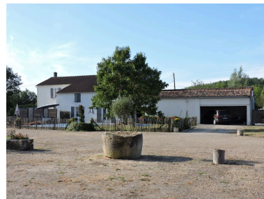
Le logis, à gauche, et les anciennes granges-étables, à droite, vus depuis le nord. IVR52_20198502857NUCA