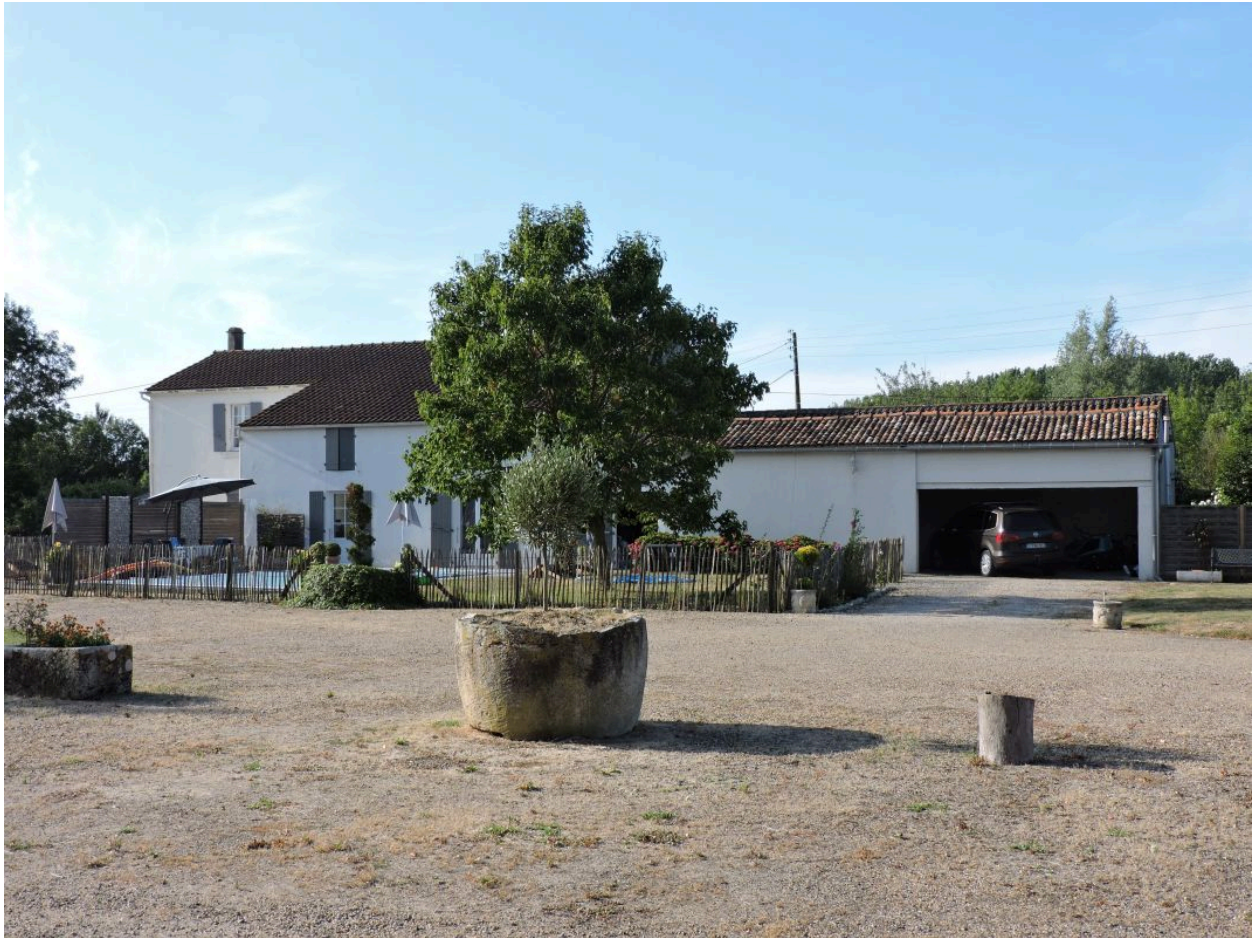
Le logis, à gauche, et les anciennes granges-étables, à droite, vus depuis le nord.