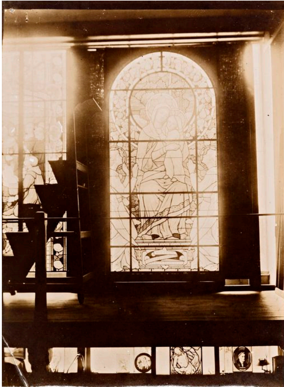
Photographie de la verrière dans l'atelier d'Auguste Alleaume, avant sa pose.