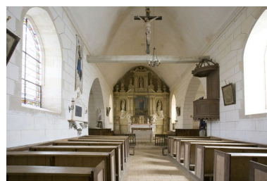
Intérieur : nef et chœur. IVR52_20087201392NUCA