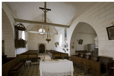
Intérieur : nef depuis le chœur. IVR52_20087201391NUCA