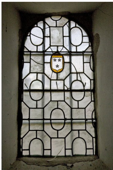
Sacristie, vitrail de la fenêtre postérieure gauche, 3e quart du XVIIe siècle. IVR52_20087201390NUCA