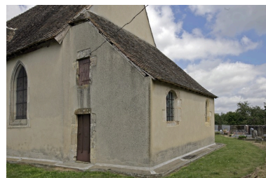
Sacristie. IVR52_20077200759NUCA