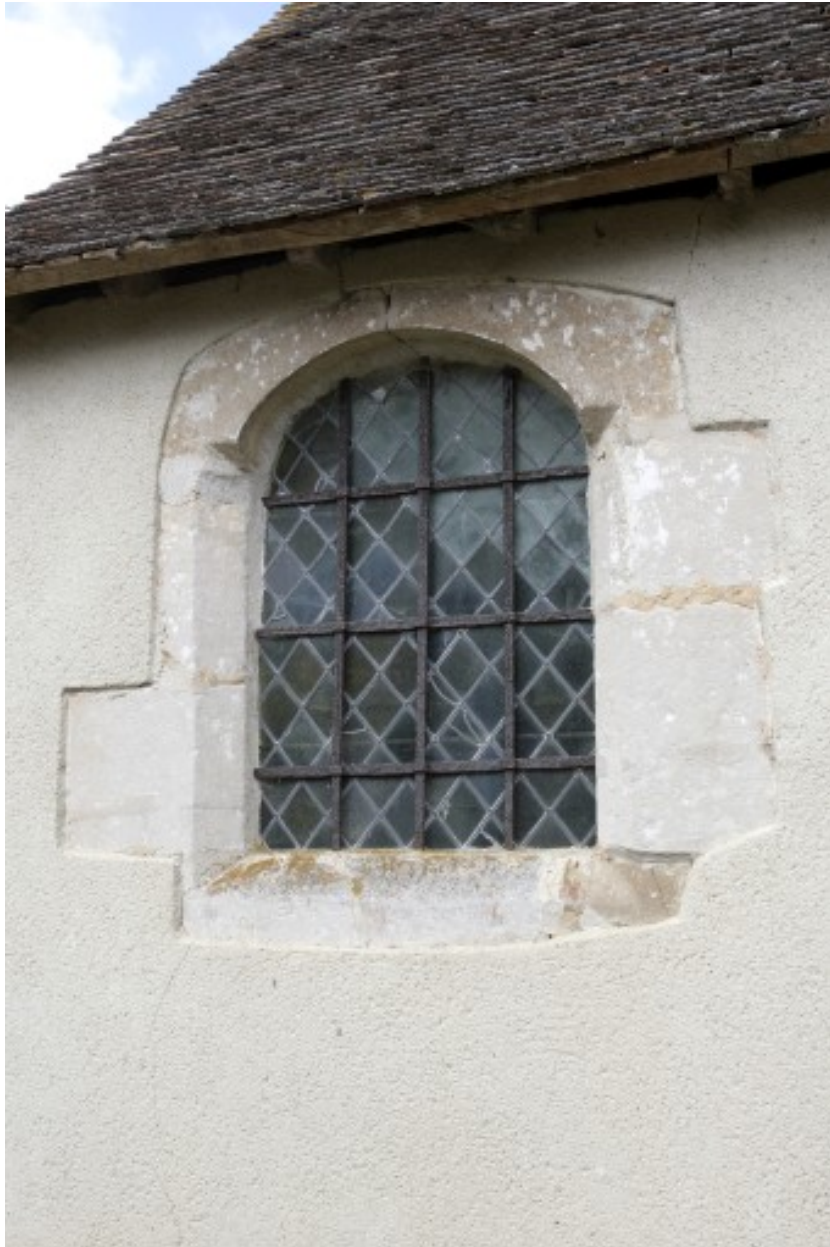
Sacristie, fenêtre postérieure droite, remaniement de 1823-25 ?