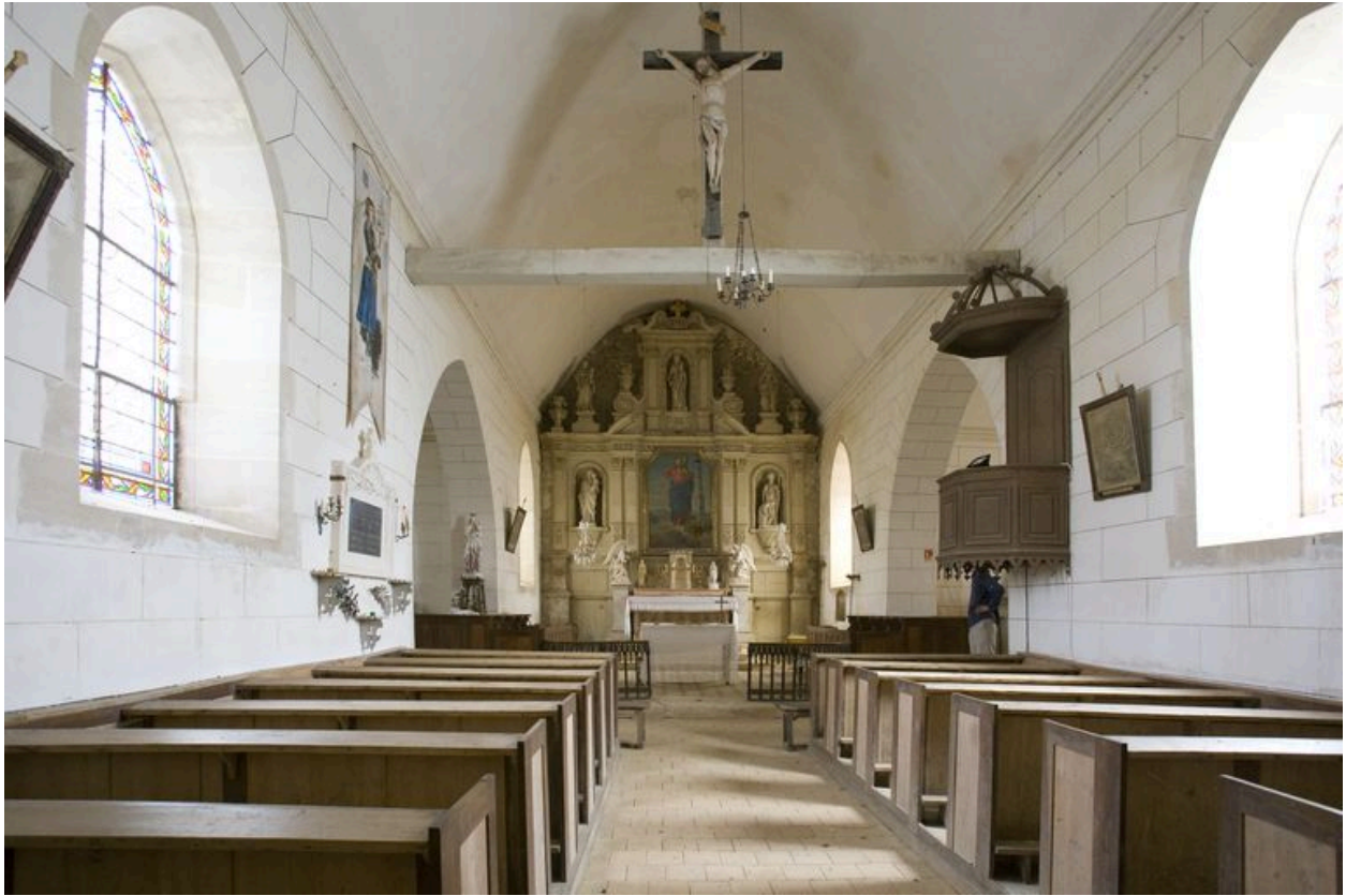
Intérieur : nef et chœur.