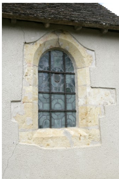
Sacristie : fenêtre postérieure gauche, 3e quart du 17e siècle. IVR52_20077200760NUCA