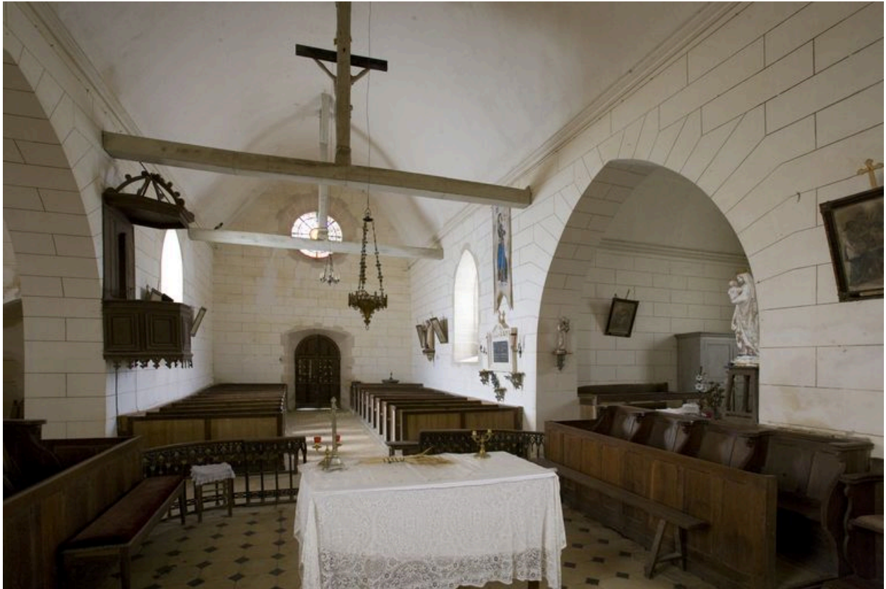
Intérieur : nef depuis le chœur.