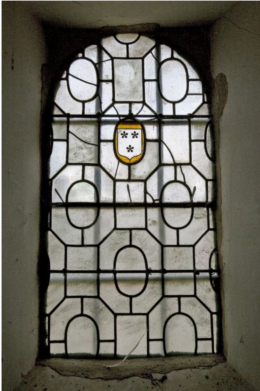
Sacristie, vitrail de la fenêtre postérieure gauche, 3e quart du XVIIIe siècle.