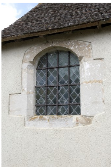
Sacristie, fenêtre postérieure droite, remaniement de 1823-25 ? IVR52_20077200761NUCA