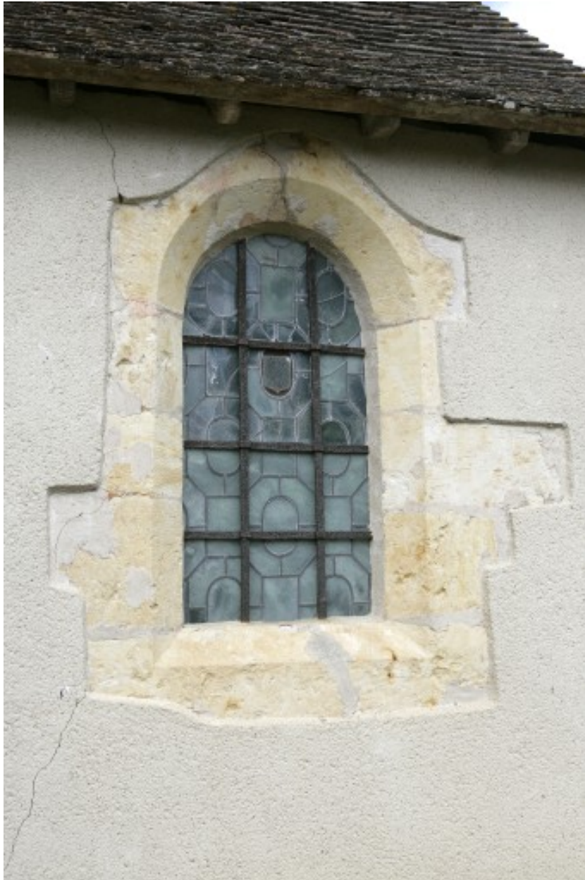
Sacristie : fenêtre postérieure gauche, 3e quart du 17e siècle.