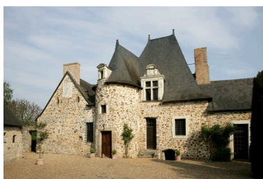
Le manoir des Croisnières.