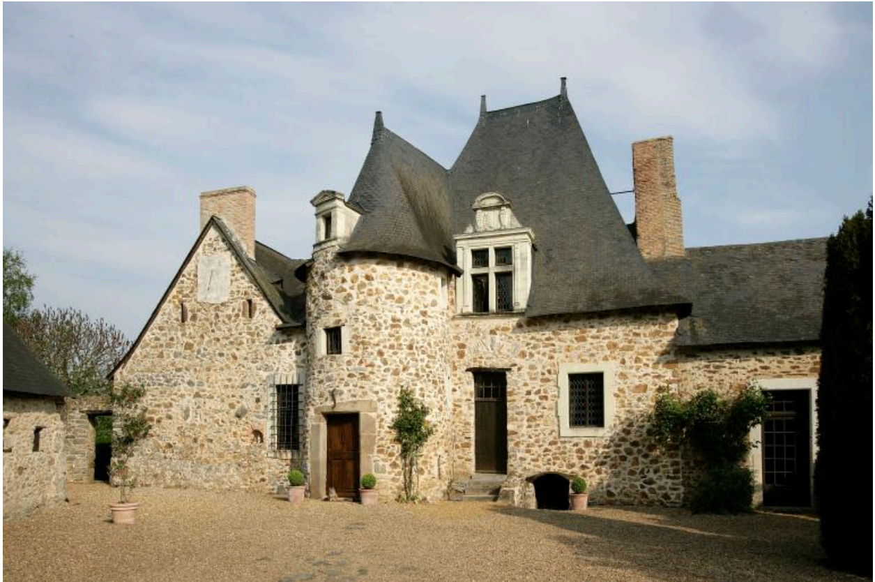
Le manoir des Croisnières.