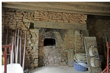
Logis : cheminée du fournil. IVR52_20077200643NUCA