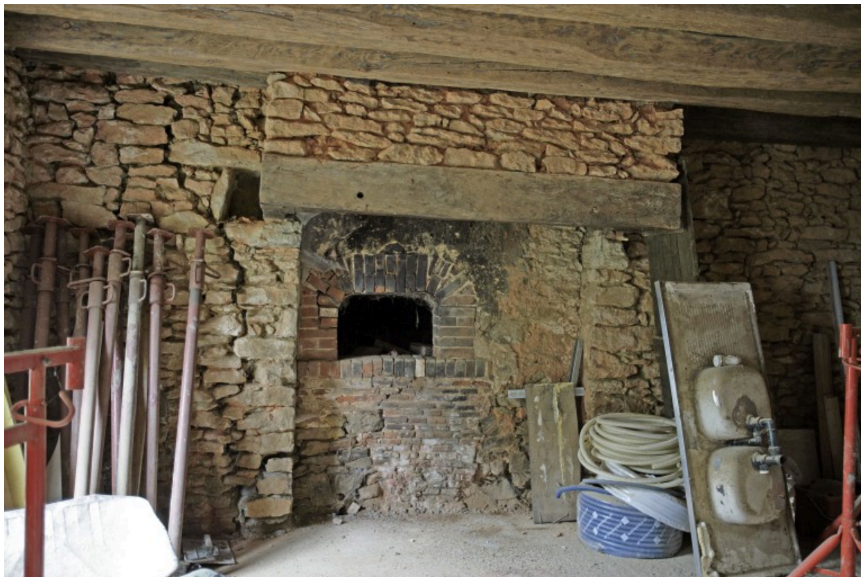
Logis : cheminée du fournil.