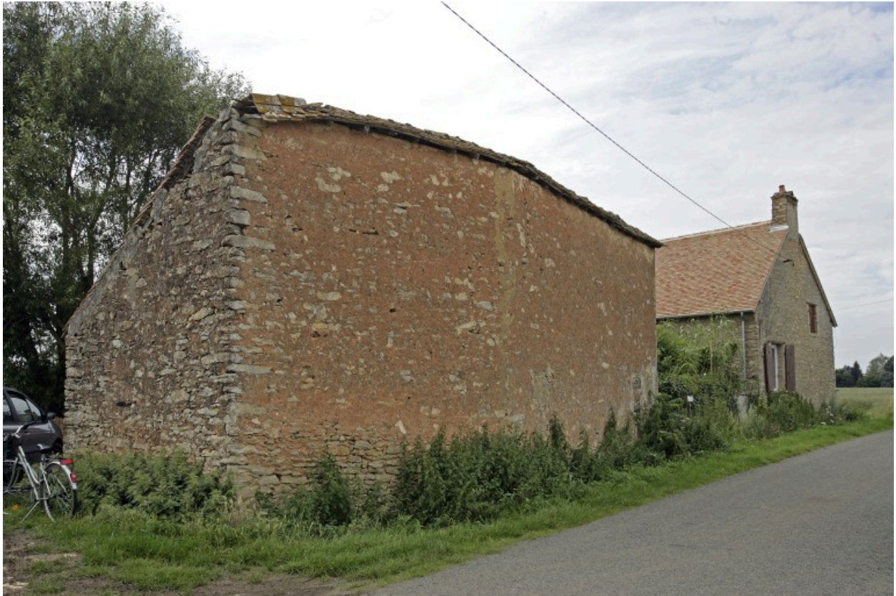
Étables : élévation postérieure.