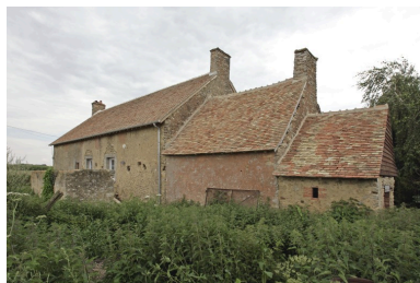
Logis : élévation postérieure.