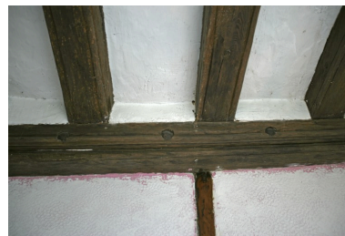
Logis : lambourdes et solives moulurées. IVR52_20077200644NUCA