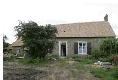
Logis : élévation antérieure. IVR52_20077200645NUCA