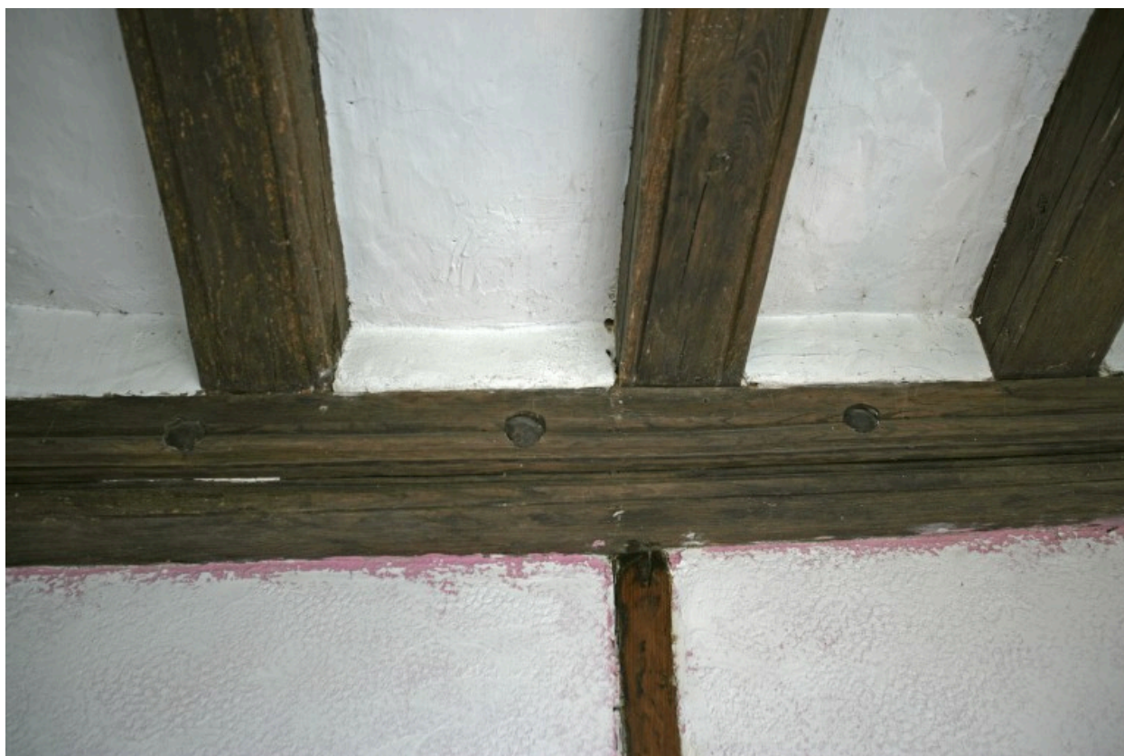
Logis : lambourdes et solives moulurées.