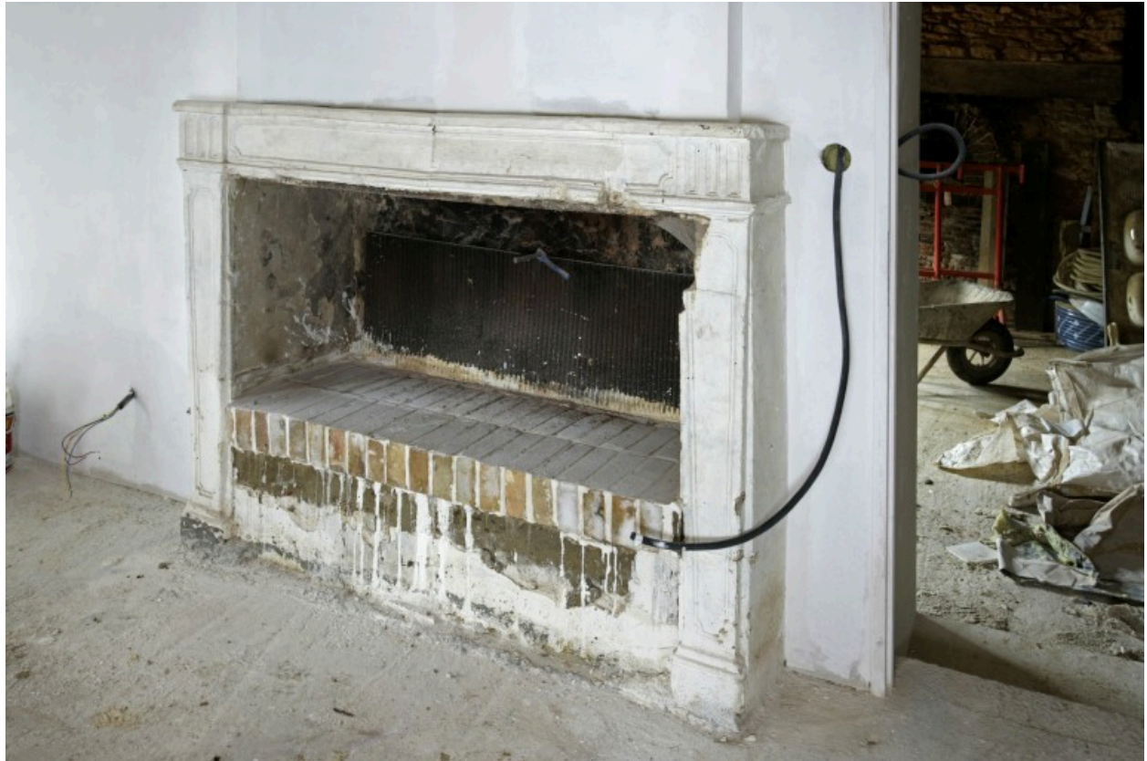
Logis : cheminée, XVIIIe siècle.