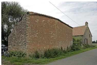
Étables : élévation postérieure.