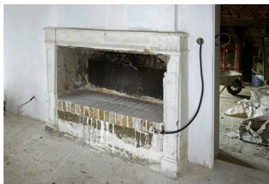
Logis : cheminée, XVIIIe siècle. IVR52_20077200642NUCA