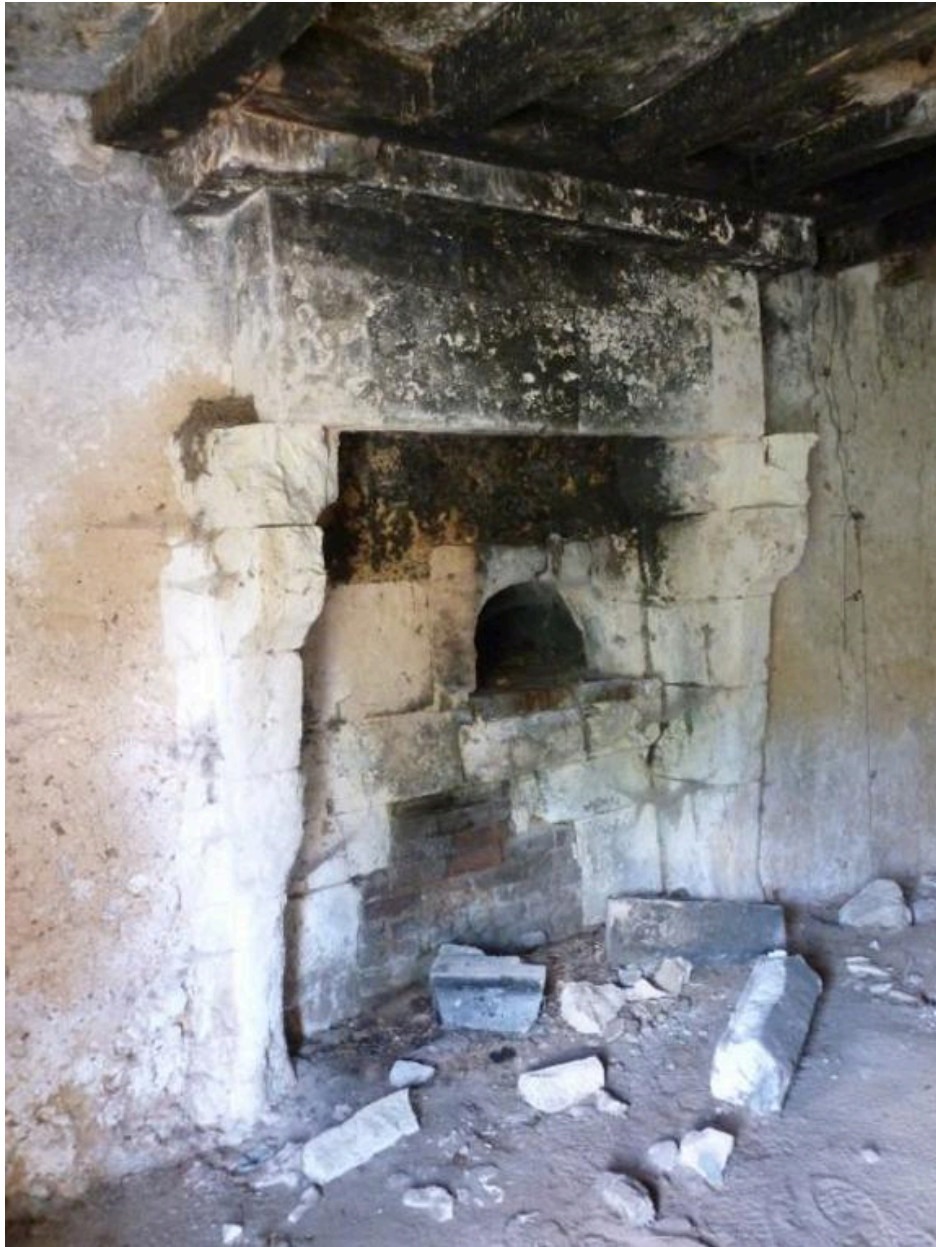
Ferme bloc à terre, maison : cheminée au mur ouest.