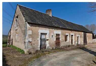
Vue de volume de la ferme bloc à terre (orientée au sud).