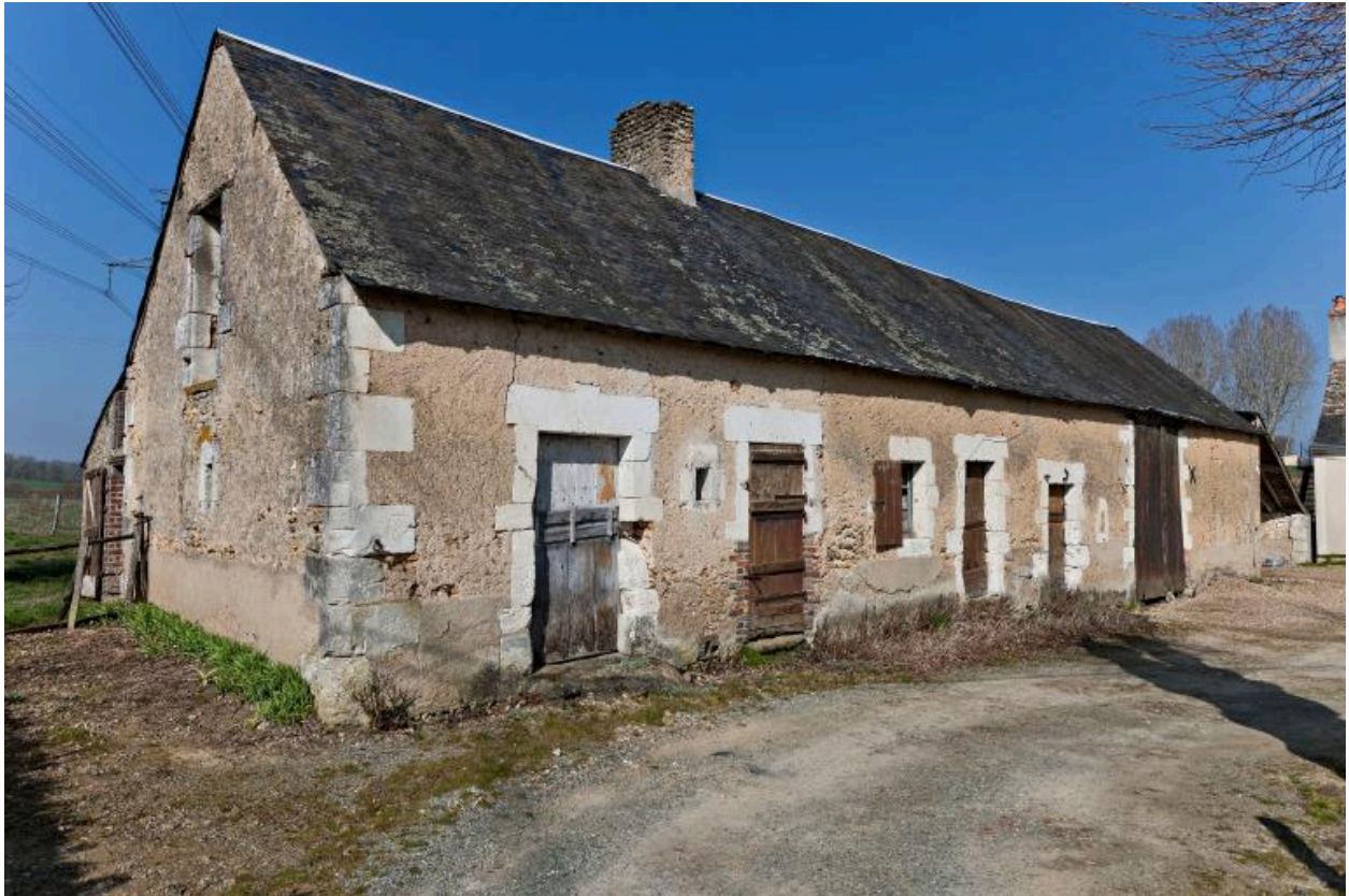
Vue de volume de la ferme bloc à terre (orientée au sud).