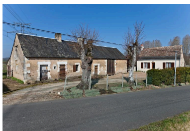
Vue d'ensemble : ferme bloc à terre à gauche, maison à droite. IVR52_20127200377NUCA