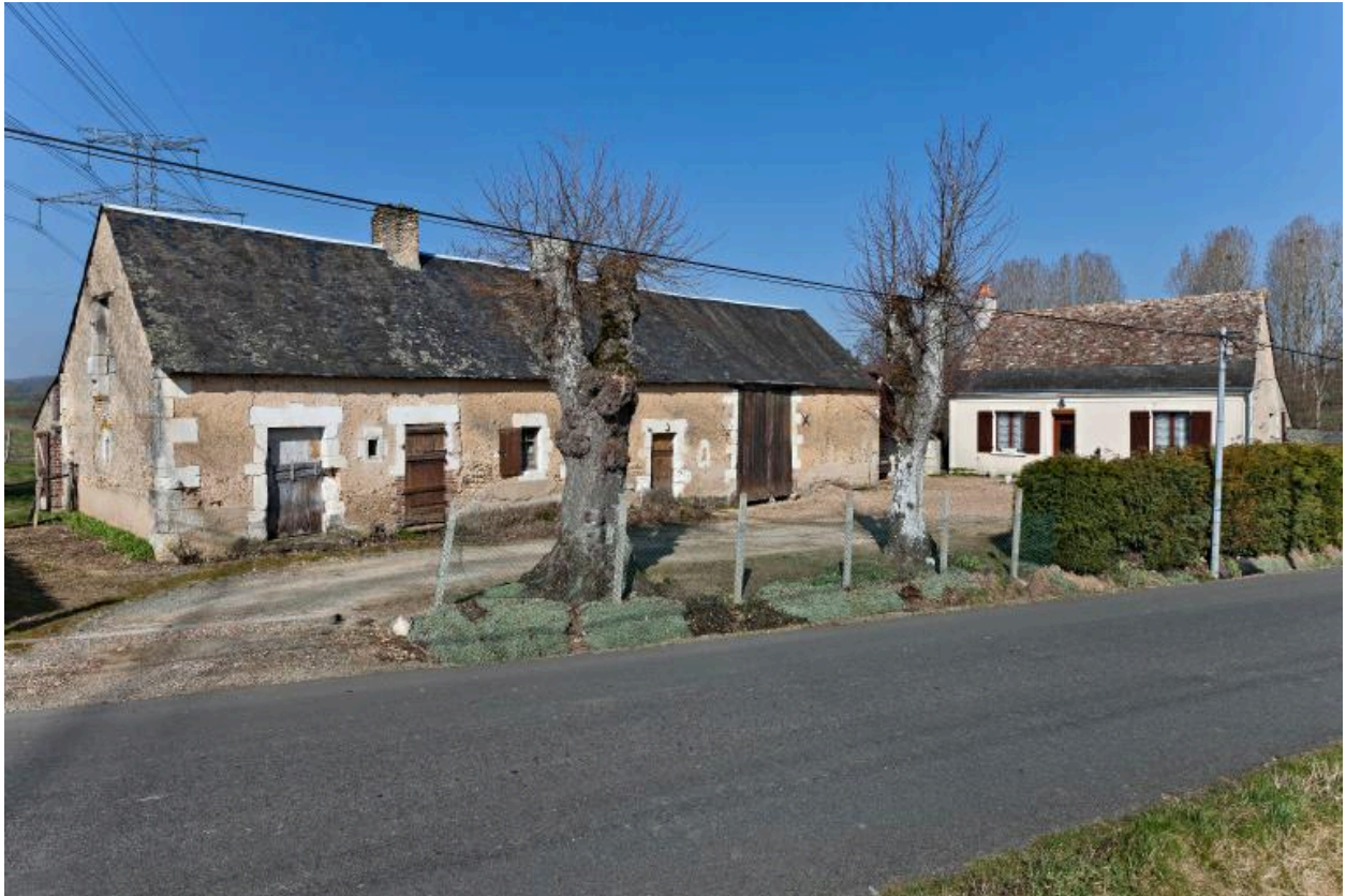
Vue d'ensemble : ferme bloc à terre à gauche, maison à droite.