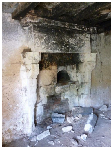
Ferme bloc à terre, maison : cheminée au mur ouest. IVR52_20127200712NUCA